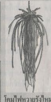
โคมไฟหวายรังไหม