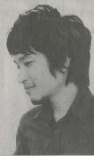
นครินทร์