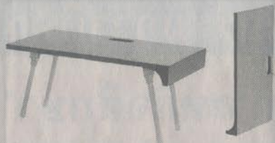
โต๊ะเซอร์วิส ผลงานรัฐพล

ในปัจจุบันมีหลายเวทีเปิดโอกาสให้นักศึกษา แสดงความสามารถในด้านต่างๆ อย่าง เต็มที่ และหนึ่งในนั้นก็คือเวทีการผลิต เฟอร์นิเจอร์ ในโครงการพัฒนารูปแบบของ ขวัญของข้าวสวย เครื่องใช้และตกแต่งบ้าน