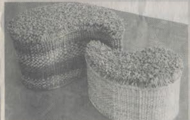
เก้าอี้หยินหยาง ผลงานคุณวุฒิ