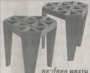
สตาร์สตูล ผลงานนครินทร์

“ให้ผมเข้าใจโลกการทำงานจริงว่าเป็นอย่างไร” นายคุณวุฒิกล่าว