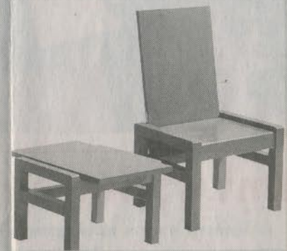
Chair - Table - Chair

อดีตนักศึกษาด้านการออกแบบผลิตภัณฑ์ ที่เพิ่งจบจาก มรท.พระนครหมาดๆ ได้โชว์กิ้น โคนใจผู้ผลิตเฟอร์นิเจอร์ไม่ส่งออกซื้อดั่งอย่าง บริษัท อุดสาหกรรมดีสวีดี จำกัด ด้วยผลิตภัณฑ์เก้าอี้ชื่อ ดาว (Star Stool) ที่สามารถสร้างมูลค่ากับสินค้าได้ราคาไม่ต่ำกว่า 6,000-7,000 บาท โดยใช้เทคนิคนำไม้ชิ้นเล็กๆ หลายชิ้นมาประกอบเข้าด้วยกันให้ดูเหมือนงานแกะสลัก โดยใช้เศษไม้ที่เหลือ