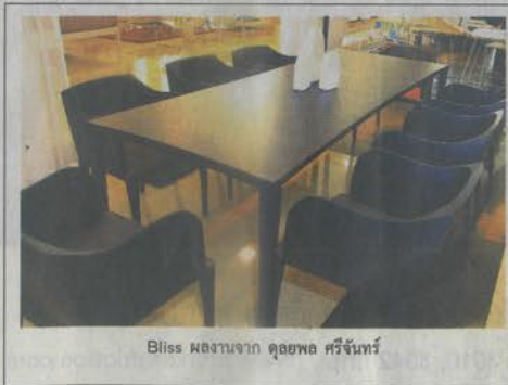
Bliss ผลงานจาก ดุลยพล ศรีจันทร์

“สำหรับแรงบันดาลใจในการทำงานชิ้นนี้นึกถึงลายกราฟฟิค ลายเรขาคณิต ที่เป็นศิลปะของพวกแชนมัวร์ ซึ่งเป็นคนผิวสี ที่อยู่ตอนใต้ของสเปน เลยนำมาออกแบบเป็นโต๊ะทำงานตัวนี้ มัวร์อสแปลว่าสีดำหรือเกือบดำ เลยอยากให้งานออกมาเป็นสีโทนมืด โดยสองพับกระดาษ