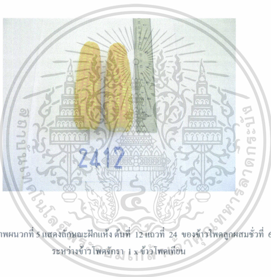
ภาพผนวกที่ 5 แสดงลักษณะฝักแห้ง ต้นที่ 12 แถวที่ 24 ของข้าวโพดลูกผสมชั่วที่ 6 ระหว่างข้าวโพดจักรา 1 x ข้าวโพดเทียน

เอกสารนี้เป็นเอกสารที่สงวนไว้สำหรับการใช้งานเพื่อการศึกษาเท่านั้น ไม่อนุญาตให้นำไปใช้ประโยชน์ด้านการค้า ไม่ว่ากรณีใดๆทั้งสิ้น อีกทั้งห้ามมิให้ดัดแปลงเนื้อหา และต้องอ้างอิงถึงเจ้าของเอกสารทุกครั้งที่มีการนำไปใช้