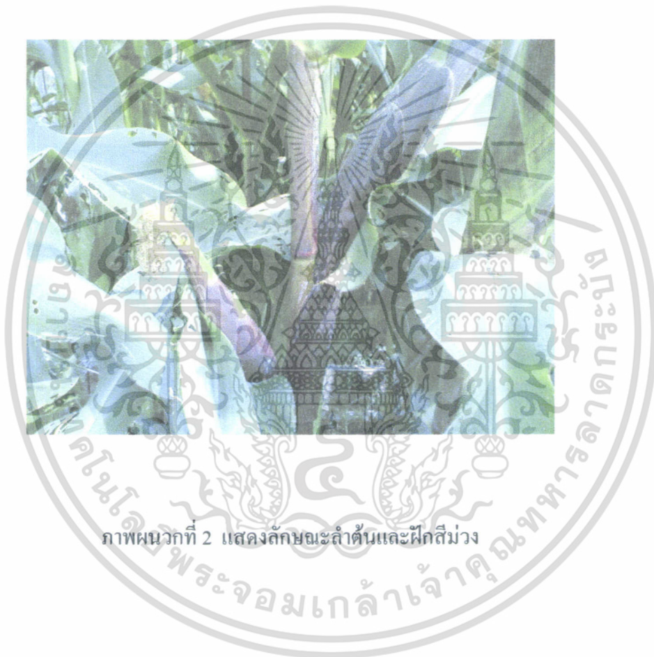
ภาพผนวกที่ 2 แสดงลักษณะลำต้นและปีกสีม่วง

เอกสารนี้เป็นเอกสารที่สงวนไว้สำหรับการใช้งานเพื่อการศึกษาเท่านั้น ไม่อนุญาตให้นำไปใช้ประโยชน์ด้านการค้า ไม่ว่ากรณีใดๆทั้งสิ้น อีกทั้งห้ามมิให้ดัดแปลงเนื้อหา และต้องอ้างอิงถึงเจ้าของเอกสารทุกครั้งที่มีการนำไปใช้