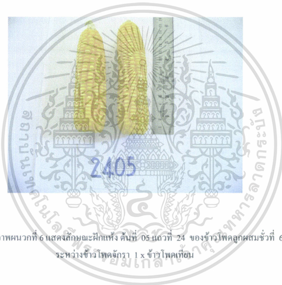
ภาพผนวกที่ 6 แสดงลักษณะฝักแห้ง ต้นที่ 05 แถวที่ 24 ของข้าวโพดลูกผสมชั่วที่ 6 ระหว่างข้าวโพดจักรา 1 x ข้าวโพดเทียน

เอกสารนี้เป็นเอกสารที่สงวนไว้สำหรับการใช้งานเพื่อการศึกษาเท่านั้น ไม่อนุญาตให้นำไปใช้ประโยชน์ด้านการค้า ไม่ว่ากรณีใดๆทั้งสิ้น อีกทั้งห้ามมิให้ตัดแปลงเนื้อหา และต้องอ้างอิงถึงเจ้าของเอกสารทุกครั้งที่มีการนำไปใช้