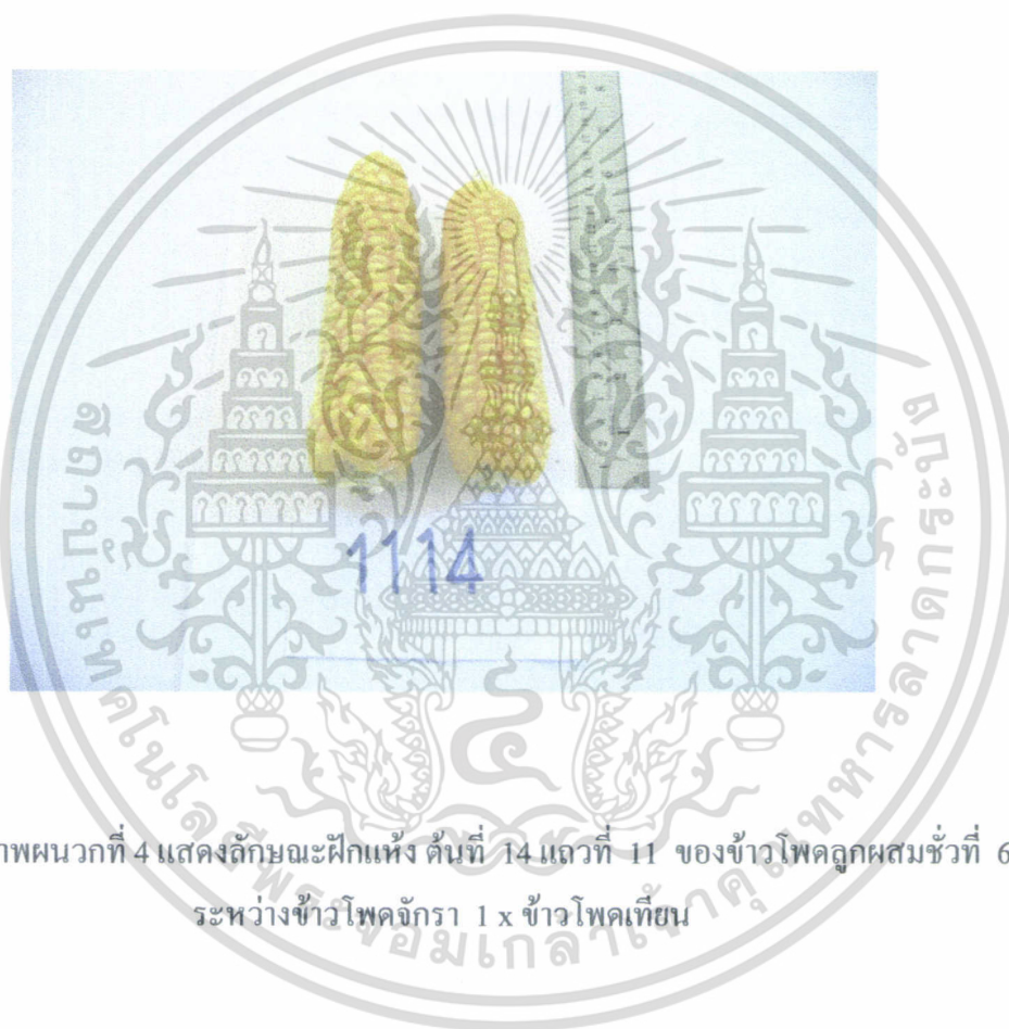
ภาพผนวกที่ 4 แสดงลักษณะฝักแห้ง ต้นที่ 14 แถวที่ 11 ของข้าวโพดลูกผสมชั่วที่ 6 ระหว่างข้าวโพดจักรา 1 x ข้าวโพดเทียน

เอกสารนี้เป็นเอกสารที่สงวนไว้สำหรับการใช้งานเพื่อการศึกษาเท่านั้น ไม่อนุญาตให้นำไปใช้ประโยชน์ด้านการค้า ไม่ว่ากรณีใดๆทั้งสิ้น อีกทั้งห้ามมิให้ดัดแปลงเนื้อหา และต้องอ้างอิงถึงเจ้าของเอกสารทุกครั้งที่มีการนำไปใช้