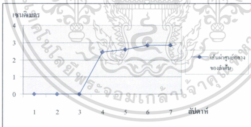
ภาพที่ 2 แสดงเส้นผ่าศูนย์กลางลำต้น (เซนติเมตร)

เอกสารนี้เป็นเอกสารที่สงวนไว้สำหรับการใช้งานเพื่อการศึกษาเท่านั้น ไม่อนุญาตให้นำไปใช้ประโยชน์ด้านการค้า ไม่ว่าจะกรณีใดๆทั้งสิ้น อีกทั้งห้ามมิให้ดัดแปลงเนื้อหา และต้องอ้างอิงถึงเจ้าของเอกสารทุกครั้งที่มีการนำไปใช้