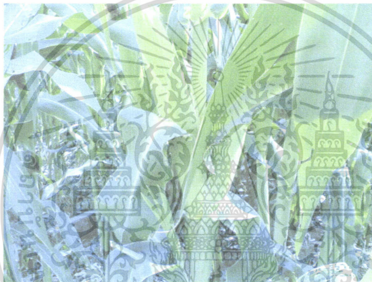
ภาพผนวกที่ 1 แสดงลักษณะลำต้นและฝักสีข้าว

เอกสารนี้เป็นเอกสารที่สงวนไว้สำหรับการใช้งานเพื่อการศึกษาเท่านั้น ไม่อนุญาตให้นำไปใช้ประโยชน์ด้านการค้า ไม่ว่าจะกรณีใดๆทั้งสิ้น อีกทั้งห้ามมิให้ดัดแปลงเนื้อหา และต้องอ้างอิงถึงเจ้าของเอกสารทุกครั้งที่มีการนำไปใช้