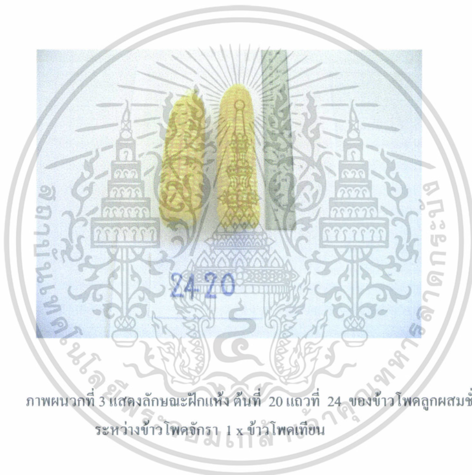
ภาพผนวกที่ 3 แสดงลักษณะฝักแห้ง คั้นที่ 20 แถวที่ 24 ของข้าวโพดลูกผสมชั่วที่ 6 ระหว่างข้าวโพดจักรา 1 x ข้าวโพดเทียน

เอกสารนี้เป็นเอกสารที่สงวนไว้สำหรับการใช้งานเพื่อการศึกษาเท่านั้น ไม่อนุญาตให้นำไปใช้ประโยชน์ด้านการค้า ไม่ว่ากรณีใดๆทั้งสิ้น อีกทั้งห้ามมิให้ดัดแปลงเนื้อหา และต้องอ้างอิงถึงเจ้าของเอกสารทุกครั้งที่มีการนำไปใช้