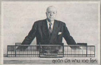
ลูดวิก ฟัน เดอร์ โรห์

หลังจาก ลุดวิก มีส ฟาน เดอ โรห์ (Ludwig Mies van der Rohe) ปรมาจารย์แห่งโมเดิร์น กล่าวคำว่า "Less is More" หรือน้อยคือมากกว่า ก็ได้กลายมาเป็นคีย์เวิร์ดหรือปรัชญาสำคัญแห่งการเริ่มต้นยุคสถาปัตยกรรมโมเดิร์นที่ล้ม