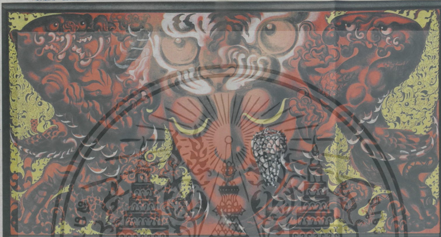
ภาพ : กฤษณ์ ปรินพาวณ