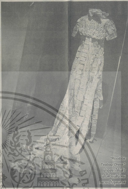
“Roobos Teabag Dress” นำถุงชาใช้แล้วเย็บด้วยเส้นไหมกลายเป็นชุดเดรส