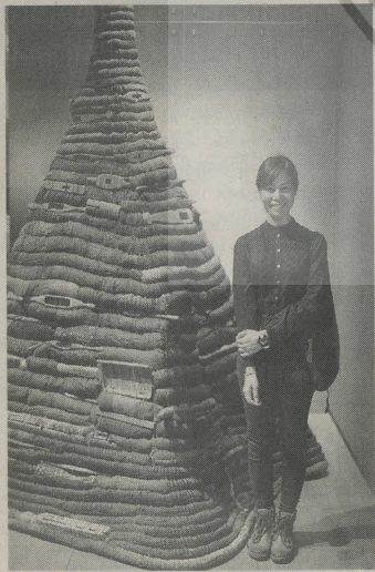
ททียรัตน์เจ้าของงาน “บันทึกจากวิถีชนบท 2” จากฝ้ายไหมเป็นรูปพรตเจดีย์

บ้านเมืองอยู่ในภาวะสงคราม ผ่านงาน เพื่อสื่อถึงความผูกพัน เครื่องแบบทหารที่เจ้าตัวและพี่ชายเคยสวมใส่ โดยใช้วิธีการ