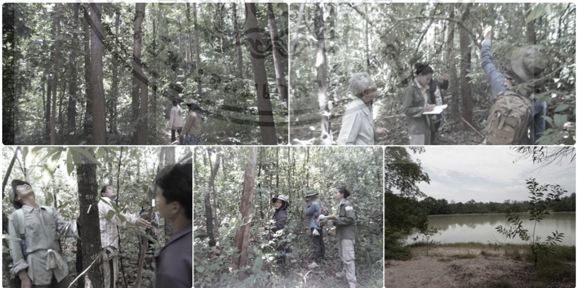
Figure 1 Forest surveys by community participation.

เอกสารนี้เป็นเอกสารที่สงวนไว้สำหรับการใช้งานเพื่อการศึกษาเท่านั้น ไม่อนุญาตให้นำไปใช้ประโยชน์ด้านการค้า ไม่ว่ากรณีใดๆทั้งสิ้น อีกทั้งห้ามมิให้ตัดแปลงเนื้อหา และต้องอ้างอิงถึงเจ้าของเอกสารทุกครั้งที่มีการนำไปใช้