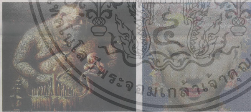
ผลงานของ วิรัตน์ รุ่งพยัคฆ์