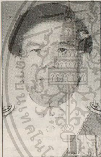
เดชา วราขุน

คุณหญิงไขศรี ศรีอรุณ รัฐมนตรีว่าการกระทรวงวัฒนธรรม เปิดเผยเมื่อวันที่ 17 ม.ค. ภายหลังการประชุมคณะกรรมการวัฒนธรรมแห่งชาติ (กวช.) ว่า คณะกรรมการผู้ทรงคุณวุฒิได้ทำการคัดเลือกศิลปินที่ได้รับการยกย่องให้เป็นศิลปินแห่งชาติประจำปี 2550 จำนวน 6 ท่านดังนี้ สาขาทัศนศิลป์ ได้แก่ ศ.เดชา วราขุน (ภาพพิมพ์และสื่อผสม), นายยรรยง โอฟาระชิน (ภาพ