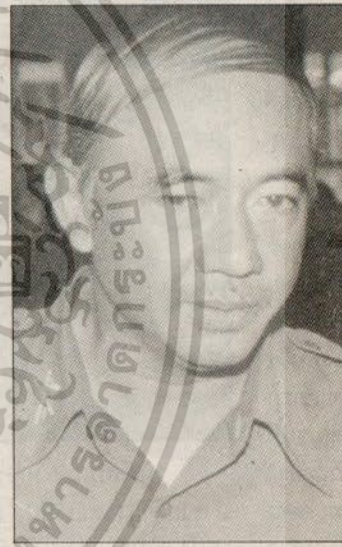
ชาญ บั้วบั้งคร