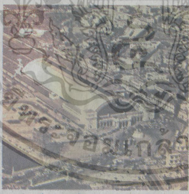
ภาพพระบรมมหาราชวัง 2507 : กองคณบดีแห่งถัด

เมื่อถึงเวลานั้นสถานีรถไฟหัวลำโพงกลายเป็นสถานีทรงจำ