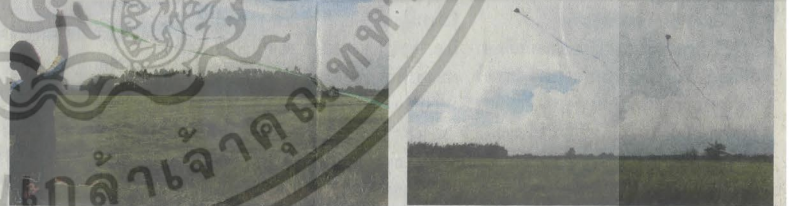
ว้าวใบไม้ ทำง่าย เล่นเพลิน