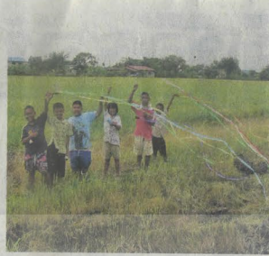
ว้าวใบไม้หลากสี