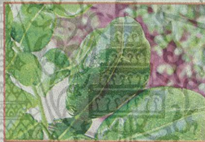
ใบมะกรูด