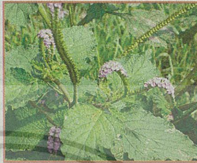
หญ้าวงช้าง