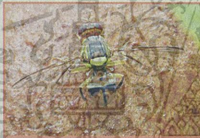
แมลงวันทอง