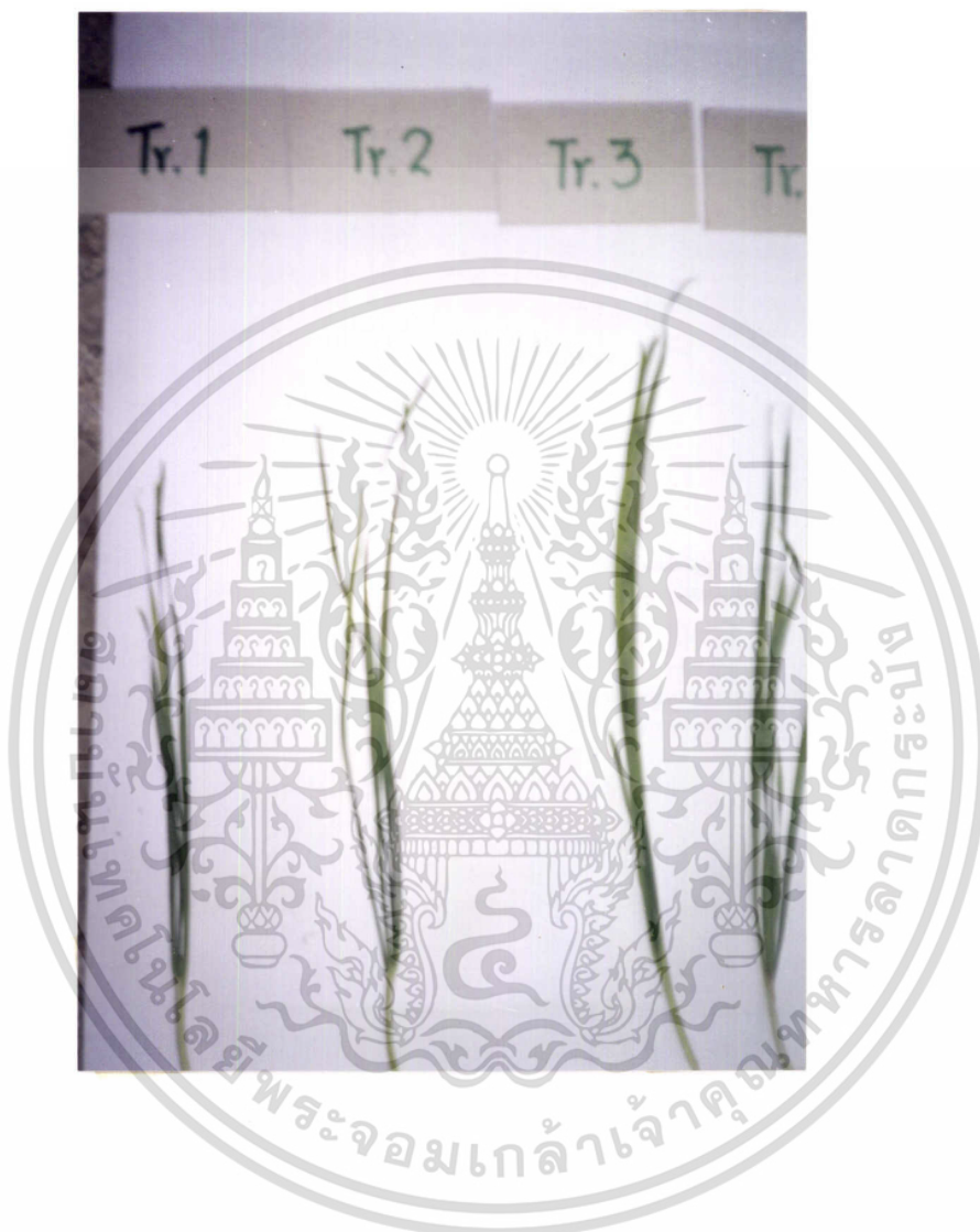
ภาพที่ 2 แสดงการเปรียบเทียบผลผลิตของฝักกุยช่ายในแต่ละการทดลอง

เอกสารนี้เป็นเอกสารที่สงวนไว้สำหรับการใช้งานเพื่อการศึกษาเท่านั้น ไม่อนุญาตให้นำไปใช้ประโยชน์ด้านการค้า ไม่ว่าจะกรณีใดๆทั้งสิ้น อีกทั้งห้ามมิให้ดัดแปลงเนื้อหา และต้องอ้างอิงถึงเจ้าของเอกสารทุกครั้งที่มีการนำไปใช้