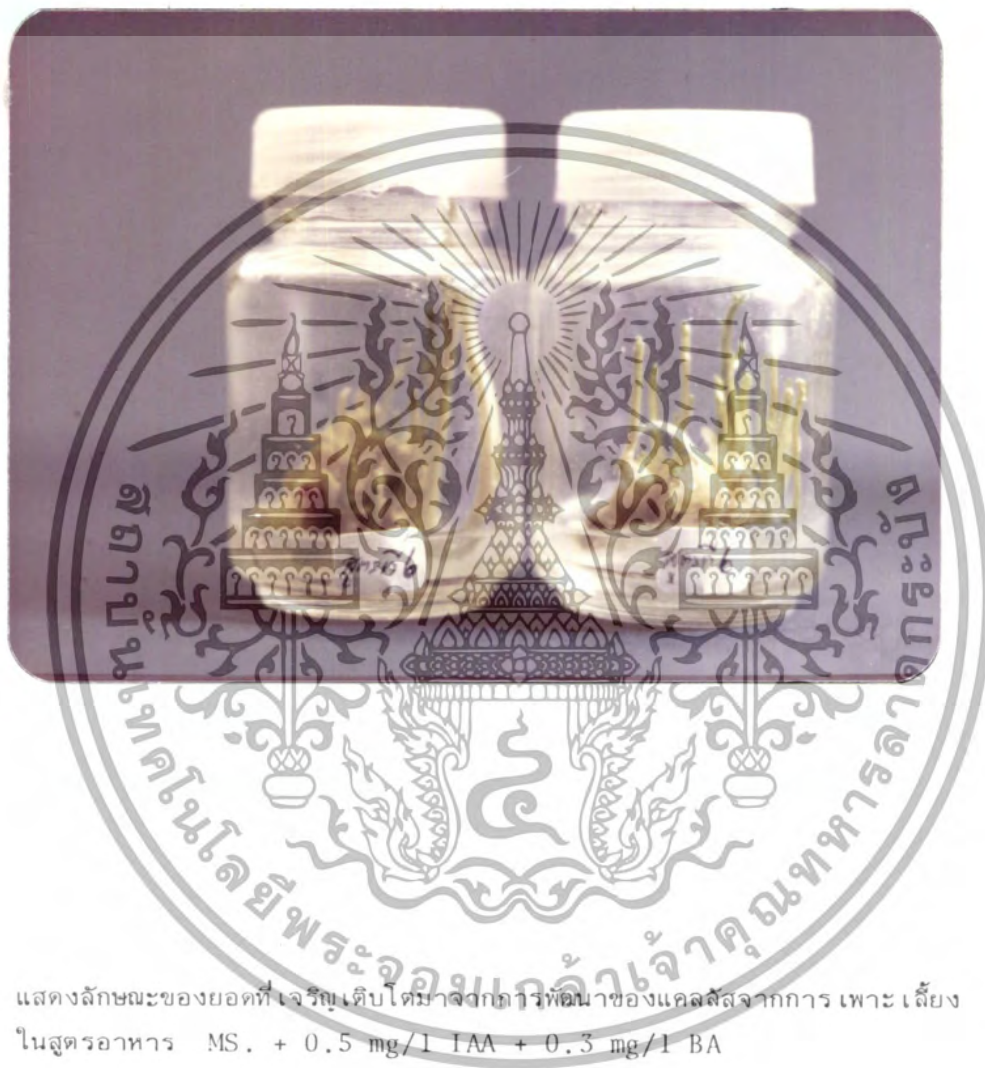
ภาพที่ 7 แสดงลักษณะของยอดที่เจริญเติบโตมาจากการพัฒนาของแคลลัสจากการเพาะเลี้ยง ในสูตรอาหาร MS. + 0.5 mg/l IAA + 0.3 mg/l BA

เอกสารนี้เป็นเอกสารที่สงวนไว้สำหรับการใช้งานเพื่อการศึกษาเท่านั้น ไม่อนุญาตให้นำไปใช้ประโยชน์ด้านการค้า ไม่ว่ากรณีใดๆ ทั้งสิ้น อีกทั้งห้ามมิให้ดัดแปลงเนื้อหา และต้องอ้างอิงถึงเจ้าของเอกสารทุกครั้งที่มีการนำไปใช้