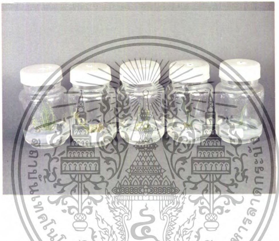
ภาพที่ 3 แสดงผลการเจริญและการพัฒนาของปลายยอดอ่อน (shoot apex) หลังจากเพาะเลี้ยงได้นาน 6 สัปดาห์ในอาหารสูตรต่าง ๆ สูตรที่ 1 คือ สูตรอาหาร MS. สูตรที่ 2 คือ สูตรอาหาร MS. + 0.1 mg/l NAA + 0.1 mg/l kinetin สูตรที่ 3 คือ สูตรอาหาร MS. + 0.1 mg/l NAA + 0.3 mg/l kinetin สูตรที่ 4 คือ สูตรอาหาร MS. + 0.3 mg/l NAA + 0.1 mg/l kinetin สูตรที่ 5 คือ สูตรอาหาร MS. + 0.01 mg/l NAA + 0.1 mg/l kinetin

เอกสารนี้เป็นเอกสารที่สงวนไว้สำหรับการใช้งานเพื่อการศึกษาเท่านั้น ไม่อนุญาตให้นำไปใช้ประโยชน์ด้านการค้าไม่ว่ากรณีใดๆ ทั้งสิ้น อีกทั้งห้ามมิให้ดัดแปลงเนื้อหา และต้องอ้างอิงถึงเจ้าของเอกสารทุกครั้งที่มีการนำไปใช้