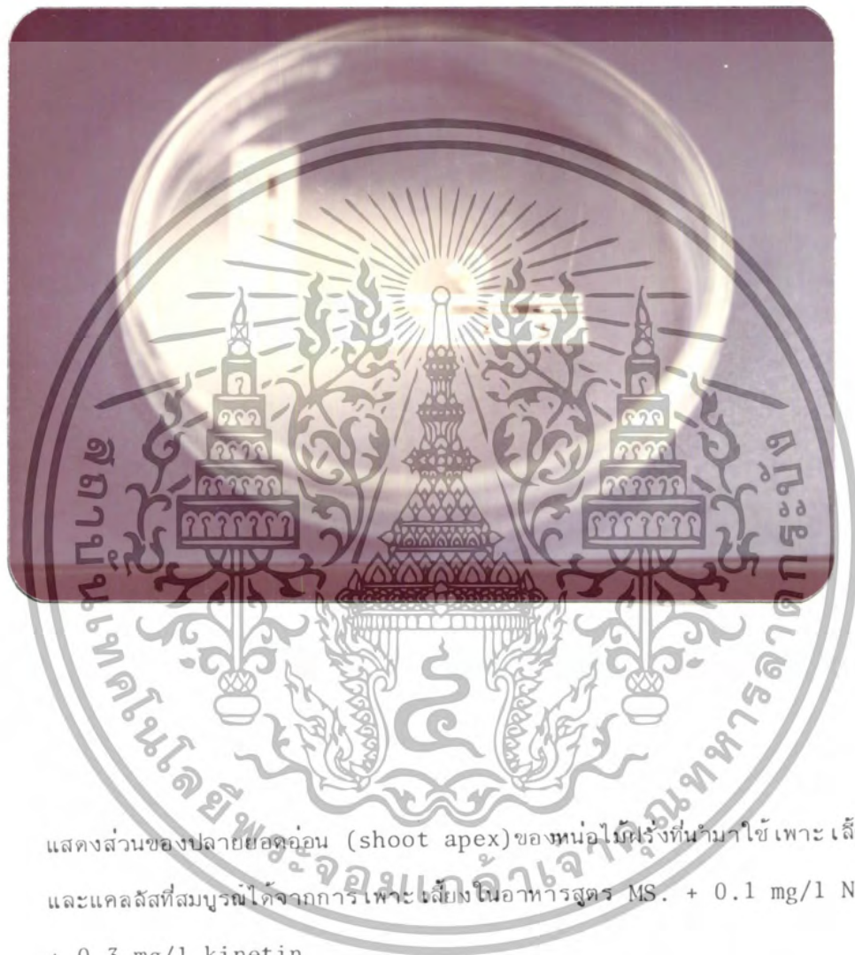
ภาพที่ 2 แสดงส่วนของปลายยอดอ่อน (shoot apex) ของหน่อไม้ฝรั่งที่นำมาใช้เพาะเลี้ยง และแคลลัสที่สมบูรณ์ได้จากการเพาะเลี้ยงในอาหารสูตร MS. + 0.1 mg/l NAA + 0.3 mg/l kinetin

เอกสารนี้เป็นเอกสารที่สงวนไว้สำหรับการใช้งานเพื่อการศึกษาเท่านั้น ไม่อนุญาตให้นำไปใช้ประโยชน์ด้านการค้าไม่ว่ากรณีใดๆ ทั้งสิ้น อีกทั้งห้ามมิให้ดัดแปลงเนื้อหา และต้องอ้างอิงถึงเจ้าของเอกสารทุกครั้งที่มีการนำไปใช้