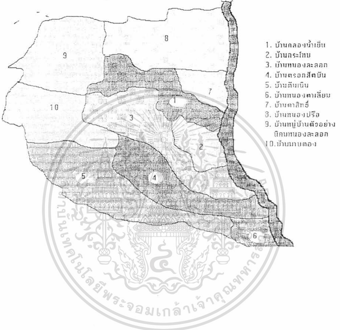
ภาพที่ 1 แผนที่แสดงอาณาเขตของหมู่บ้านในต.หนองละลอก อ.บ้านค่าย จ.ระยอง

เอกสารนี้เป็นเอกสารที่สงวนไว้สำหรับการใช้งานเพื่อการศึกษาเท่านั้น ไม่อนุญาตให้นำไปใช้ประโยชน์ด้านการค้า ไม่ว่ากรณีใดๆ ทั้งสิ้น อีกทั้งห้ามมิให้ตัดแปลงเนื้อหา และต้องอ้างอิงถึงเจ้าของเอกสารทุกครั้งที่มีการนำไปใช้