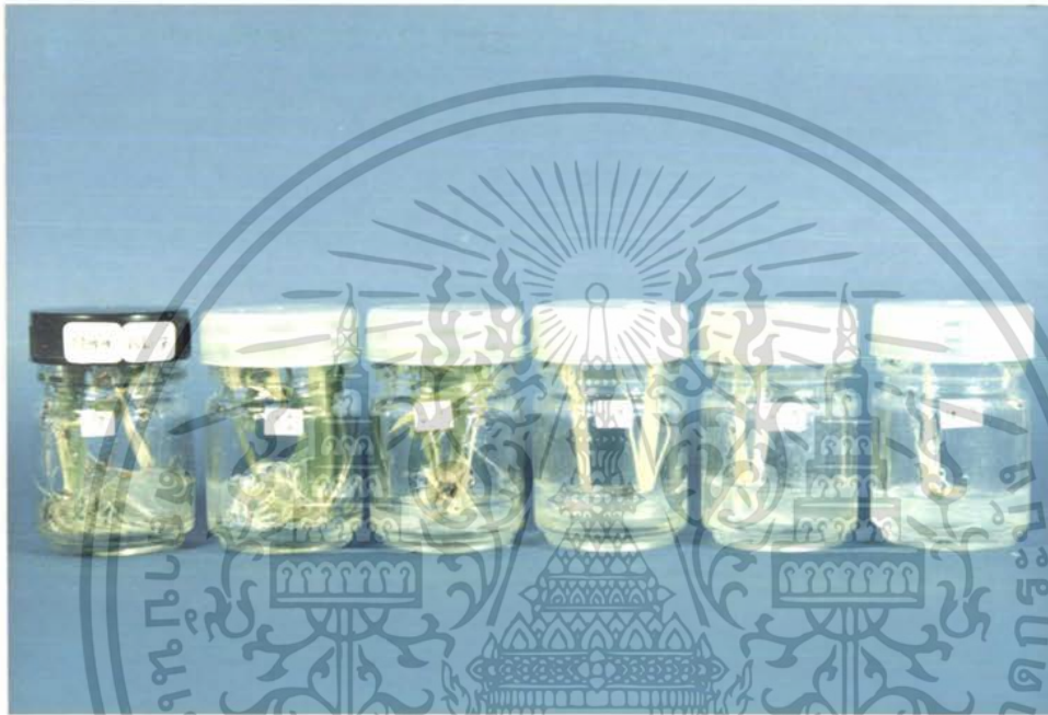
ภาพที่ 4 การเจริญเติบโตของแคลลัสข้าวพันธุ์ กข.7 ในอาหารสูตร MS ที่มีสารเร่งการเจริญเติบโต NAA ในความเข้มข้นต่าง ๆ ( มิลลิกรัมต่อลิตร ) จากการทดลองครั้งที่ 1

เอกสารนี้เป็นเอกสารที่สงวนไว้สำหรับการใช้งานเพื่อการศึกษาเท่านั้น ไม่อนุญาตให้นำไปใช้ประโยชน์ด้านการค้า ไม่ว่าจะกรณีใดๆ ทั้งสิ้น อีกทั้งห้ามมิให้ตัดแปลงเนื้อหา และต้องอ้างอิงถึงเจ้าของเอกสารทุกครั้งที่มีการนำไปใช้