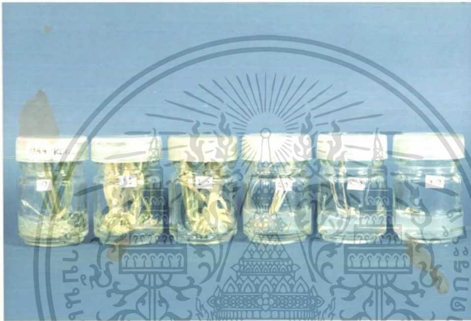
ภาพที่ 3 การเจริญเติบโตของแคลลัสข้าวพันธุ์ขาวดอกมะลิ 105 ในอาหาร สูตร MS ที่มีสารเร่งการเจริญเติบโต NAA ในความเข้มข้นต่าง ๆ ( มีลลิกกรัมต่อลิตร -) จากการทดลองครั้งที่ 1

เอกสารนี้เป็นเอกสารที่สงวนไว้สำหรับการใช้งานเพื่อการศึกษาเท่านั้น ไม่อนุญาตให้นำไปใช้ประโยชน์ด้านการค้า ไม่ว่ากรณีใดๆ ทั้งสิ้น อีกทั้งห้ามมิให้ตัดแปลงเนื้อหา และต้องอ้างอิงถึงเจ้าของเอกสารทุกครั้งที่มีการนำไปใช้