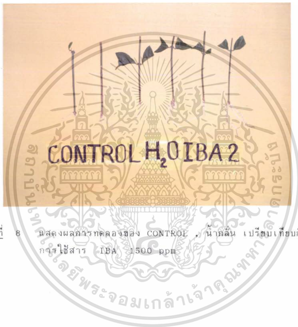
ภาพที่ 8 แสดงผลการทดลองของ CONTROL น้ำกลั่น เปรียบเทียบกับ การใช้สาร IBA 1500 ppm

เอกสารนี้เป็นเอกสารที่สงวนไว้สำหรับการใช้งานเพื่อการศึกษาเท่านั้น ไม่อนุญาตให้นำไปใช้ประโยชน์ด้านการค้า ไม่ว่ากรณีใดๆ ทั้งสิ้น อีกทั้งห้ามมิให้ดัดแปลงเนื้อหา และต้องอ้างอิงถึงเจ้าของเอกสารทุกครั้งที่มีการนำไปใช้