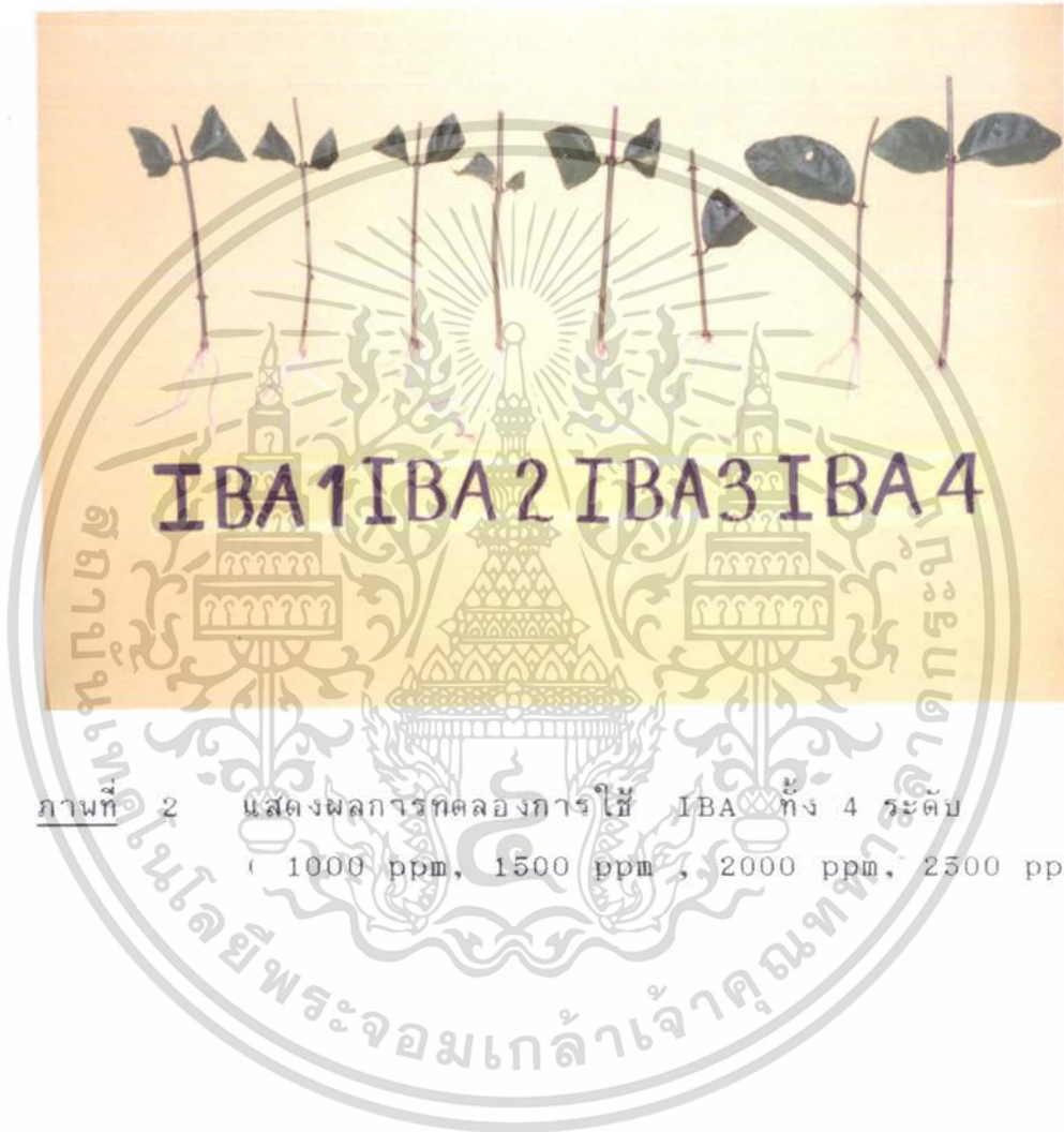
ภาพที่ 2 แสดงผลการทดลองการใช้ IBA ทั้ง 4 ระดับ ( 1000 ppm, 1500 ppm , 2000 ppm, 2500 ppm )

เอกสารนี้เป็นเอกสารที่สงวนไว้สำหรับการใช้งานเพื่อการศึกษาเท่านั้น ไม่อนุญาตให้นำไปใช้ประโยชน์ด้านการค้า ไม่ว่ากรณีใดๆ ทั้งสิ้น อีกทั้งห้ามมิให้ดัดแปลงเนื้อหา และต้องอ้างอิงถึงเจ้าของเอกสารทุกครั้งที่มีการนำไปใช้