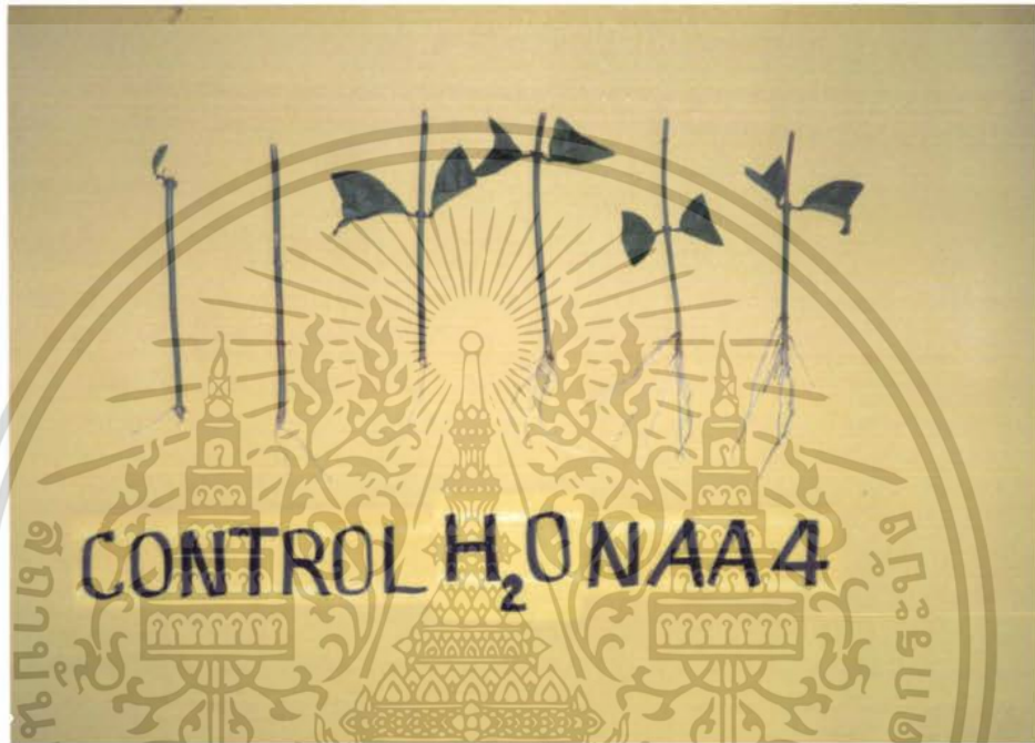
ภาพที่ 6 แสดงผลการทดลองของ CONTROL , น้ำกลั่น เปรียบเทียบกับ การใช้สาร NAA 2500 ppm

เอกสารนี้เป็นเอกสารที่สงวนไว้สำหรับการใช้งานเพื่อการศึกษาเท่านั้น ไม่อนุญาตให้นำไปใช้ประโยชน์ด้านการค้า ไม่ว่ากรณีใดๆ ทั้งสิ้น อีกทั้งห้ามมิให้ตัดแปลงเนื้อหา และต้องอ้างอิงถึงเจ้าของเอกสารทุกครั้งที่มีการนำไปใช้