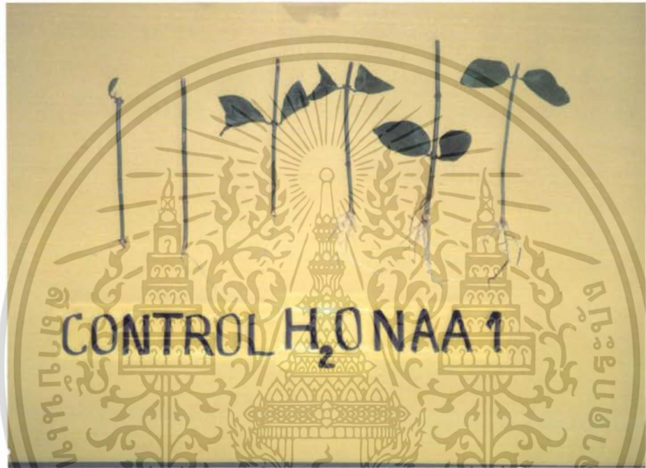
ภาพที่ 3 แสดงผลการทดลองของ CONTROL , นักเล่น เปรียบเทียบกับ การใช้สาร NAA 1000 ppm

เอกสารนี้เป็นเอกสารที่สงวนไว้สำหรับการใช้งานเพื่อการศึกษาเท่านั้น ไม่อนุญาตให้นำไปใช้ประโยชน์ด้านการค้า ไม่ว่ากรณีใดๆ ทั้งสิ้น อีกทั้งห้ามมิให้ดัดแปลงเนื้อหา และต้องอ้างอิงถึงเจ้าของเอกสารทุกครั้งที่มีการนำไปใช้