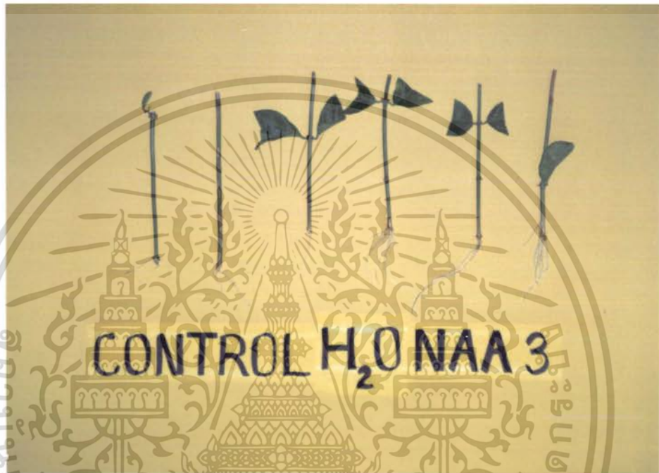
ภาพที่ 5 แสดงผลการทดลองของ CONTROL , น้ำกลั่น เปรียบเทียบกับ การใช้สาร NAA 2000 ppm

เอกสารนี้เป็นเอกสารที่สงวนไว้สำหรับการใช้งานเพื่อการศึกษาเท่านั้น ไม่อนุญาตให้นำไปใช้ประโยชน์ด้านการค้า ไม่ว่ากรณีใดๆ ทั้งสิ้น อีกทั้งห้ามมิให้ดัดแปลงเนื้อหา และต้องอ้างอิงถึงเจ้าของเอกสารทุกครั้งที่มีการนำไปใช้