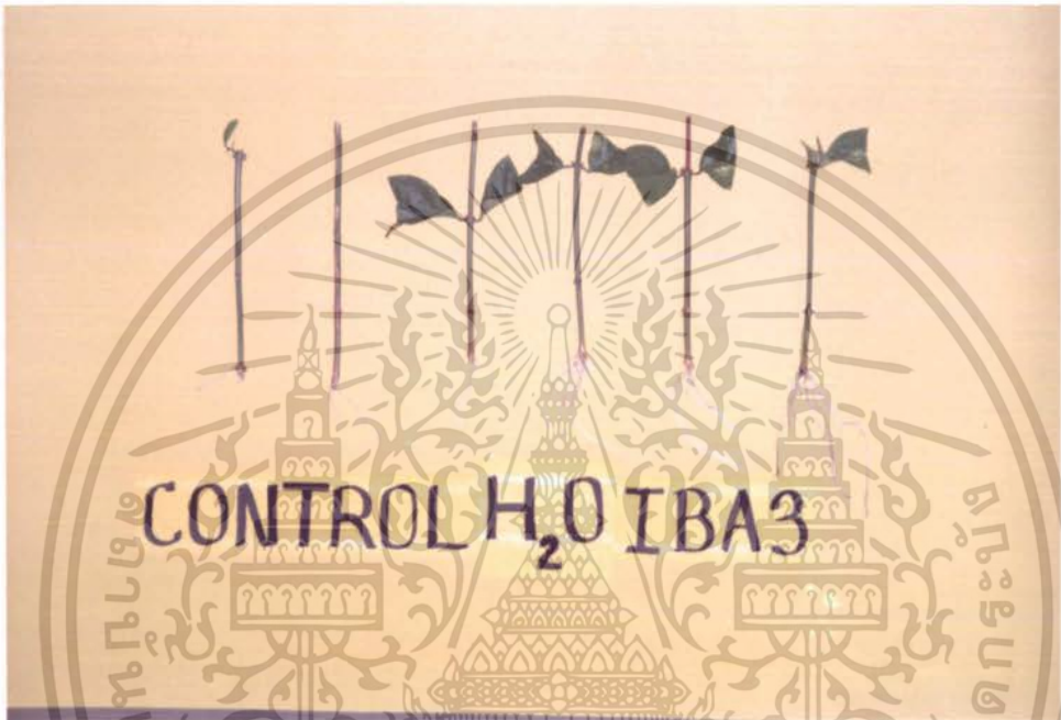
ภาพที่ 9 แสดงผลการทดลองของ CONTROL , น้ำกลั่น เปรียบเทียบกับ การใช้สาร IBA 2000 ppm

เอกสารนี้เป็นเอกสารที่สงวนไว้สำหรับการใช้งานเพื่อการศึกษาเท่านั้น ไม่อนุญาตให้นำไปใช้ประโยชน์ด้านการค้า ไม่ว่ากรณีใดๆ ทั้งสิ้น อีกทั้งห้ามมิให้ดัดแปลงเนื้อหา และต้องอ้างอิงถึงเจ้าของเอกสารทุกครั้งที่มีการนำไปใช้