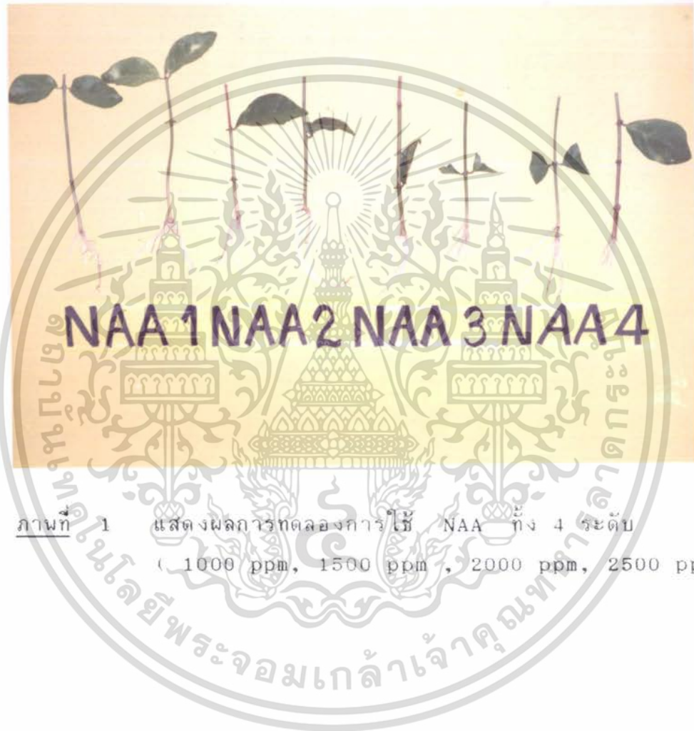
ภาพที่ 1 แสดงผลการทดลองการใช้ NAA ทั้ง 4 ระดับ ( 1000 ppm, 1500 ppm, 2000 ppm, 2500 ppm )

เอกสารนี้เป็นเอกสารที่สงวนไว้สำหรับการใช้งานเพื่อการศึกษาเท่านั้น ไม่อนุญาตให้นำไปใช้ประโยชน์ด้านการค้า ไม่ว่ากรณีใดๆ ทั้งสิ้น อีกทั้งห้ามมิให้ดัดแปลงเนื้อหา และต้องอ้างอิงถึงเจ้าของเอกสารทุกครั้งที่มีการนำไปใช้