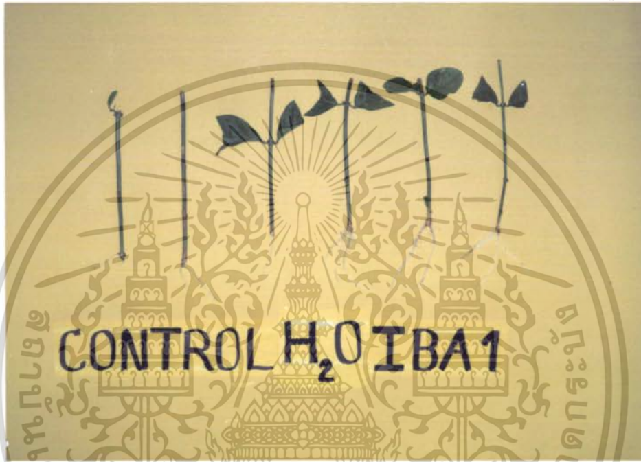
ภาพที่ 7 แสดงผลการทดลองของ CONTROL , น้ำกลั่น เปรียบเทียบกับ การใช้สาร IBA 1000 ppm

เอกสารนี้เป็นเอกสารที่สงวนไว้สำหรับการใช้งานเพื่อการศึกษาเท่านั้น ไม่อนุญาตให้นำไปใช้ประโยชน์ด้านการค้า ไม่ว่ากรณีใดๆ ทั้งสิ้น อีกทั้งห้ามมิให้ตัดแปลงเนื้อหา และต้องอ้างอิงถึงเจ้าของเอกสารทุกครั้งที่มีการนำไปใช้