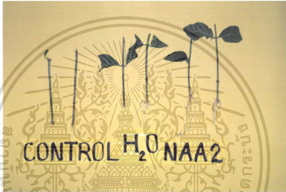
ภาพที่ 4 แสดงผลการทดลองของ CONTROL , น้ำกลั่น เปรียบเทียบกับ การใช้สาร NAA 1500 ppm

เอกสารนี้เป็นเอกสารที่สงวนไว้สำหรับการใช้งานเพื่อการศึกษาเท่านั้น ไม่อนุญาตให้นำไปใช้ประโยชน์ด้านการค้า ไม่ว่ากรณีใดๆ ทั้งสิ้น อีกทั้งห้ามมิให้ตัดแปลงเนื้อหา และต้องอ้างอิงถึงเจ้าของเอกสารทุกครั้งที่มีการนำไปใช้