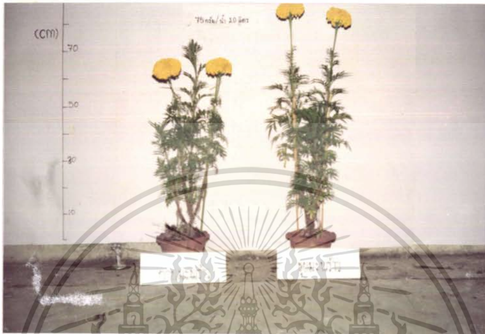
รูปภาพที่ 9 แสดงการเปรียบเทียบการเจริญเติบโตของดาวเรืองในอัตรา ความเข้มข้นของปุ๋ยเกล็ด 75 กรัมต่อน้ำ 20 ลิตร