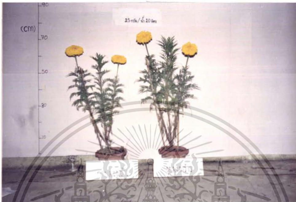
รูปภาพที่ 7 แสดงการเปรียบเทียบการเจริญเติบโตของดาวเรืองในอัครา ความเข้มข้นของปุ๋ยเกล็ด 25 กรัมต่อน้ำ 20 ลิตร