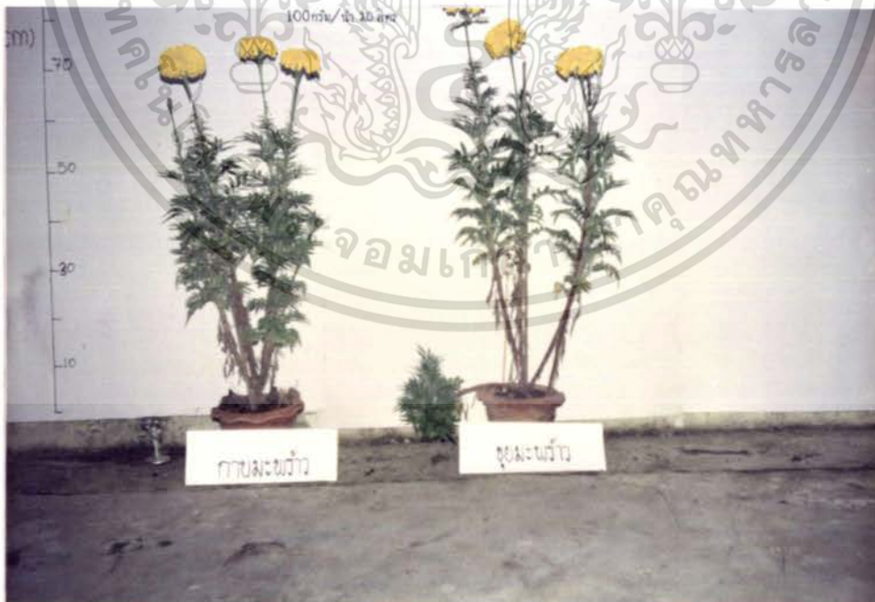
รูปภาพที่ 10 แสดงการเปรียบเทียบการเจริญเติบโตของดาวเรืองในอัตรา

ความเข้มข้นของปุ๋ยเกล็ด 100 กรัมต่อน้ำ 20 ลิตร