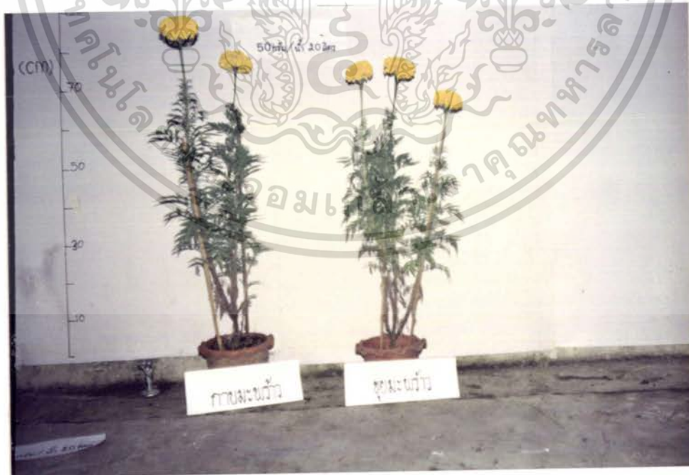
รูปภาพที่ 8 แสดงการเปรียบเทียบการเจริญเติบโตของดาวเรืองในอัครา

ความเข้มข้นของปุ๋ยเกล็ด 50 กรัมต่อน้ำ 20 ลิตร เอกสารนี้เป็นเอกสารที่สงวนไว้สำหรับการใช้งานเพื่อการศึกษาเท่านั้น ไม่อนุญาตให้นำไปใช้ประโยชน์ด้านการค้า ไม่ว่ากรณีใดๆ ทั้งสิ้น อีกทั้งห้ามมิให้ตัดแปลงเนื้อหา และต้องอ้างอิงถึงเจ้าของเอกสารทุกครั้งที่มีการนำไปใช้