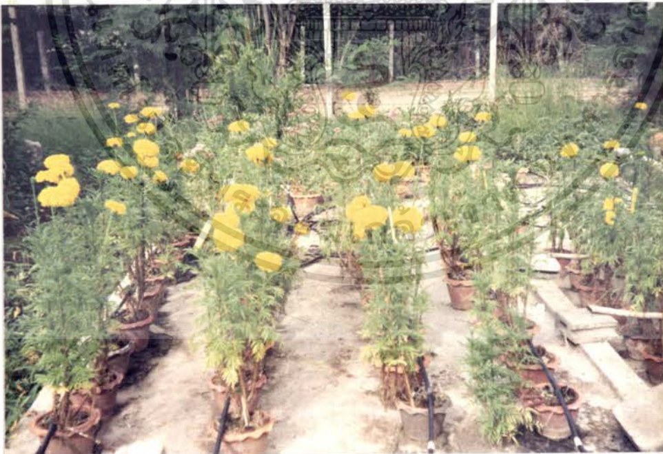
รูปภาพที่ 6 แสดงการบานของดอกดาวเรืองในวัสดุปลูกกาบมะพร้าว

เอกสารนี้เป็นเอกสารที่สงวนไว้สำหรับการใช้งานเพื่อการศึกษาเท่านั้น ไม่อนุญาตให้นำไปใช้ประโยชน์ด้านการค้า ไม่ว่าจะกรณีใดๆ ทั้งสิ้น อีกทั้งห้ามมิให้ตัดแปลงเนื้อหา และต้องอ้างอิงถึงเจ้าของเอกสารทุกครั้งที่มีการนำไปใช้