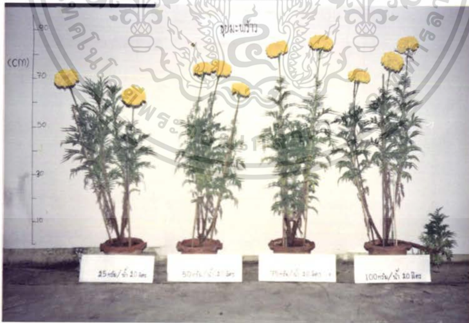
รูปภาพที่ 12 แสดงการเปรียบเทียบการเจริญเติบโตของดาวเรือง

วัสดุปลูกขุยมะพร้าว ในอัตราความเข้มข้นต่างๆ กัน