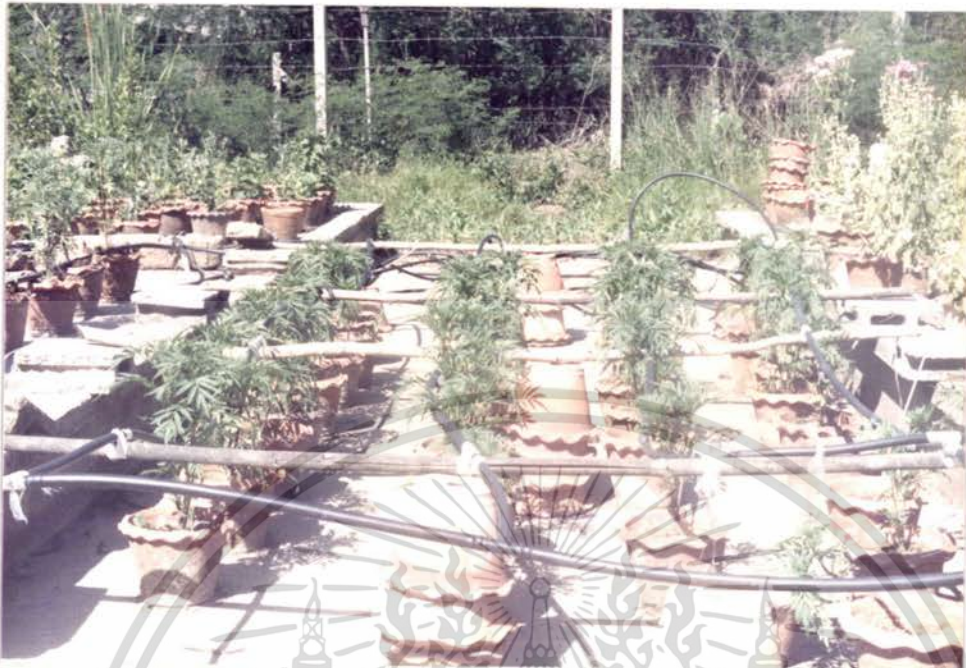
รูปภาพที่ 3 แสดงการเจริญเติบโตของดาวเรือง ซึ่งปลูกลงในขุยมะพร้าว