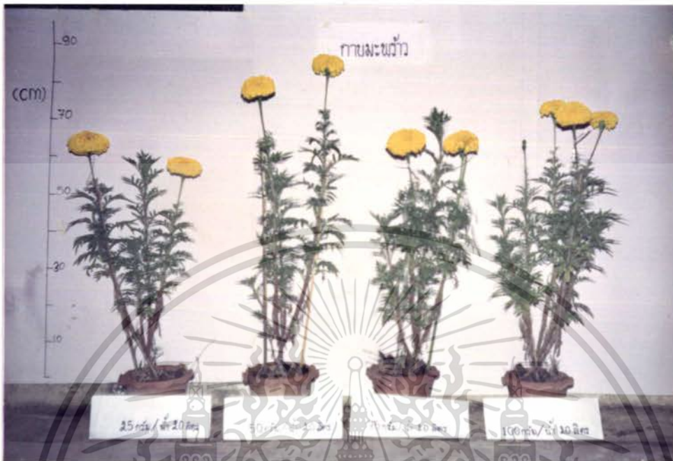
รูปภาพที่ 11 แสดงการเปรียบเทียบการเจริญเติบโตของดาวเรือง วัสดุปลูกกาบมะพร้าว ในอัตราความเข้มข้นต่างๆ กัน