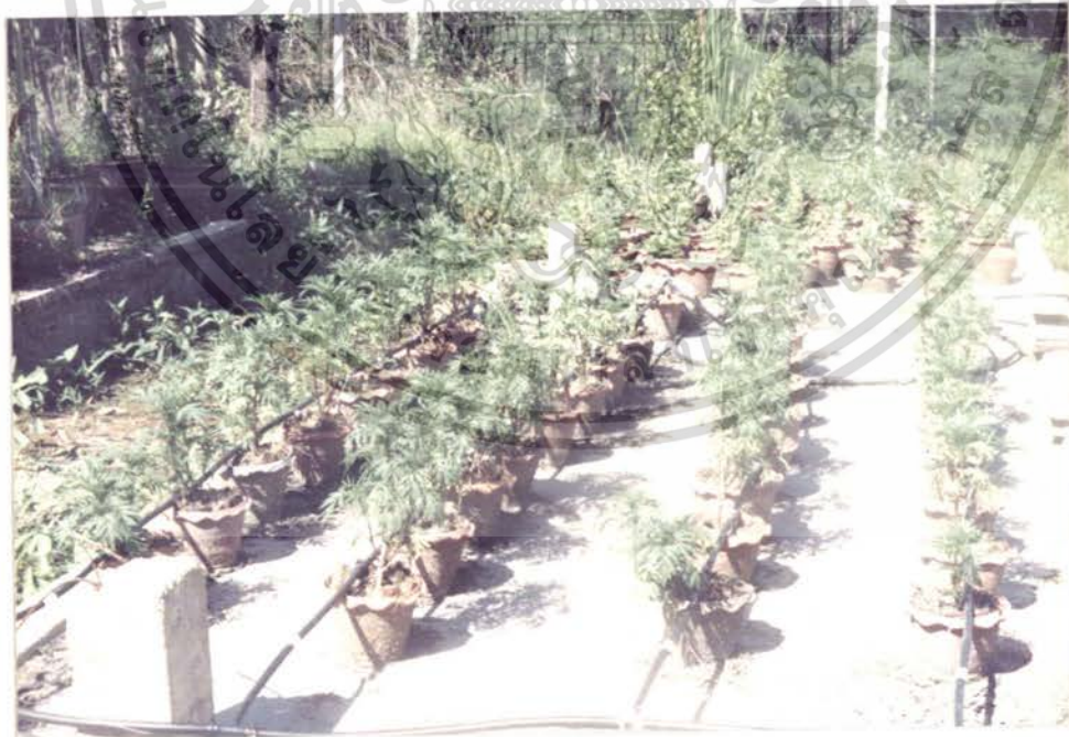
รูปภาพที่ 2 แสดงการเจริญเติบโตของดาวเรืองซึ่งปลูกลงในกาบมะพร้าว

เอกสารนี้เป็นเอกสารที่สงวนไว้สำหรับการใช้งานเพื่อการศึกษาเท่านั้น ไม่อนุญาตให้นำไปใช้ประโยชน์ด้านการค้า ไม่ว่าจะกรณีใดๆ ทั้งสิ้น อีกทั้งห้ามมิให้ตัดแปลงเนื้อหา และต้องอ้างอิงถึงเจ้าของเอกสารทุกครั้งที่มีการนำไปใช้