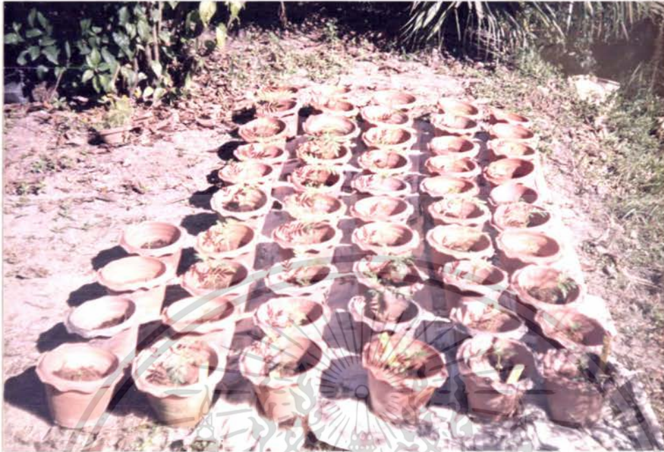
รูปภาพที่ 1 แสดงการปลูกลำดาวเรียงลงในกระถางซึ่งบรรจุวัสดุปลูกไม่ใช้ดิน