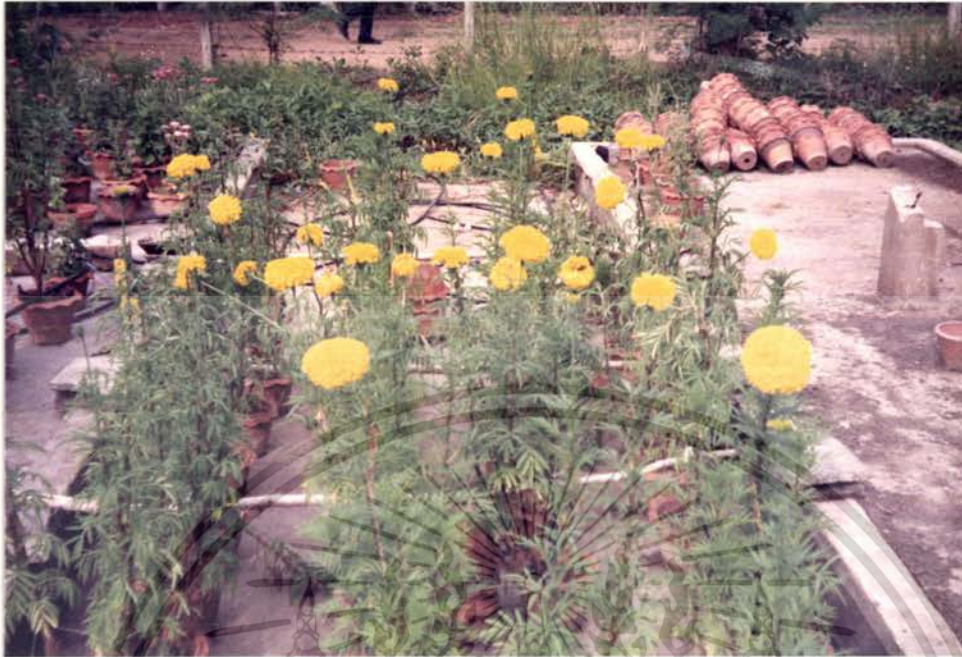
รูปภาพที่ 5 แสดงการบานของดอกดาวเรืองในวัสดุปลูกขุยมะพร้าว