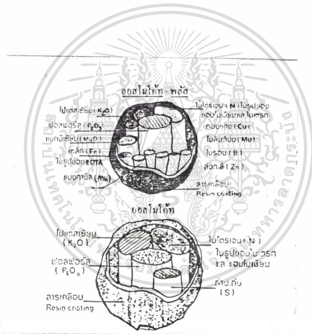
รูปภาพที่ 13 แสดงองค์ประกอบธาตุอาหารต่างๆ ภายในปุ๋ยละลายช้า (ออสโมโค้ท, ออสโมโค้ท-พลัส)

เอกสารนี้เป็นเอกสารที่สงวนไว้สำหรับ... ไม่อนุญาตให้นำไปใช้ประโยชน์ด้านการค้า ไม่ว่าจะกรณีใดๆ ทั้งสิ้น อีกทั้งห้ามมิให้คัดลอก... อย่างอ้อมถึงเจ้าของเอกสารทุกครั้งที่มีการนำไปใช้