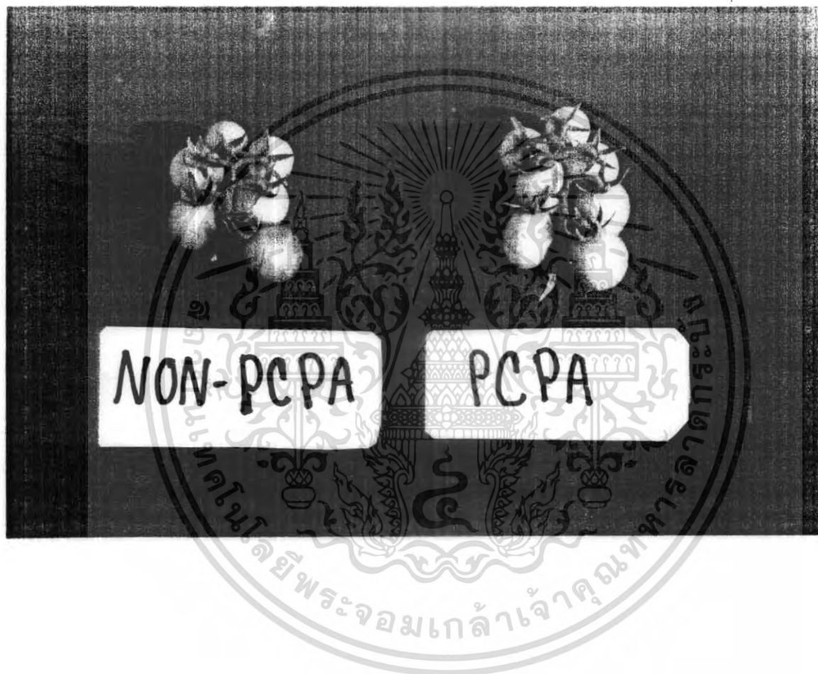
ภาพ 2 แสดงจำนวนผลของมะเขือเทศที่ได้รับสาร PCPA และไม่ได้รับสาร PCPA

เอกสารนี้เป็นเอกสารที่สงวนไว้สำหรับการใช้งานเพื่อการศึกษาเท่านั้น ไม่อนุญาตให้นำไปใช้ประโยชน์ด้านการค้าไม่ว่ากรณีใดๆ ทั้งสิ้น อีกทั้งห้ามมิให้ดัดแปลงเนื้อหา และต้องอ้างอิงถึงเจ้าของเอกสารทุกครั้งที่มีการนำไปใช้