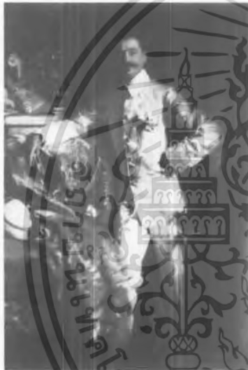
John Singer Sargent

แม้ศิลปินดังอย่างออกุสต์โรแดง ยังเคยยกย่องและเปรียบเปรย จอห์น ซิงเกอร์ ซาเจนต์ ว่าเป็น แวนไคค์ แห่งยุคสมัย แอนโทนีแวนโคค์ จิตรกรประจำราชสำนักและศิลปินภาพเหมือนผู้ยิ่งใหญ่แห่งศตวรรษที่ 17 ที่สามารถเขียนภาพบุคคลได้อย่างสง่างามและทรงอำนาจเอกลักษณ์ในภาพเขียนของแวนไคค์ ได้กลายเป็นแบบฉบับในการเขียนภาพเหมือนของอังกฤษในเวลาต่อมาและจอห์นซิงเกอร์ ซาเจนต์ได้รับการเปรียบเปรยให้มีมือเทียบชั้นศิลปินคนนี้ และจอห์น ซิงเกอร์ ซาเจนต์ ก็จากโลกนี้ไปด้วยวัย 69 ปี ที่กรุงลอนดอนประเทศอังกฤษ