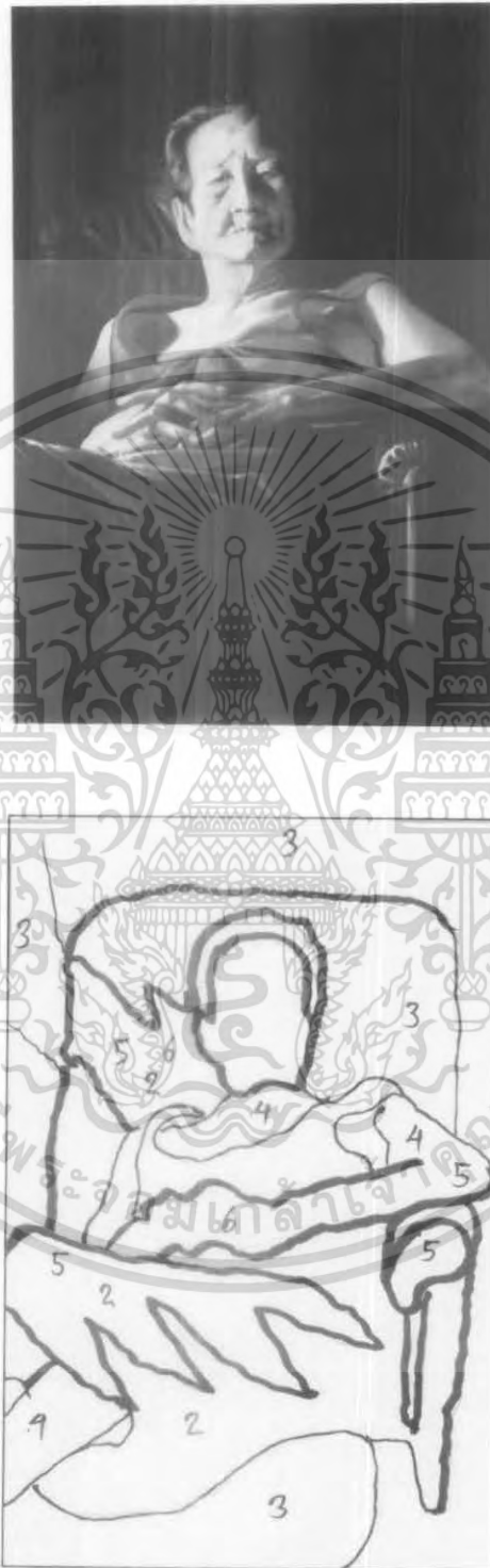
ภาพผลงานชั้นที่ 3

เอกสารนี้เป็นเอกสารที่สงวนไว้สำหรับการใช้งานเพื่อการศึกษาเท่านั้น ไม่อนุญาตให้นำไปใช้ประโยชน์ด้านการค้า ไม่ว่ากรณีใดๆ ทั้งสิ้น อีกทั้งห้ามมิให้ดัดแปลงเนื้อหา และต้องอ้างอิงถึงเจ้าของเอกสารทุกครั้งที่มีการนำไปใช้