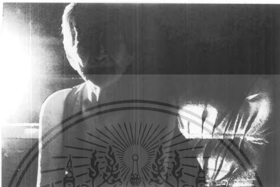
ภาพต้นแบบจีนที่ 3