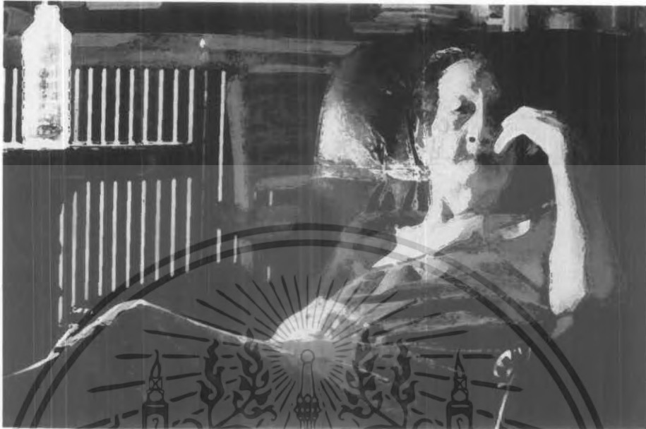
ภาพต้นแบบชั้นที่ 3