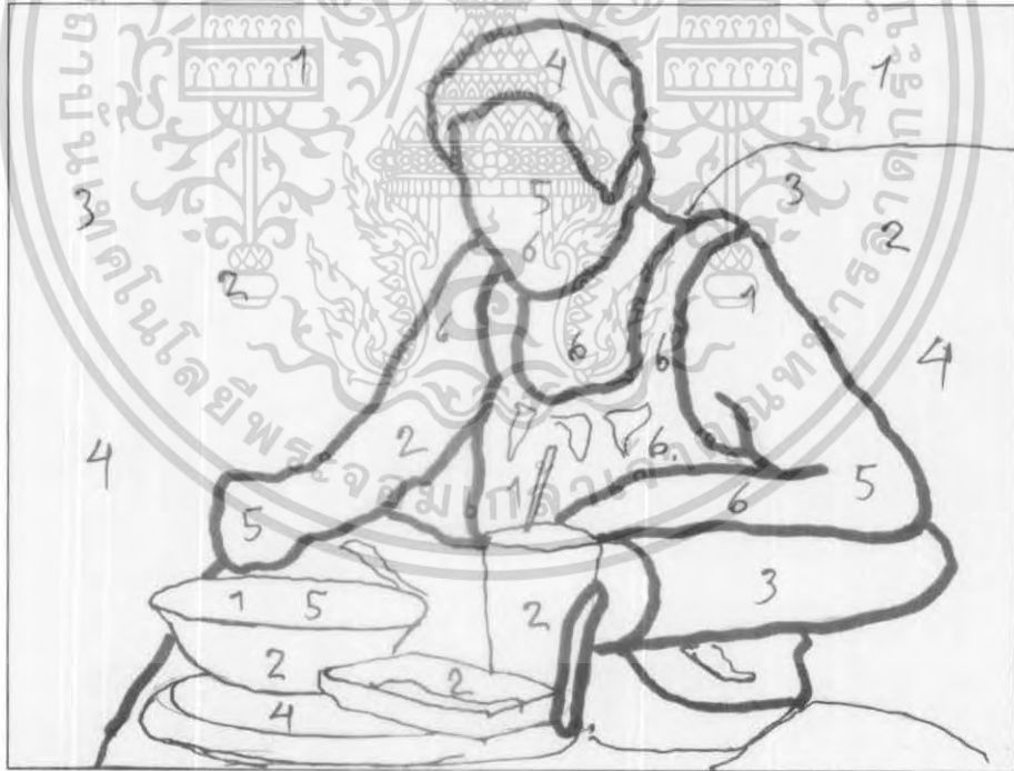
ภาพผลงานชิ้นที่ 2

เอกสารนี้เป็นเอกสารที่สงวนไว้สำหรับการใช้งานเพื่อการศึกษาเท่านั้น ไม่อนุญาตให้นำไปใช้ประโยชน์ด้านการค้า ไม่ว่ากรณีใดๆ ทั้งสิ้น อีกทั้งห้ามมิให้ตัดแปลงเนื้อหา และต้องอ้างอิงถึงเจ้าของเอกสารทุกครั้งที่มีการนำไปใช้