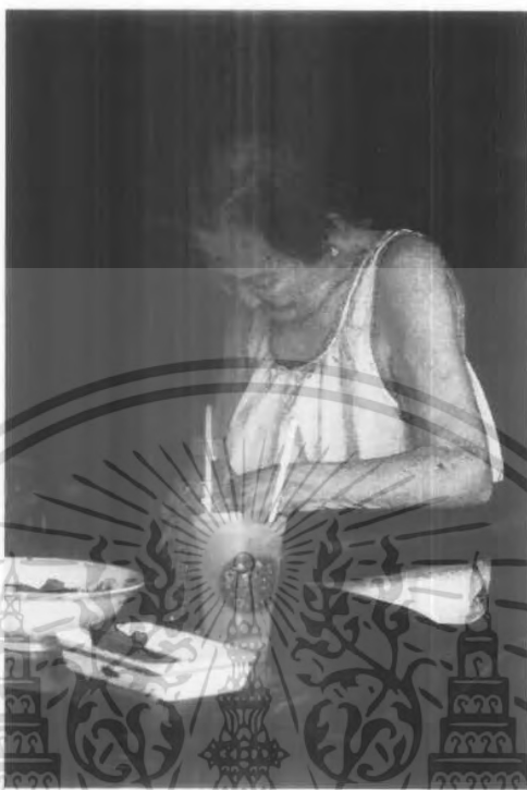
ภาพต้นแบบชิ้นที่ 4