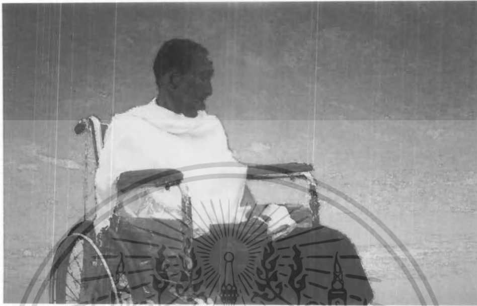
ภาพต้นแบบขั้นที่ 3