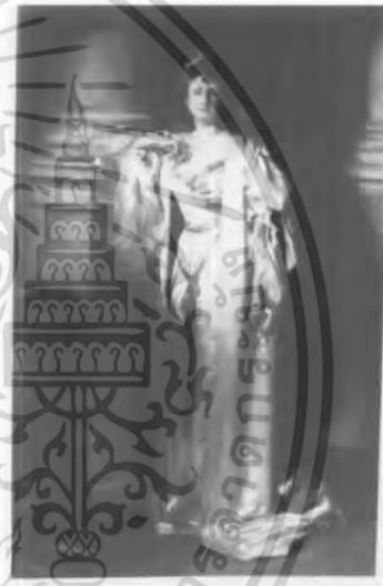
John Singer Sargent