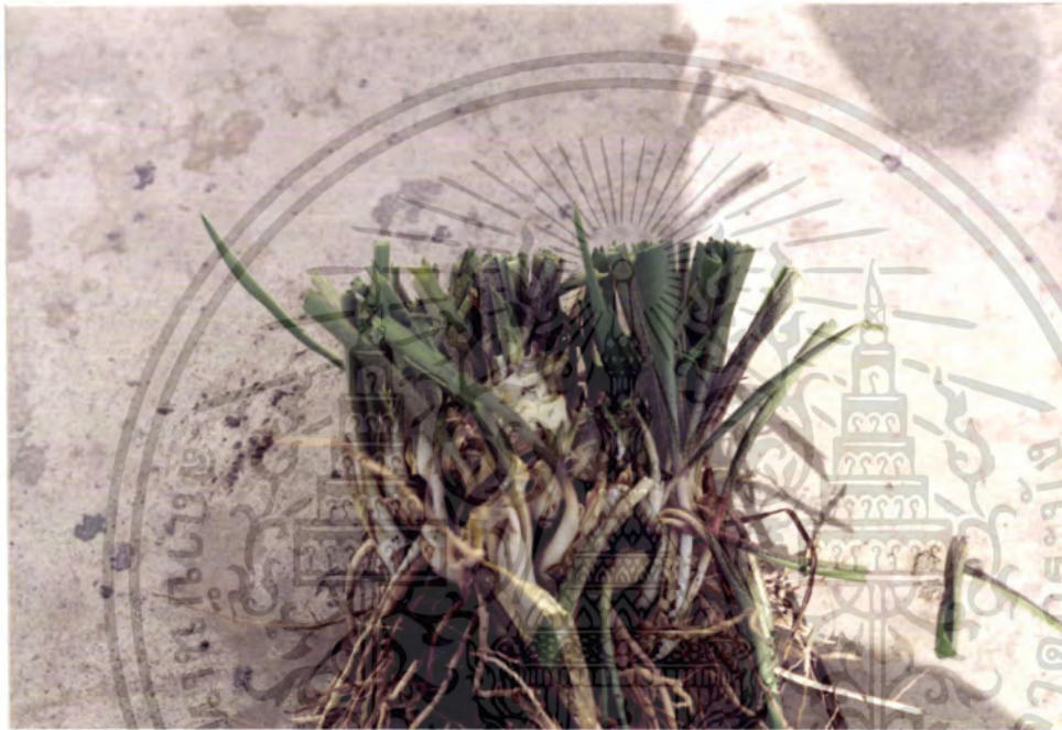
ภาพผนวกที่ 3 แสดงลักษณะการแตกหน่อของข้าวฮุ้นกลั่นไทย

เอกสารนี้เป็นเอกสารที่สงวนไว้สำหรับการใช้งานเพื่อการศึกษาเท่านั้น ไม่อนุญาตให้นำไปใช้ประโยชน์ด้านการค้า ไม่ว่ากรณีใดๆ ทั้งสิ้น อีกทั้งห้ามมิให้ดัดแปลงเนื้อหา และต้องอ้างอิงถึงเจ้าของเอกสารทุกครั้งที่มีการนำไปใช้