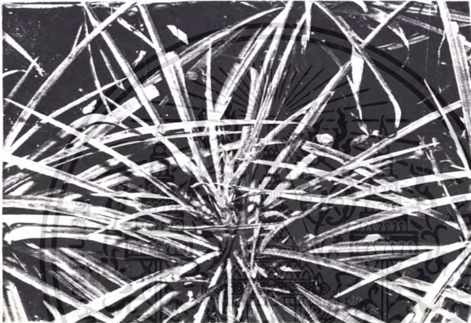
ภาพผนวกที่ 2 แสดงลักษณะการแทงช่อดอก ในครั้งแรกที่ treat GA 3

เอกสารนี้เป็นเอกสารที่สงวนไว้สำหรับการใช้งานเพื่อการศึกษาเท่านั้น ไม่อนุญาตให้นำไปใช้ประโยชน์ด้านการค้า ไม่ว่ากรณีใดๆ ทั้งสิ้น อีกทั้งห้ามมิให้ดัดแปลงเนื้อหา และต้องอ้างอิงถึงเจ้าของเอกสารทุกครั้งที่มีการนำไปใช้