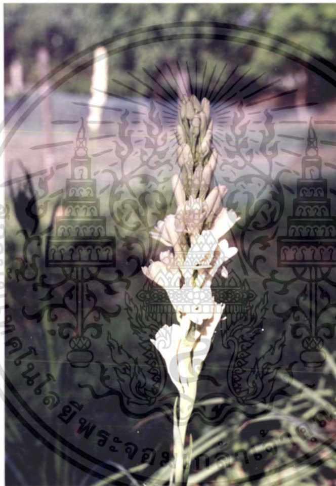
ภาพที่ 4 แสดงลักษณะของช่อดอกหลังจากแทงช่อดอกแล้ว 35 วัน

เอกสารนี้เป็นเอกสารที่สงวนไว้สำหรับงานใ้ทำงานเพื่อการศึกษาเท่านั้น ไม่อนุญาตให้นำไปใช้ประโยชน์ด้านการค้า 100317 ไม่ว่ากรณีใดๆ ทั้งสิ้น อีกทั้งห้ามมิให้ดัดแปลงเนื้อหา และต้องอ้างอิงถึงเจ้าของเอกสารทุกครั้งที่มีการนำไปใช้