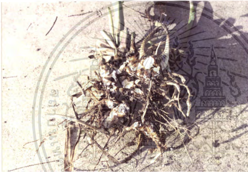
ภาพผนวกที่ 4 แสดงลักษณะของเห็ดแครงที่เข้าทำลายหน่อของช้อนกลิ้งไทย