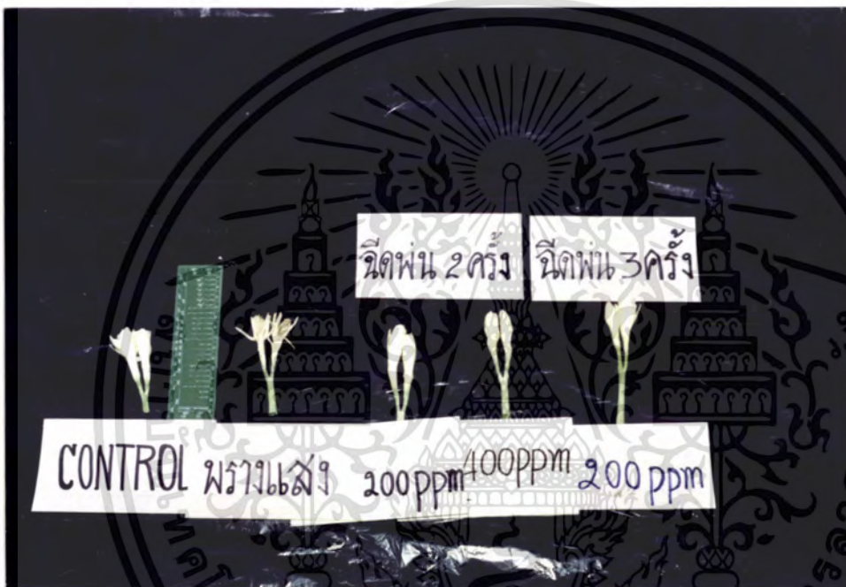
ภาพที่ 5 แสดงการเปรียบเทียบ ลักษณะของดอกและความยาวของดอกชอนกลิ่นไทย ในแต่ละวิธีการ

เอกสารนี้เป็นเอกสารที่สงวนไว้สำหรับการใช้งานเพื่อการศึกษาเท่านั้น ไม่อนุญาตให้นำไปใช้ประโยชน์ด้านการค้า ไม่ว่ากรณีใดๆ ทั้งสิ้น อีกทั้งห้ามมิให้ดัดแปลงเนื้อหา และต้องอ้างอิงถึงเจ้าของเอกสารทุกครั้งที่มีการนำไปใช้