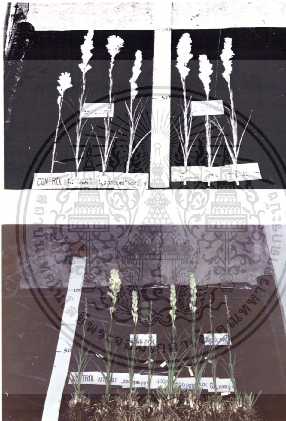
ภาพที่ 2-3 แสดงการเปรียบเทียบ ความยาวก้านดอก และความยาวช่อดอกของช่อนกลั่นไทย ในแต่ละวิธีการ

เอกสารนี้เป็นเอกสารที่สงวนไว้สำหรับการใช้งานเพื่อการศึกษาเท่านั้น ไม่อนุญาตให้นำไปใช้ประโยชน์ด้านการค้า ไม่ว่ากรณีใดๆ ทั้งสิ้น อีกทั้งห้ามมิให้ตัดแปลงเนื้อหา และต้องอ้างอิงถึงเจ้าของเอกสารทุกครั้งที่มีการนำไปใช้