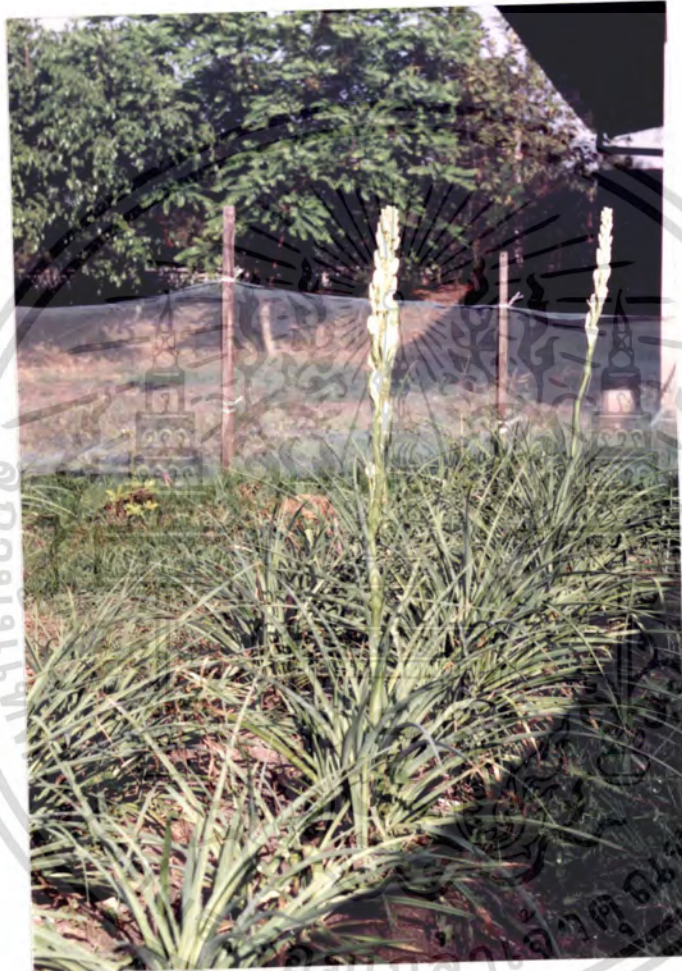
ภาพผนวกที่ 1 แสดงลักษณะของแปลงปลูก และสถานการณ์ให้ดอกของช่อนกลิ่นไทย ซึ่งให้ดอกไม่พร้อมกัน

เอกสารนี้เป็นเอกสารที่สงวนไว้สำหรับการใช้งานเพื่อการศึกษาเท่านั้น ไม่อนุญาตให้นำไปใช้ประโยชน์ด้านการค้า ไม่ว่ากรณีใดๆ ทั้งสิ้น อีกทั้งห้ามมิให้ตัดแปลงเนื้อหา และต้องอ้างอิงถึงเจ้าของเอกสารทุกครั้งที่มีการนำไปใช้