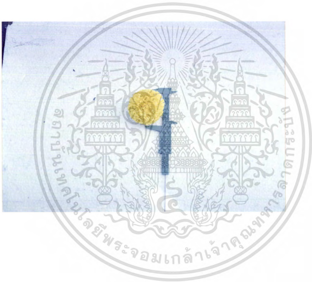
ภาพที่ 5 แสดงการวัดขนาดของดอกดาวเรืองพันธุ์ช่อฟเวอเรน

เอกสารนี้เป็นเอกสารที่สงวนไว้สำหรับการใช้งานเพื่อการศึกษาเท่านั้น ไม่อนุญาตให้นำไปใช้ประโยชน์ด้านการค้า ไม่ว่าจะกรณีใดๆ ทั้งสิ้น อีกทั้งห้ามมิให้ตัดแปลงเนื้อหา และต้องอ้างอิงถึงเจ้าของเอกสารทุกครั้งที่มีการนำไปใช้