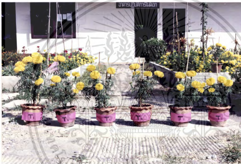
ภาพที่ 2 แสดงการเปรียบเทียบความสูงของต้นดาวเรือง ที่ให้สาร Paclobutrazol ที่ต่างระดับความเข้มข้น

เอกสารนี้เป็นเอกสารที่สงวนไว้สำหรับการใช้งานเพื่อการศึกษาเท่านั้น ไม่อนุญาตให้นำไปใช้ประโยชน์ด้านการค้า ไม่ว่ากรณีใดๆ ทั้งสิ้น อีกทั้งห้ามมิให้ตัดแปลงเนื้อหา และต้องอ้างอิงถึงเจ้าของเอกสารทุกครั้งที่มีการนำไปใช้