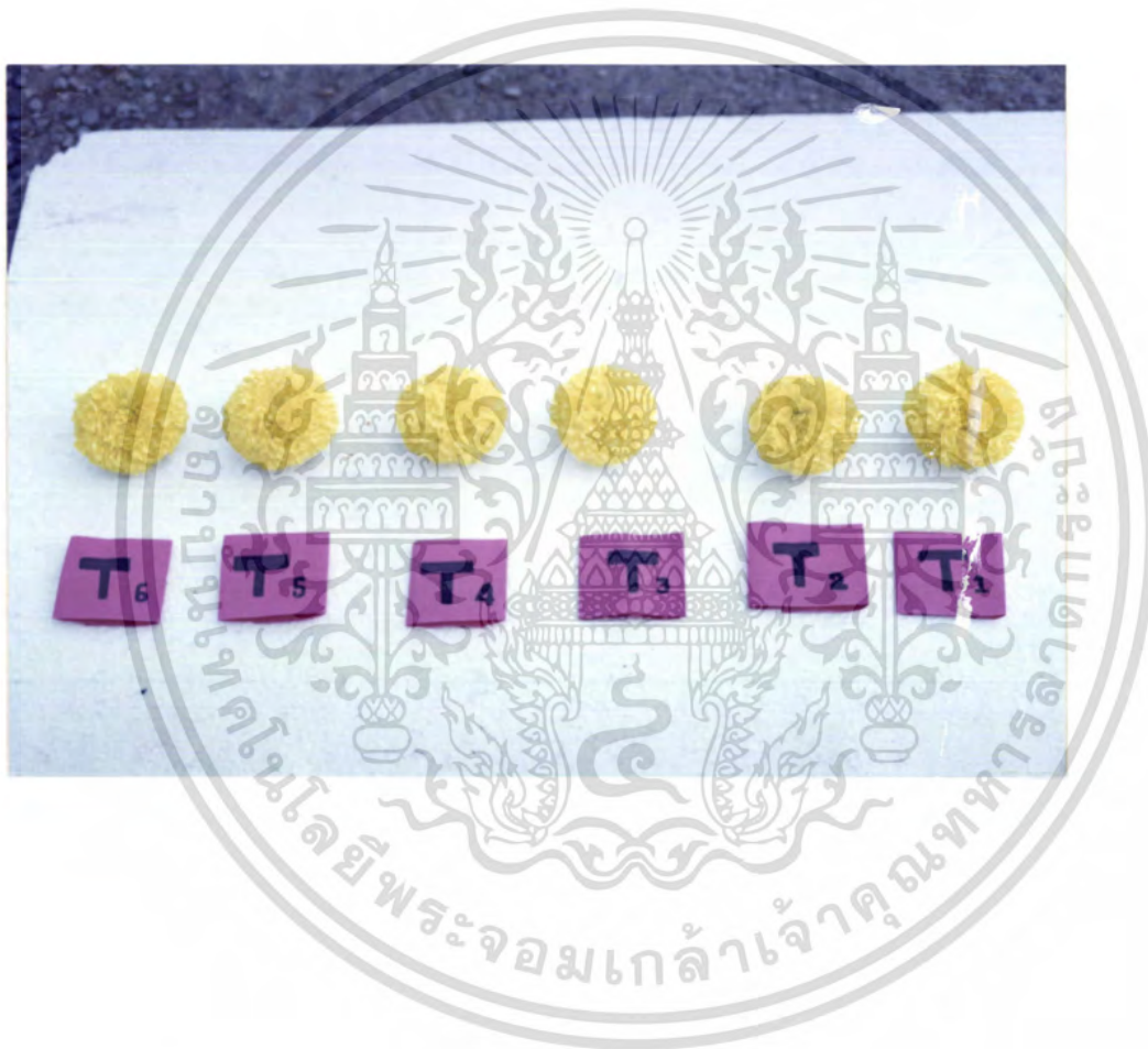
ภาพที่ 4 แสดงการเปรียบเทียบขนาดของดอกดาวเรืองที่ให้สาร Paclobutrazol ที่ต่างระดับความเข้มข้น

เอกสารนี้เป็นเอกสารที่สงวนไว้สำหรับการใช้งานเพื่อการศึกษาเท่านั้น ไม่อนุญาตให้นำไปใช้ประโยชน์ด้านการค้า ไม่ว่าจะกรณีใดๆ ทั้งสิ้น อีกทั้งห้ามมิให้ตัดแปลงเนื้อหา และต้องอ้างอิงถึงเจ้าของเอกสารทุกครั้งที่มีการนำไปใช้