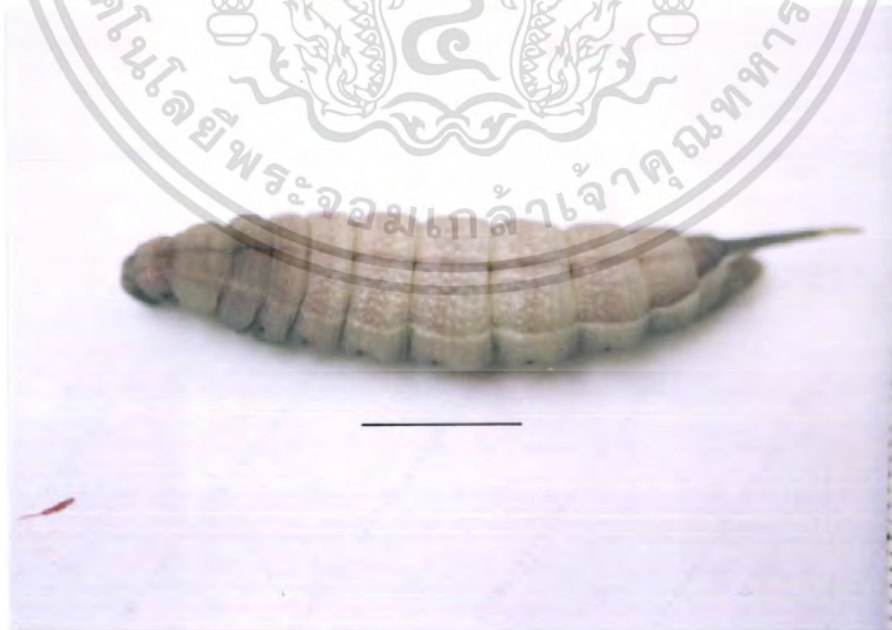
ภาพที่ 6 วัยก่อนเข้าดักแด้ (prepupal stage) ของผีเสื้อเหยี่ยว M. sitiene (bar = 10 mm) เอกสารนี้เป็นเอกสารที่สงวนไว้สำหรับการใช้งานเพื่อการศึกษาเท่านั้น ไม่อนุญาตให้นำไปใช้ประโยชน์ด้านการค้า ไม่ว่ากรณีใดๆ ทั้งสิ้น อีกทั้งห้ามมิให้ตัดแปลงเนื้อหา และต้องอ้างอิงถึงเจ้าของเอกสารทุกครั้งที่มีการนำไปใช้

ล่าง : หนอนวัยสีตอนต้นฟอร์มสีคอนไปทางน้ำตาล