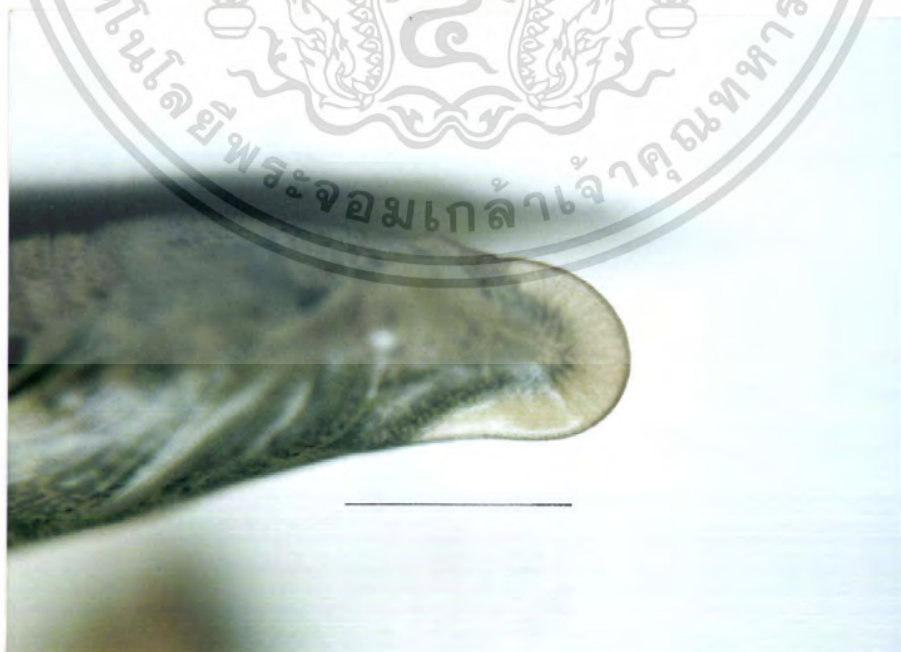
ภาพที่ 8 ดักแด้ของผีเสื้อเหี้ยยว M. sitiene แสดง proboscis (ครี) (bar = 10 mm)

เอกสารนี้เป็นเอกสารที่สงวนไว้สำหรับการใช้งานเพื่อการศึกษาเท่านั้น ไม่อนุญาตให้นำไปเผยแพร่บนสื่อออนไลน์ การค้าไม่ว่ากรณีใดๆ ทั้งสิ้น อีกทั้งห้ามมิให้ตัดแปลงเนื้อหา และต้องอ้างอิงถึงเจ้าของเอกสารทุกครั้งที่มีการนำไปใช้