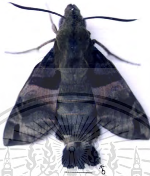
ภาพที่ 11 ตัวเต็มวัยของผีเสื้อเหยี่ยว M. sitiene เพศผู้ ในตำแหน่งพักตัว (bar = 5 mm)