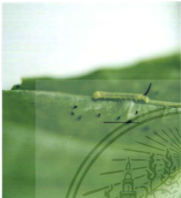
ภาพที่ 3 หนอนของผีเสื้อเหยี่ยว M. sitiene (bar = 5 mm.)