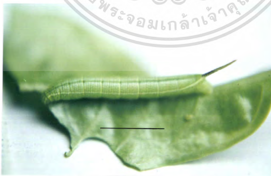
เอกสารนี้เป็นเอกสารที่สงวนไว้สำหรับงานเพื่อการศึกษาเท่านั้น ไม่อนุญาตให้นำไปใช้ประโยชน์ด้านการค้า ภาพที่ 4 หนอนวัยสามของผีเสื้อเหยี่ยว M. sitiene (bar = 10 mm.) ไม่ว่ากรณีใดๆ ทั้งสิ้น อีกทั้งห้ามมีเหตุดัดแปลงเนื้อหา และต้องอ้างอิงถึงเจ้าของเอกสารทุกครั้งที่มีการนำไปใช้