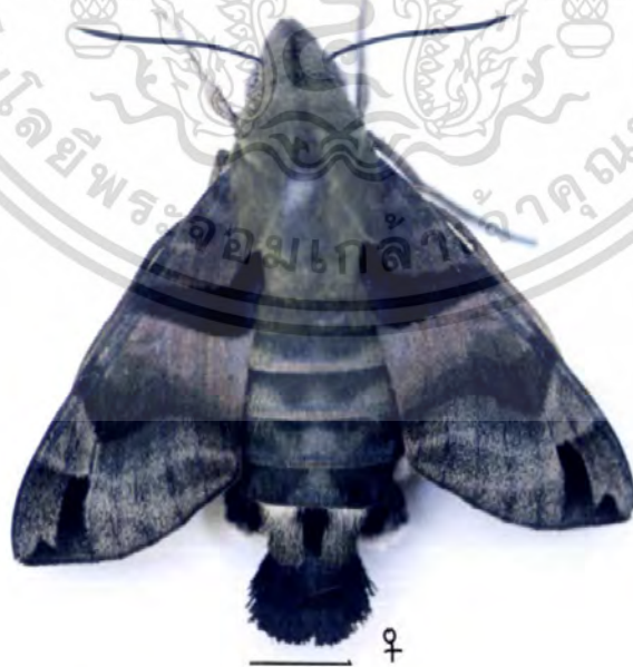
ภาพที่ 12 ตัวเต็มวัยของผีเสื้อเหยี่ยว M. sitiene เพศเมีย ในตำแหน่งพักตัว