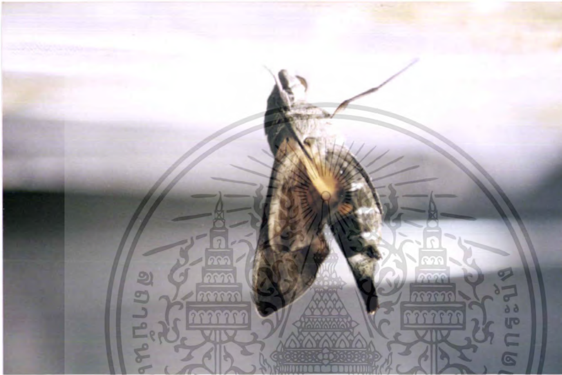
ภาพที่ 10 ตัวเต็มวัยของผีเสื้อเหยี่ยว M. sitiene ที่เพิ่งออกมาจากดักแด้

เอกสารนี้เป็นเอกสารที่สงวนไว้สำหรับการใช้งานเพื่อการศึกษาเท่านั้น ไม่อนุญาตให้นำไปใช้ประโยชน์ด้านการค้า ไม่ว่ากรณีใดๆ ทั้งสิ้น อีกทั้งห้ามมิให้ดัดแปลงเนื้อหา และต้องอ้างอิงถึงเจ้าของเอกสารทุกครั้งที่มีการนำไปใช้