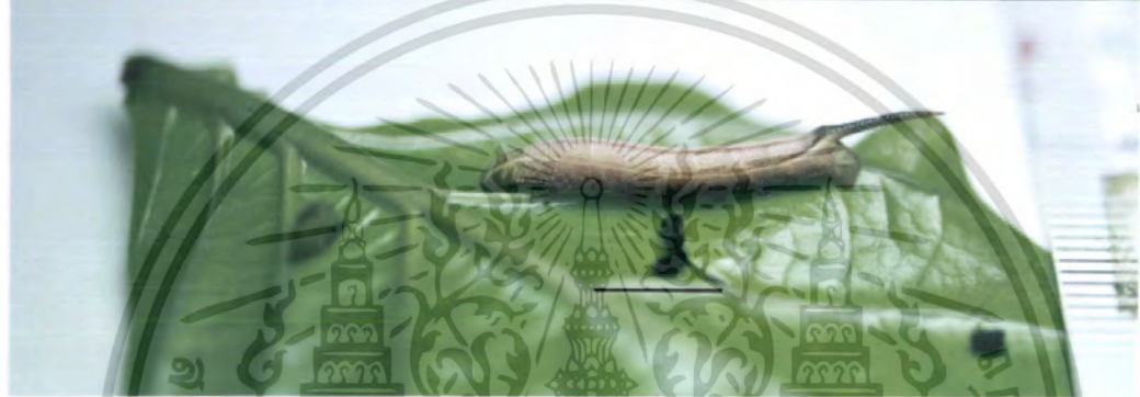
ภาพที่ 5 หนอนวัยสีของผีเสื้อเหยี่ยว M. sitiene (bar = 10 mm) ? ?