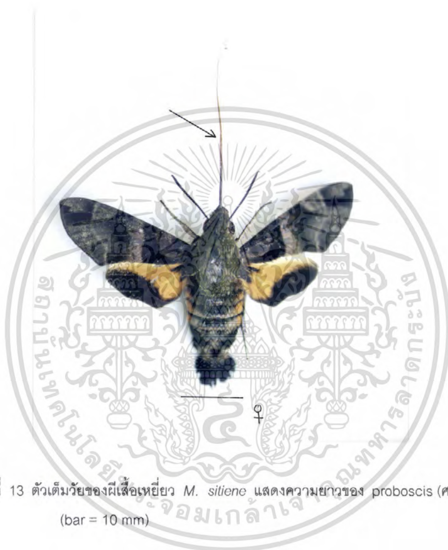
ภาพที่ 13 ตัวเต็มวัยของผีเสื้อเหยี่ยว M. siliene แสดงความยาวของ proboscis (ครี) (bar = 10 mm)

เอกสารนี้เป็นเอกสารที่สงวนไว้สำหรับการใช้งานเพื่อการศึกษาเท่านั้น ไม่อนุญาตให้นำไปใช้ประโยชน์ด้านการค้า ไม่ว่ากรณีใดๆ ทั้งสิ้น อีกทั้งห้ามมิให้ดัดแปลงเนื้อหา และต้องอ้างอิงถึงเจ้าของเอกสารทุกครั้งที่มีการนำไปใช้