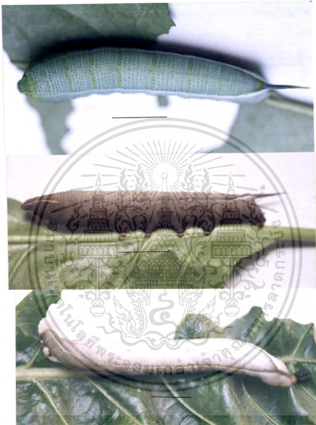
ภาพที่ 2 หนอนวัย 5 ของผีเสื้อเหี่ยว M. sitiene (bar = 10 mm.)

เอกสารนี้เป็นเอกสารที่สงวนไว้สำหรับการใช้งานเพื่อการศึกษาเท่านั้น ไม่อนุญาตให้นำไปใช้ประโยชน์ด้านการค้า ไม่ว่าจะกรณีใดๆ ทั้งสิ้น อีกทั้งห้ามมิให้ดัดแปลงเนื้อหา และต้องอ้างอิงถึงเจ้าของเอกสารทุกครั้งที่มีการนำไปใช้