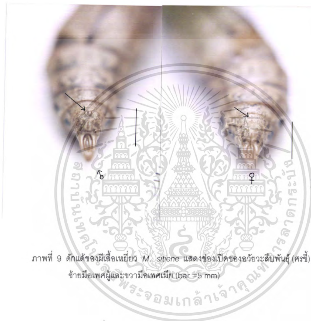
ภาพที่ 9 ดักแด้ของผีเสื้อเหี้ยยว M. sitione แสดงของเปิดของอวัยวะสืบพันธุ์ (ศรชี้) ชายมือเพศผู้และขามือเพศเมีย (bar =5 mm)

เอกสารนี้เป็นเอกสารที่สงวนไว้สำหรับการใช้งานเพื่อการศึกษาเท่านั้น ไม่อนุญาตให้นำไปใช้ประโยชน์ด้านการค้า ไม่ว่าจะกรณีใดๆ ทั้งสิ้น อีกทั้งห้ามมิให้ดัดแปลงเนื้อหา และต้องอ้างอิงถึงเจ้าของเอกสารทุกครั้งที่มีการนำไปใช้