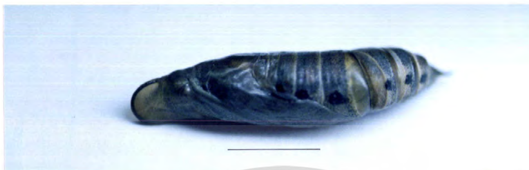
ภาพที่ 7 ดักแด้ของผีเสื้อเหี้ยยว M. sitiene โถงออกเป็นตัว (bar = 10 mm)