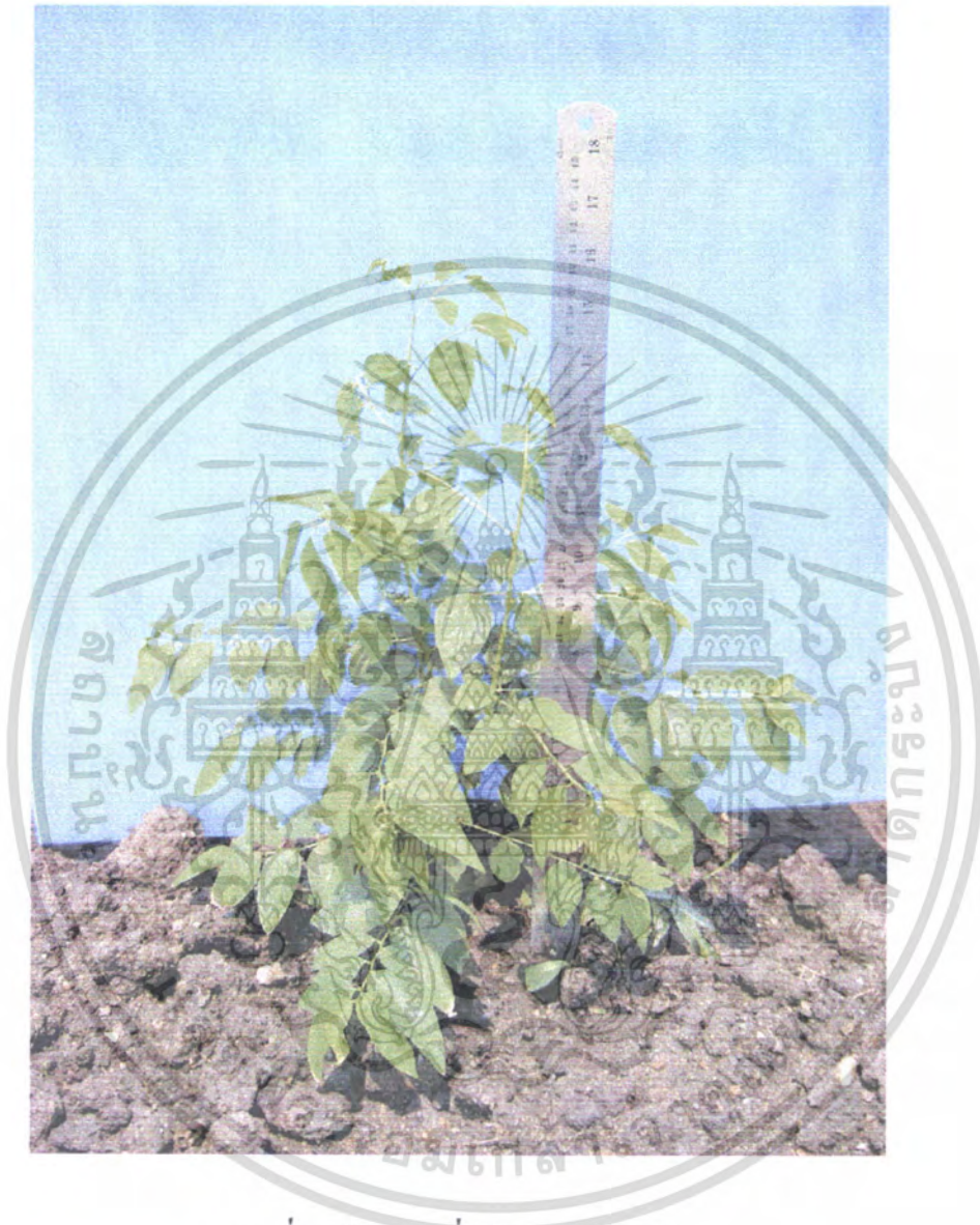
ภาพที่ 3 ผักหวานที่ใส่ปุ๋ยผสม 10 กรัม

เอกสารนี้เป็นเอกสารที่สงวนไว้สำหรับการใช้งานเพื่อการศึกษาเท่านั้น ไม่อนุญาตให้นำไปใช้ประโยชน์ด้านการค้า ไม่ว่าจะกรณีใดๆ ทั้งสิ้น อีกทั้งห้ามมิให้ดัดแปลงเนื้อหา และต้องอ้างอิงถึงเจ้าของเอกสารทุกครั้งที่มีการนำไปใช้