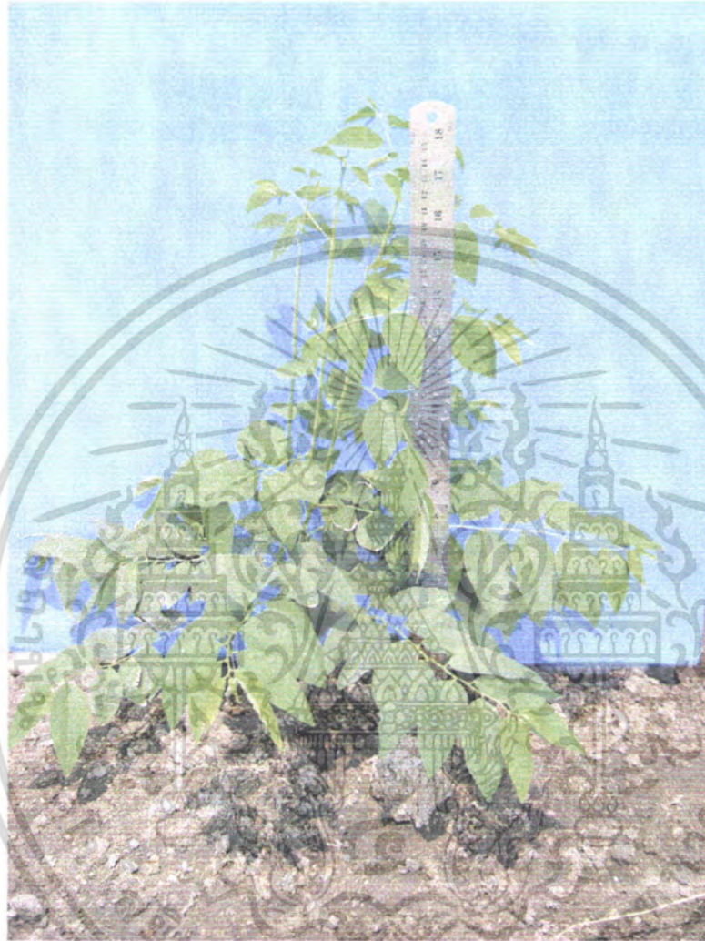
ภาพที่ 6 ผักหวานที่ใส่ปุ๋ยผสม 40 กรัม

เอกสารนี้เป็นเอกสารที่สงวนไว้สำหรับการใช้งานเพื่อการศึกษาเท่านั้น ไม่อนุญาตให้นำไปใช้ประโยชน์ด้านการค้า ไม่ว่าจะกรณีใดๆ ทั้งสิ้น อีกทั้งห้ามมิให้ดัดแปลงเนื้อหา และต้องอ้างอิงถึงเจ้าของเอกสารทุกครั้งที่มีการนำไปใช้