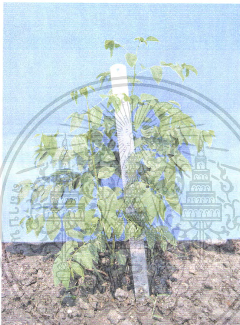
ภาพที่ 5 พืชหวานที่ใส่ปุ๋ยผสม 30 กรัม

เอกสารนี้เป็นเอกสารที่สงวนไว้สำหรับการใช้งานเพื่อการศึกษาเท่านั้น ไม่อนุญาตให้นำไปใช้ประโยชน์ด้านการค้า ไม่ว่าจะกรณีใดๆ ทั้งสิ้น อีกทั้งห้ามมิให้ดัดแปลงเนื้อหา และต้องอ้างอิงถึงเจ้าของเอกสารทุกครั้งที่มีการนำไปใช้