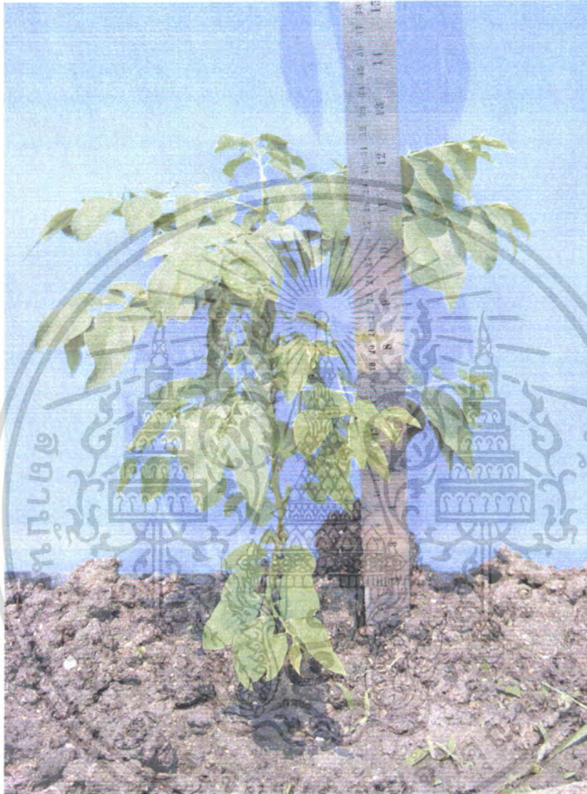
ภาพที่ 2 ผักหวานที่ไม่ใส่ปุ๋ยผสม ( control )

เอกสารนี้เป็นเอกสารที่สงวนไว้สำหรับการใช้งานเพื่อการศึกษาเท่านั้น ไม่อนุญาตให้นำไปใช้ประโยชน์ด้านการค้า ไม่ว่ากรณีใดๆ ทั้งสิ้น อีกทั้งห้ามมิให้ดัดแปลงเนื้อหา และต้องอ้างอิงถึงเจ้าของเอกสารทุกครั้งที่มีการนำไปใช้