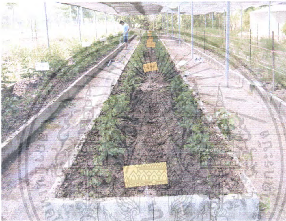
ภาพที่ 1 แปลงปลูกผักหวาน

เอกสารนี้เป็นเอกสารที่สงวนไว้สำหรับการใช้งานเพื่อการศึกษาเท่านั้น ไม่อนุญาตให้นำไปใช้ประโยชน์ด้านการค้า ไม่ว่าจะกรณีใดๆ ทั้งสิ้น อีกทั้งห้ามมิให้ดัดแปลงเนื้อหา และต้องอ้างอิงถึงเจ้าของเอกสารทุกครั้งที่มีการนำไปใช้