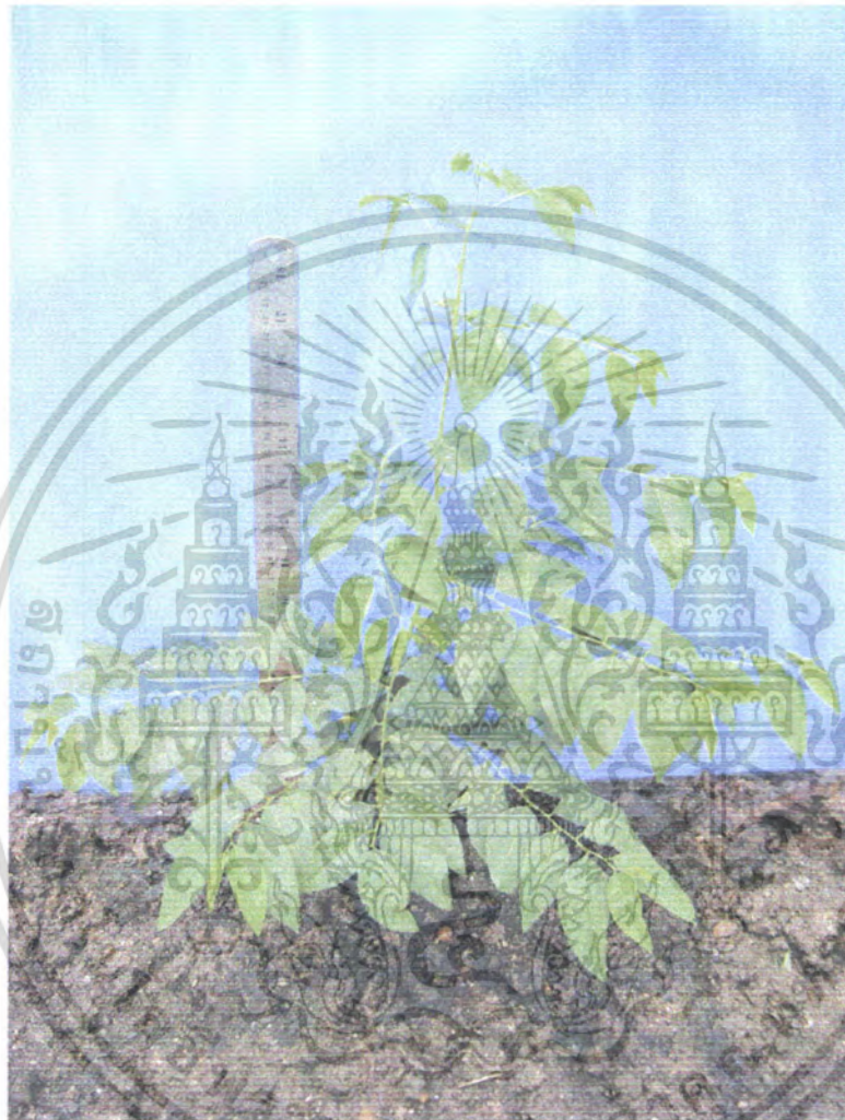
ภาพที่ 7 ผักหวานที่ใส่ปุ๋ยผสม 50 กรัม

เอกสารนี้เป็นเอกสารที่สงวนไว้สำหรับการใช้งานเพื่อการศึกษาเท่านั้น ไม่อนุญาตให้นำไปใช้ประโยชน์ด้านการค้า ไม่ว่าจะกรณีใดๆ ทั้งสิ้น อีกทั้งห้ามมิให้ดัดแปลงเนื้อหา และต้องอ้างอิงถึงเจ้าของเอกสารทุกครั้งที่มีการนำไปใช้