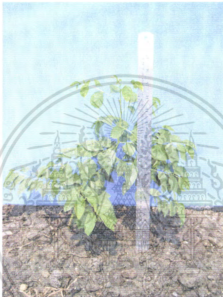
ภาพที่ 8 ผักหวานที่ใส่ปุ๋ยผสม 60 กรัม

เอกสารนี้เป็นเอกสารที่สงวนไว้สำหรับการใช้งานเพื่อการศึกษาเท่านั้น ไม่อนุญาตให้นำไปใช้ประโยชน์ด้านการค้า ไม่ว่ากรณีใดๆ ทั้งสิ้น อีกทั้งห้ามมิให้ดัดแปลงเนื้อหา และต้องอ้างอิงถึงเจ้าของเอกสารทุกครั้งที่มีการนำไปใช้