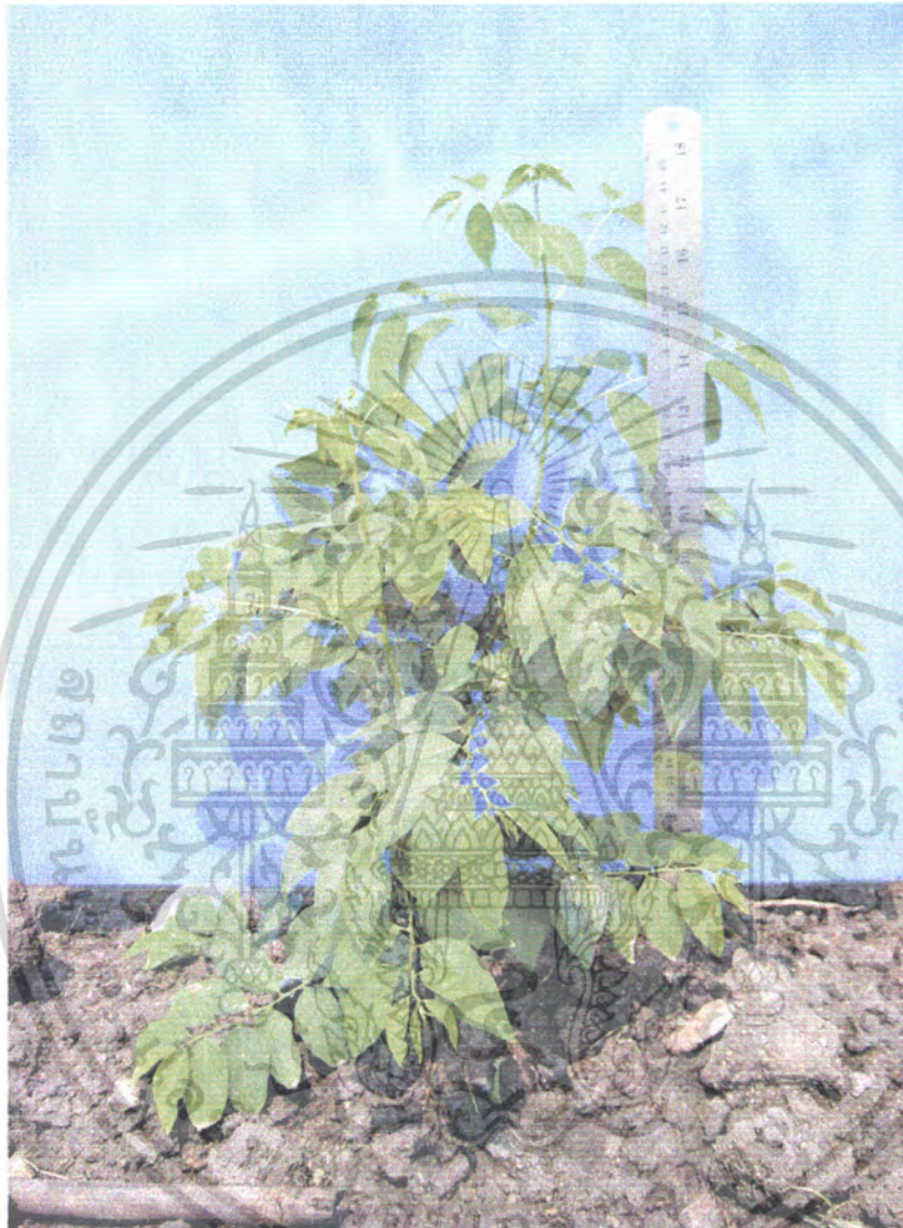
ภาพที่ 4 ผักหวานที่ใส่ปุ๋ยผสม 20 กรัม

เอกสารนี้เป็นเอกสารที่สงวนไว้สำหรับการใช้งานเพื่อการศึกษาเท่านั้น ไม่อนุญาตให้นำไปใช้ประโยชน์ด้านการค้า ไม่ว่าจะกรณีใดๆ ทั้งสิ้น อีกทั้งห้ามมิให้ดัดแปลงเนื้อหา และต้องอ้างอิงถึงเจ้าของเอกสารทุกครั้งที่มีการนำไปใช้