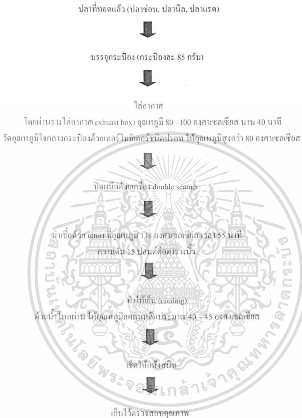
ภาพที่ 3 ขั้นตอนการผลิตปลาทอดกระเทียมพริกไทยบรรจุกระป๋อง

เอกสารนี้เป็นเอกสารที่สงวนไว้สำหรับการใช้งานเพื่อการศึกษาเท่านั้น ไม่อนุญาตให้นำไปใช้ประโยชน์ด้านการค้า ไม่ว่ากรณีใดๆ ทั้งสิ้น อีกทั้งห้ามมิให้ตัดแปลงเนื้อหา และต้องอ้างอิงถึงเจ้าของเอกสารทุกครั้งที่มีการนำไปใช้