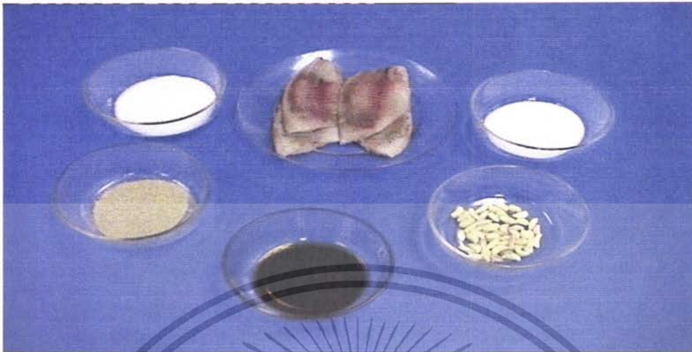
ภาพที่ 1 วัตถุดิบที่ใช้ในการผลิตปลาทอดกระเทียมพริกไทยบรรจุกระป๋อง