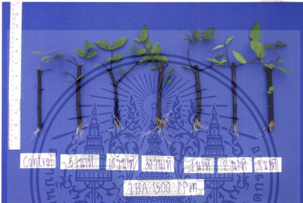
ภาพที่ 2 แสดงจำนวนราก ความยาวราก ความยาวยอด และจำนวนยอดของไมกชัน หลังปักชำ 60 วัน

เอกสารนี้เป็นเอกสารที่สงวนไว้สำหรับการใช้งานเพื่อการศึกษาเท่านั้น ไม่อนุญาตให้นำไปใช้ประโยชน์ด้านการค้า ไม่ว่ากรณีใดๆ ทั้งสิ้น อีกทั้งห้ามมิให้ดัดแปลงเนื้อหา และต้องอ้างอิงถึงเจ้าของเอกสารทุกครั้งที่มีการนำไปใช้