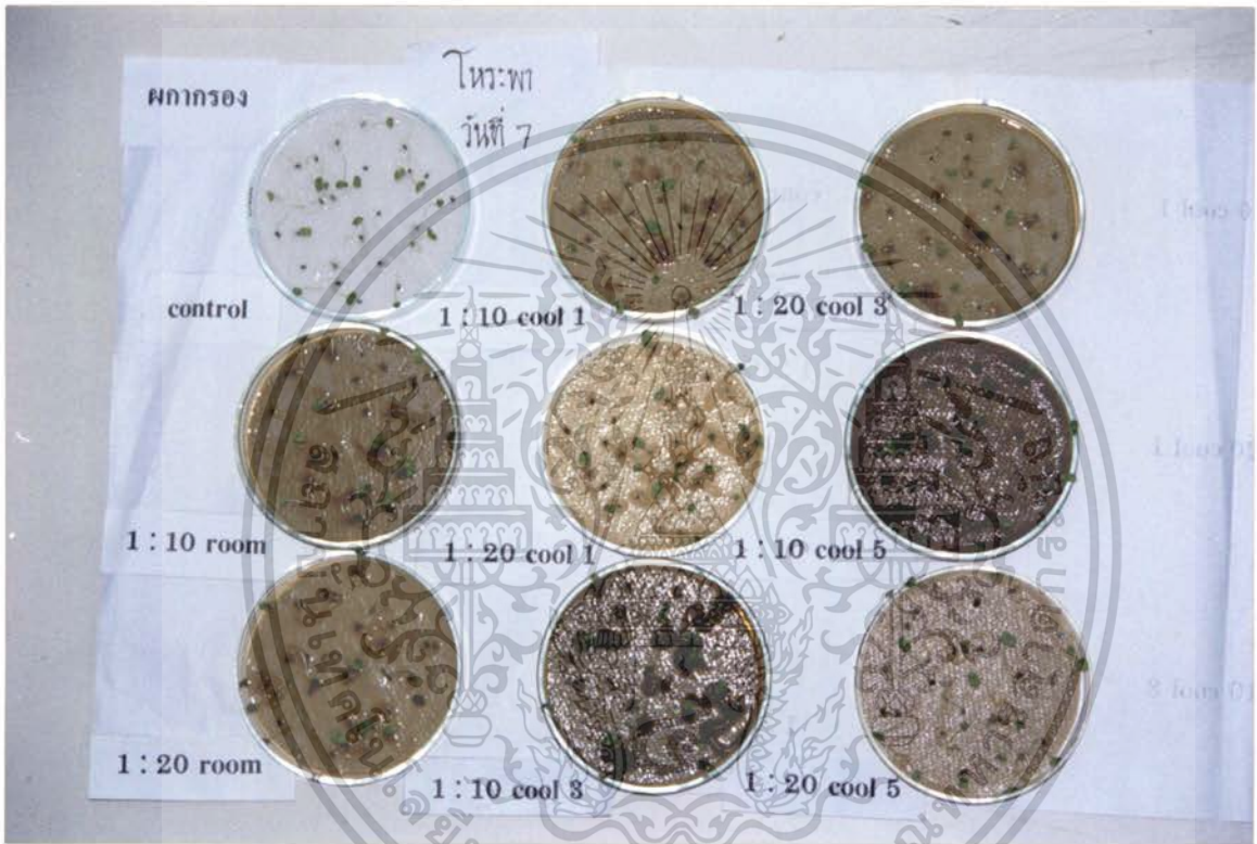
ภาพที่ 6 แสดงการเปรียบเทียบสารสกัดจากใบผลากรองที่มีผลต่อแบคทีเรียชนิดการงอกของเมล็ด โทระพา ที่มีอายุ 7 วัน

เอกสารนี้เป็นเอกสารที่สงวนไว้สำหรับการใช้งานเพื่อการศึกษาเท่านั้น ไม่อนุญาตให้นำไปใช้ประโยชน์ด้านการค้า ไม่ว่ากรณีใดๆ ทั้งสิ้น อีกทั้งห้ามมิให้ดัดแปลงเนื้อหา และต้องอ้างอิงถึงเจ้าของเอกสารทุกครั้งที่มีการนำไปใช้