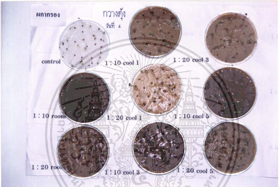
ภาพที่ 9 แสดงการเปรียบเทียบสารสกัดจากใบผลากรองที่มีผลต่อเปอร์เซ็นต์การงอกของเมลิ็ด กว้างตุ้ง ที่มีอายุ 4 วัน

เอกสารนี้เป็นเอกสารที่สงวนไว้สำหรับการใช้งานเพื่อการศึกษาเท่านั้น ไม่อนุญาตให้นำไปใช้ประโยชน์ด้านการค้า ไม่ว่าจะกรณีใดๆ ทั้งสิ้น อีกทั้งห้ามมิให้ดัดแปลงเนื้อหา และต้องอ้างอิงถึงเจ้าของเอกสารทุกครั้งที่มีการนำไปใช้