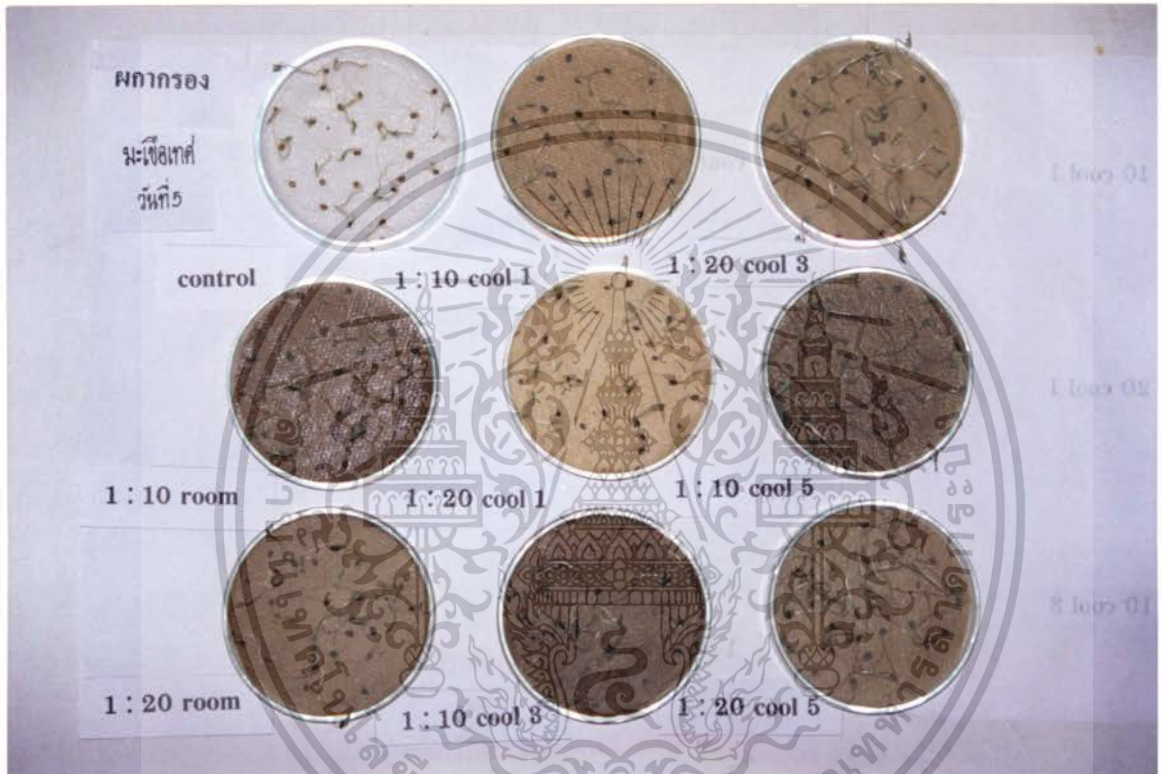
ภาพที่ 1 แสดงการเปรียบเทียบสารสกัดจากใบผลากรองที่มีผลต่อเปอร์เซ็นต์การงอกของเชื้อรา มะเขือเทศ ที่มีอายุ 5 วัน

เอกสารนี้เป็นเอกสารที่สงวนไว้สำหรับการใช้งานเพื่อการศึกษาเท่านั้น ไม่อนุญาตให้นำไปใช้ประโยชน์ด้านการค้า ไม่ว่ากรณีใดๆ ทั้งสิ้น อีกทั้งห้ามมิให้ดัดแปลงเนื้อหา และต้องอ้างอิงถึงเจ้าของเอกสารทุกครั้งที่มีการนำไปใช้