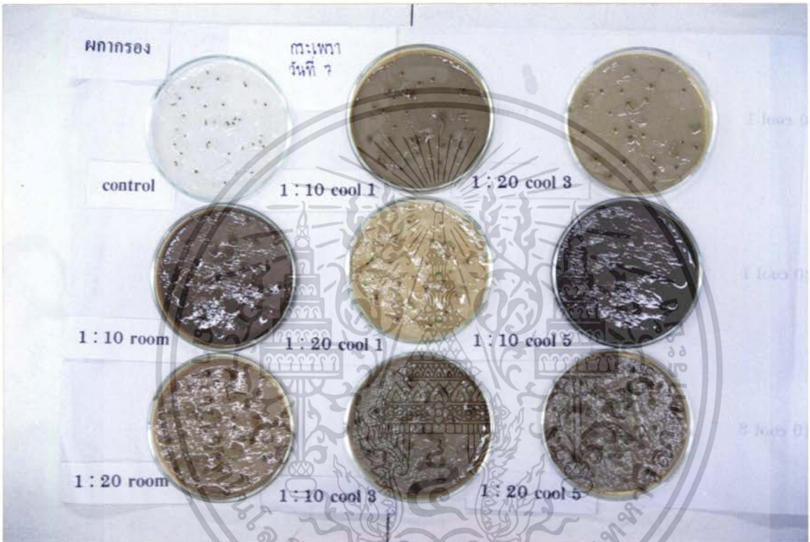
ภาพที่ 8 แสดงการเปรียบเทียบสารสกัดจากใบสกากรองที่มีผลต่อเปอร์เซ็นต์การงอกของเมล็ด กระเพรา ที่มีอายุ 7 วัน

เอกสารนี้เป็นเอกสารที่สงวนไว้สำหรับการใช้งานเพื่อการศึกษาเท่านั้น ไม่อนุญาตให้นำไปใช้ประโยชน์ด้านการค้า ไม่ว่ากรณีใดๆ ทั้งสิ้น อีกทั้งห้ามมิให้ดัดแปลงเนื้อหา และต้องอ้างอิงถึงเจ้าของเอกสารทุกครั้งที่มีการนำไปใช้