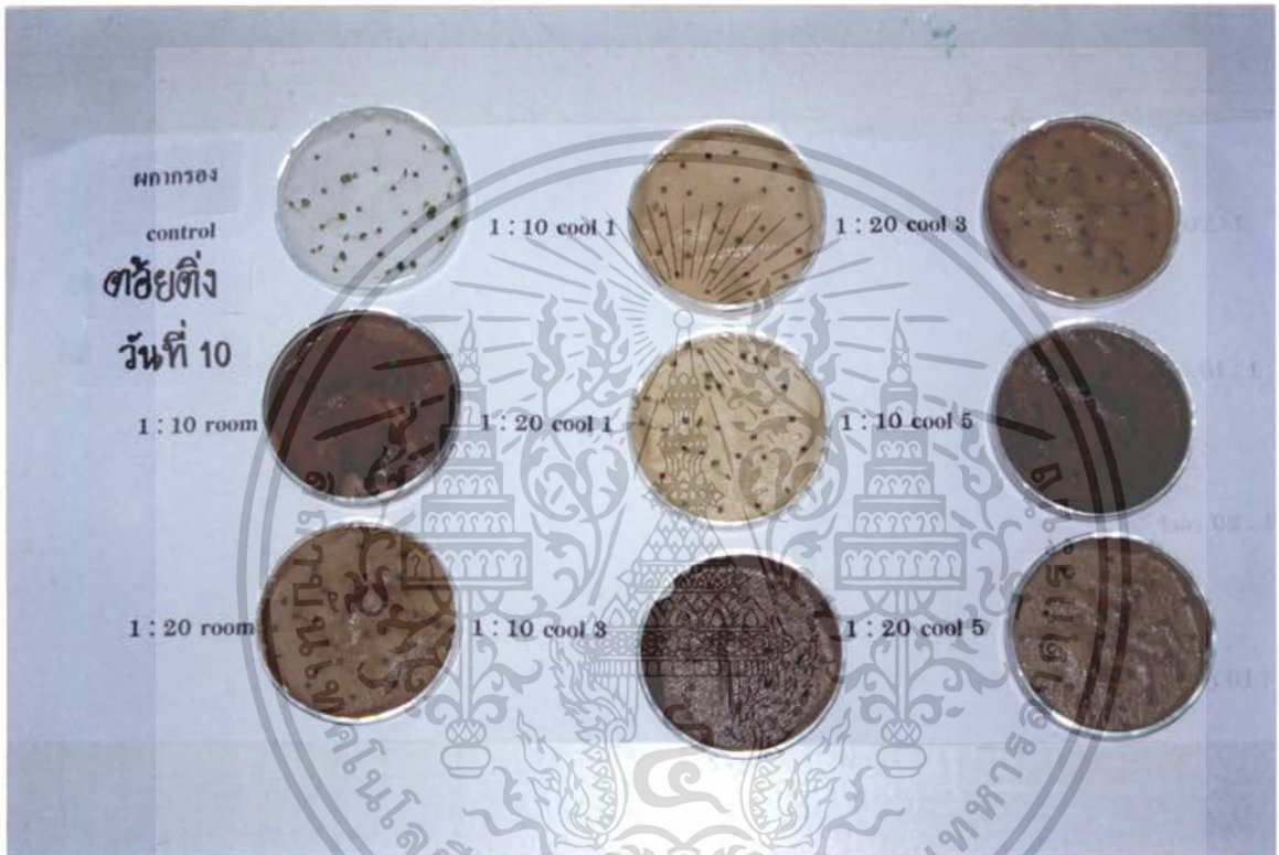
ภาพที่ 4 แสดงการเปรียบเทียบสารสกัดจากใบผลัดต่อเปอร์เซ็นต์การงอกของเมล็ด ค้อยคิ่ง ที่มีอายุ 10 วัน

เอกสารนี้เป็นเอกสารที่สงวนไว้สำหรับการใช้งานเพื่อการศึกษาเท่านั้น ไม่อนุญาตให้นำไปใช้ประโยชน์ด้านการค้า ไม่ว่ากรณีใดๆ ทั้งสิ้น อีกทั้งห้ามมิให้ดัดแปลงเนื้อหา และต้องอ้างอิงถึงเจ้าของเอกสารทุกครั้งที่มีการนำไปใช้