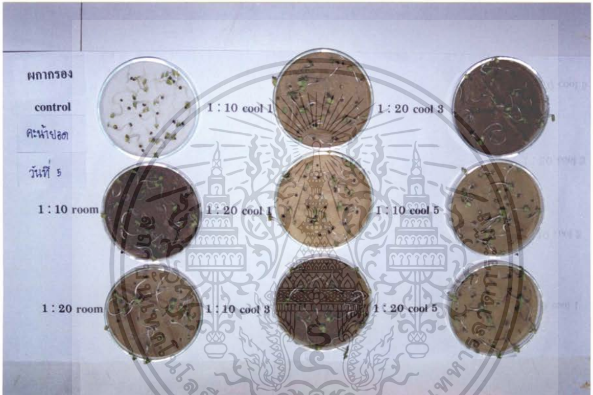
ภาพที่ 2 แสดงการเปรียบเทียบสารสกัดจากใบผลารองที่มีผลต่อเปอร์เซ็นต์การงอกของเมล็ด คะน้ายอด ที่มีอายุ 5 วัน

เอกสารนี้เป็นเอกสารที่สงวนไว้สำหรับการใช้งานเพื่อการศึกษาเท่านั้น ไม่อนุญาตให้นำไปใช้ประโยชน์ด้านการค้า ไม่ว่ากรณีใดๆ ทั้งสิ้น อีกทั้งห้ามมิให้ดัดแปลงเนื้อหา และต้องอ้างอิงถึงเจ้าของเอกสารทุกครั้งที่มีการนำไปใช้