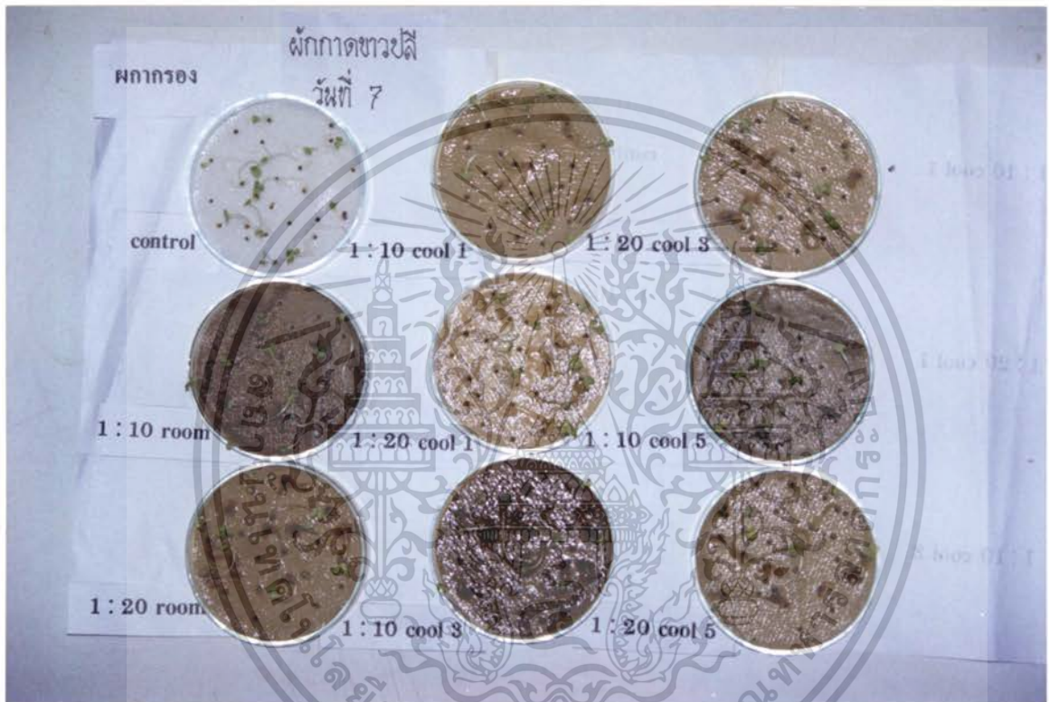
ภาพที่ 5 แสดงการเปรียบเทียบสารสกัดจากใบผลการรอกที่มีผลต่อเปอร์เซ็นต์การงอกของเมล็ด ผักกาดขาวปลี ที่มีอายุ 7 วัน

เอกสารนี้เป็นเอกสารที่สงวนไว้สำหรับการใช้งานเพื่อการศึกษาเท่านั้น ไม่อนุญาตให้นำไปใช้ประโยชน์ด้านการค้า ไม่ว่าจะกรณีใดๆ ทั้งสิ้น อีกทั้งห้ามมิให้ดัดแปลงเนื้อหา และต้องอ้างอิงถึงเจ้าของเอกสารทุกครั้งที่มีการนำไปใช้