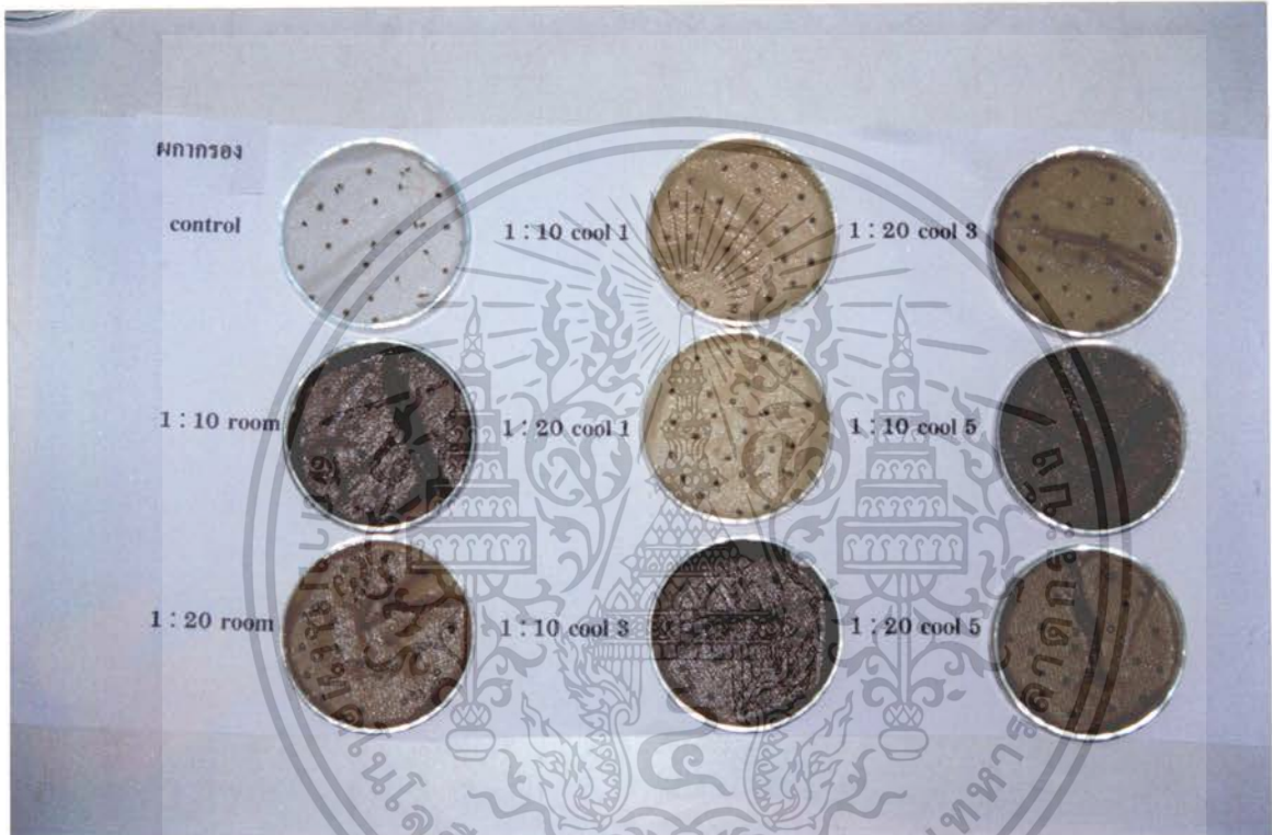
ภาพที่ 3 แสดงการเปรียบเทียบสารสกัดจากใบผลากรองที่มีผลต่อเปอร์เซ็นต์การงอกของเมล็ด ผักกาดหอม ที่มีอายุ 5 วัน

เอกสารนี้เป็นเอกสารที่สงวนไว้สำหรับการใช้งานเพื่อการศึกษาเท่านั้น ไม่อนุญาตให้นำไปใช้ประโยชน์ด้านการค้า ไม่ว่าจะกรณีใดๆ ทั้งสิ้น อีกทั้งห้ามมิให้ดัดแปลงเนื้อหา และต้องอ้างอิงถึงเจ้าของเอกสารทุกครั้งที่มีการนำไปใช้