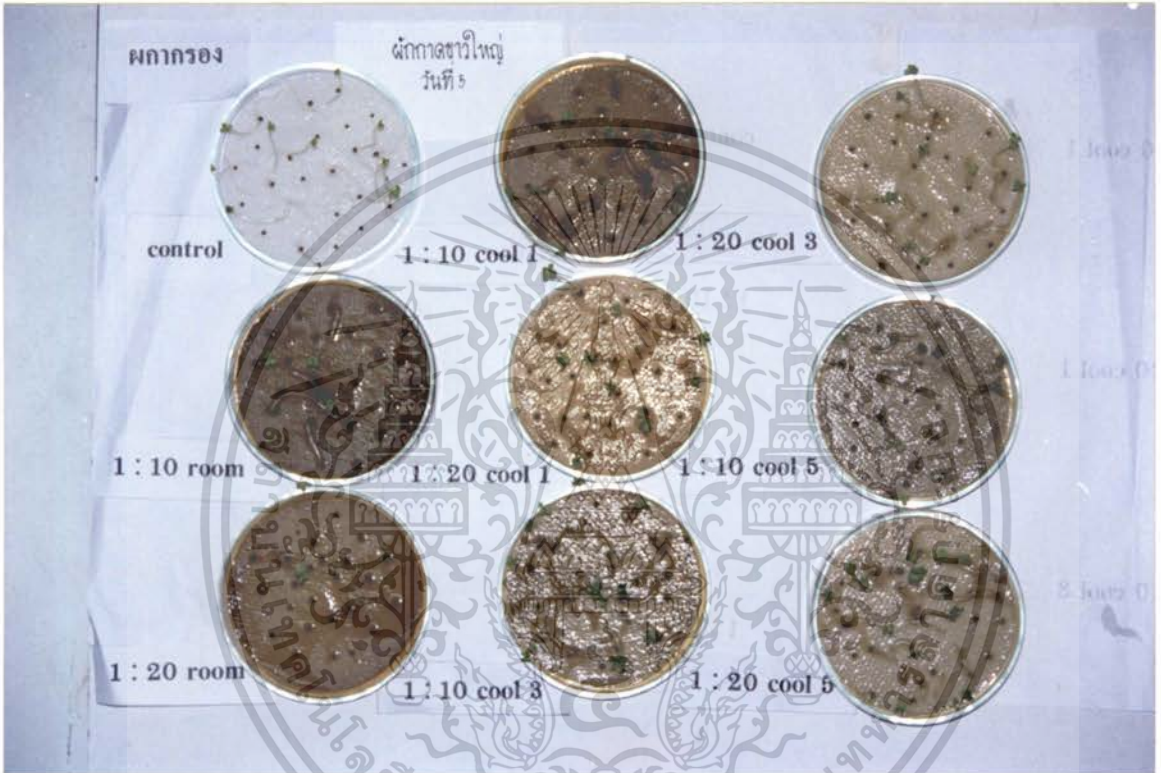
ภาพที่ 7 แสดงการเปรียบเทียบสารสกัดจากใบผลกากรองที่มีผลต่อเปอร์เซ็นต์การงอกของแมลง ผักกาดขาวใหญ่ ที่มีอายุ 5 วัน

เอกสารนี้เป็นเอกสารที่สงวนไว้สำหรับการใช้งานเพื่อการศึกษาเท่านั้น ไม่อนุญาตให้นำไปใช้ประโยชน์ด้านการค้า ไม่ว่าจะกรณีใดๆ ทั้งสิ้น อีกทั้งห้ามมิให้ดัดแปลงเนื้อหา และต้องอ้างอิงถึงเจ้าของเอกสารทุกครั้งที่มีการนำไปใช้