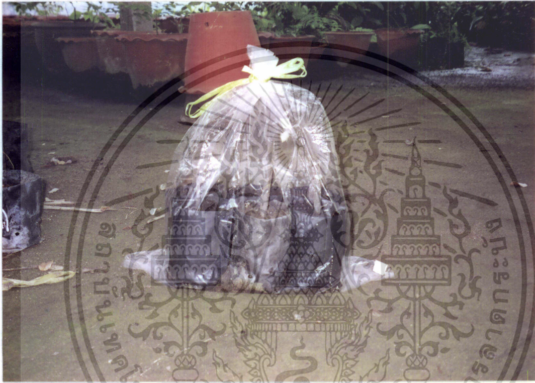
ภาพที่ 1 แสดงถุงกึ่งปักชำโมกที่บรรจุลงในถุงพลาสติกใส

เอกสารนี้เป็นเอกสารที่สงวนไว้สำหรับการใช้งานเพื่อการศึกษาเท่านั้น ไม่อนุญาตให้นำไปใช้ประโยชน์ด้านการค้า ไม่ว่าจะกรณีใดๆ ทั้งสิ้น อีกทั้งห้ามมิให้ดัดแปลงเนื้อหา และต้องอ้างอิงถึงเจ้าของเอกสารทุกครั้งที่มีการนำไปใช้