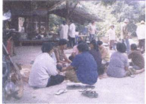
กิจกรรมเพื่อสาธารณะประโยชน์