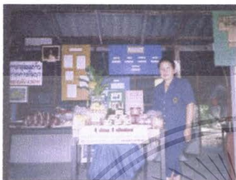
ประธานกลุ่มแม่บ้านฯ