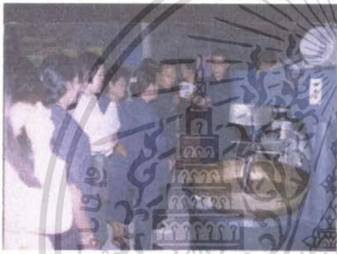
การศึกษาดูงานของกลุ่มแม่บ้านฯ