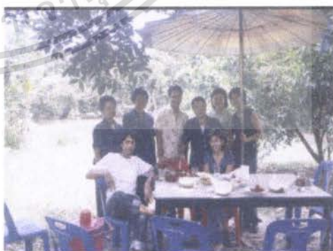
โครงการท่องเที่ยวเชิงเกษตร

เอกสารนี้เป็นเอกสารที่สงวนไว้สำหรับการใช้งานเพื่อการศึกษาเท่านั้น ไม่อนุญาตให้นำไปใช้ประโยชน์ด้านการค้า ไม่ว่ากรณีใดๆ ทั้งสิ้น อีกทั้งห้ามมิให้ตัดแปลงเนื้อหา และต้องอ้างอิงถึงเจ้าของเอกสารทุกครั้งที่มีการนำไปใช้