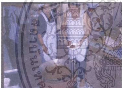
การทำแกงหมูชะมวงบรรจุกระป๋อง