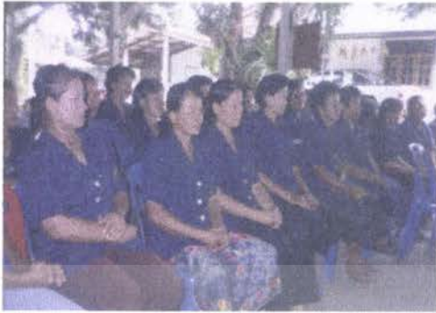
การประชุมกลุ่มแม่บ้านฯ