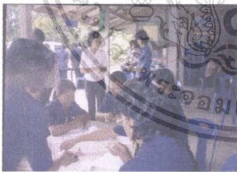
การฝึกอบรมสมาชิกกลุ่มแม่บ้านฯ