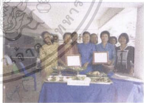
รางวัลที่กลุ่มแม่บ้านฯ ได้รับ

เอกสารนี้เป็นเอกสารที่สงวนไว้สำหรับการใช้งานเพื่อการศึกษาเท่านั้น ไม่อนุญาตให้นำไปใช้ประโยชน์ด้านการค้า ไม่ว่ากรณีใดๆ ทั้งสิ้น อีกทั้งห้ามมิให้ตัดแปลงเนื้อหา และต้องอ้างอิงถึงเจ้าของเอกสารทุกครั้งที่มีการนำไปใช้