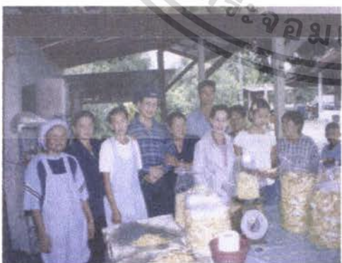
ทุเรียนทอดกรอบ