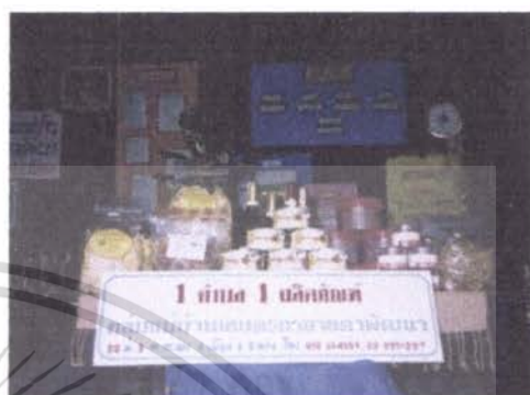
ผลิตภัณฑ์แปรรูปทางการเกษตร