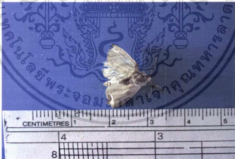
ภาพที่ 13 แสดงลักษณะตัวเต็มวัยของผีเสื้อหนอนงู้งกินใบข้าวที่ได้รับสาร Bt 60 มล./น้ำ 20 ลิตร

เอกสารนี้เป็นเอกสารที่สงวนไว้สำหรับการใช้งานเพื่อการศึกษาเท่านั้น ไม่อนุญาตให้นำไปใช้ประโยชน์ด้านการค้า ไม่ว่ากรณีใดๆ ทั้งสิ้น อีกทั้งห้ามมิให้ตัดแปลงเนื้อหา และต้องอ้างอิงถึงเจ้าของเอกสารทุกครั้งที่มีการนำไปใช้