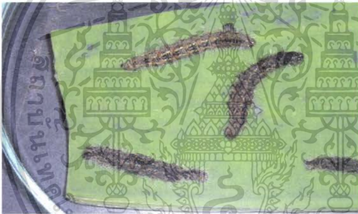
ภาพที่ 6 แสดงลักษณะการตายของหนอนบึงกินใบบัวที่ได้รับสารคลอร์ฟลูอาซอรอน