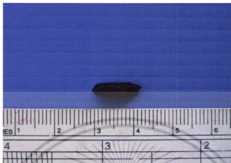
ภาพที่ 10 แสดงลักษณะดักแด้ของผีเสื้อหนอนงุ้งกินใบบัวที่ได้รับสาร Bt 40 มล./น้ำ 20 ลิตร