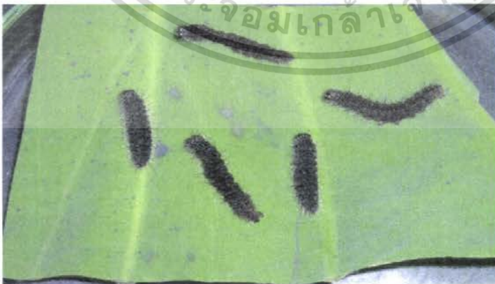
ภาพที่ 7 แสดงลักษณะการตายของหนอนบึงกินใบบัวที่ได้รับสาร Bacillus thuringiensis

เอกสารนี้เป็นเอกสารที่สงวนไว้สำหรับการใช้งานเพื่อการศึกษาเท่านั้น ไม่อนุญาตให้นำไปใช้ประโยชน์ด้านการค้า ไม่ว่าจะกรณีใดๆ ทั้งสิ้น อีกทั้งห้ามมิให้ตัดแปลงเนื้อหา และต้องอ้างอิงถึงเจ้าของเอกสารทุกครั้งที่มีการนำไปใช้