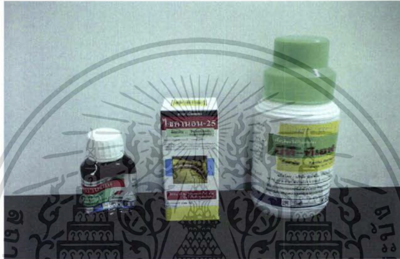
ภาพที่ 4 สารเคมีที่ใช้ในการทดลอง

การตรวจนับอัตราการตายของหนอนบุ้งกินใบบัว เนื่องจาก Bt คลอร์ฟลูอาซุรอน 5%EC ไชเปอร์เมธริน 35%EC (ภาพที่4) และจากตารางที่ 1 พบว่าในการทดลองครั้งที่ 1 สำหรับหนอน