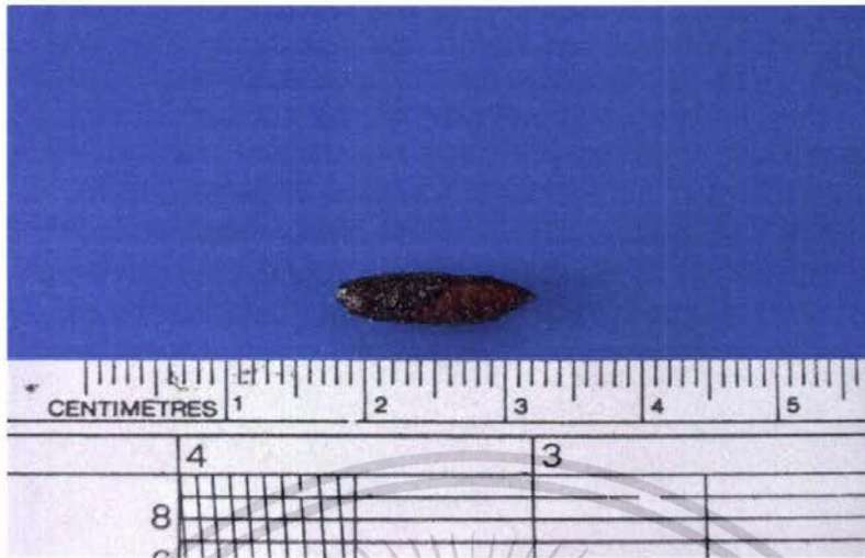
ภาพที่ 12 แสดงลักษณะดักแด้ของผีเสื้อหนอนงู้งกินใบข้าวที่ได้รับสาร Bt 60 มล./น้ำ 20 ลิตร