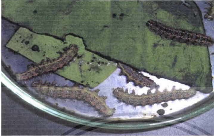
ภาพที่ 5 แสดงลักษณะการตายของหนอนบึงกินใบบัวที่ได้รับสารไซเปอร์เมทริน