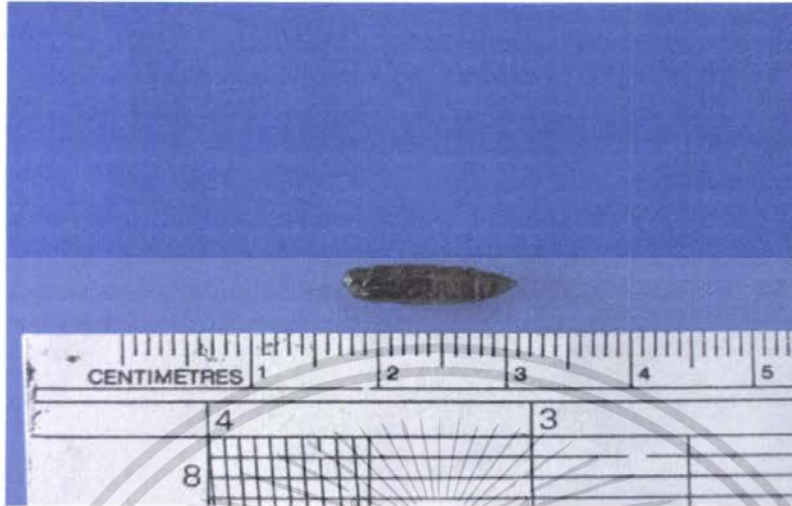
ภาพที่ 8 แสดงลักษณะดักแด้ของผีเสื้อหนอนงับกินใบบัวที่ได้รับสารคลอร์ฟลูอาซอรอน