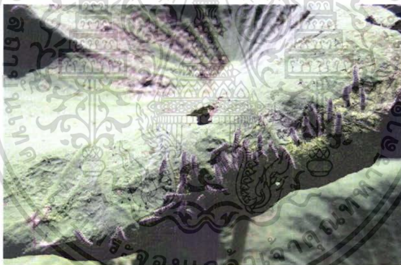
ภาพที่ 1 หนอนวัยที่ 3 ของผีเสื้อหนอนบู่กินบัวที่เข้าทำลายใบบัวเป็นกลุ่ม

เรื่อย ๆ จนกระทั่งหยุดกิน เพื่อเตรียมตัวเข้าดักแด้ ตั้งแต่วัย 1 ถึงวัย 5 ของหนอนบู่กินบัวใช้เวลาประมาณ 20 - 22 วัน เมื่อหนอนหยุดกินก็เริ่มหาที่สำหรับเข้าดักแด้ หนอนจะเข้าดักแด้บริเวณก้านของใบบัว หรืออาจเป็นที่ริมใบที่ไหล่พื้นน้ำเท่านั้น เมื่อได้ที่ที่เหมาะสมหนอนจะเริ่มหดตัวให้สั้นลงจนไม่สามารถเคลื่อนที่ได้ หนอนจะกัดทะาะใบบัวให้เป็นชิ้นเล็ก ๆ ใช้ในการห่อหุ้มตัวเพื่อให้ปลอดภัย แล้วจึงกลายเป็นดักแด้ที่สมบูรณ์ เมื่อเวลาผ่านไป 7 - 8 วันแล้วแต่สภาพแวดล้อม ตัวเต็มวัยจึงออกจากดักแด้ ตัวเต็มวัยหลังออกจากดักแด้ประมาณ 2 - 3 วัน จึงเริ่มผสมพันธุ์และวางไข่ หลังจากผสมพันธุ์ได้ไม่นาน เพศเมียจะสามารถวางไข่ได้ ตัวเต็มวัยจะทำกิจกรรมทุกอย่างในเวลากลางวันเท่านั้น ในเวลากลางวันจะเกาะนิ่งอยู่กับที่ ไม่เคลื่อนไหว ตัวเต็มวัยในธรรมชาติอาจมีอายุได้ถึง 7 - 8 วัน จึงตาย วงจรชีวิตทั้งหมดประมาณ 1 เดือน พบแมลงศัตรูธรรมชาติคือ แมลงวันก้นขน ( Winthemia sp.) จัดเป็นแมลงเบียน (parasitoids) ตัวเมียจะวางไข่ลงในที่ตัวหนอนผีเสื้อ เมื่อไข่ฟักเป็นหนอนจะกัดกินภายในเหยื่อ (ธรรมทิพย์, 2545)