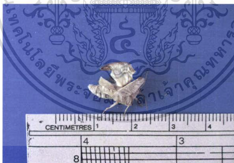
ภาพที่ 11 แสดงลักษณะตัวเต็มวัยของผีเสื้อหนอนงุ้งกินใบบัวที่ได้รับสาร Bt 40 มล./น้ำ 20 ลิตร

เอกสารนี้เป็นเอกสารที่สงวนไว้สำหรับการใช้งานเพื่อการศึกษาเท่านั้น ไม่อนุญาตให้นำไปใช้ประโยชน์ด้านการค้า ไม่ว่าจะกรณีใดๆ ทั้งสิ้น อีกทั้งห้ามมิให้ตัดแปลงเนื้อหา และต้องอ้างอิงถึงเจ้าของเอกสารทุกครั้งที่มีการนำไปใช้