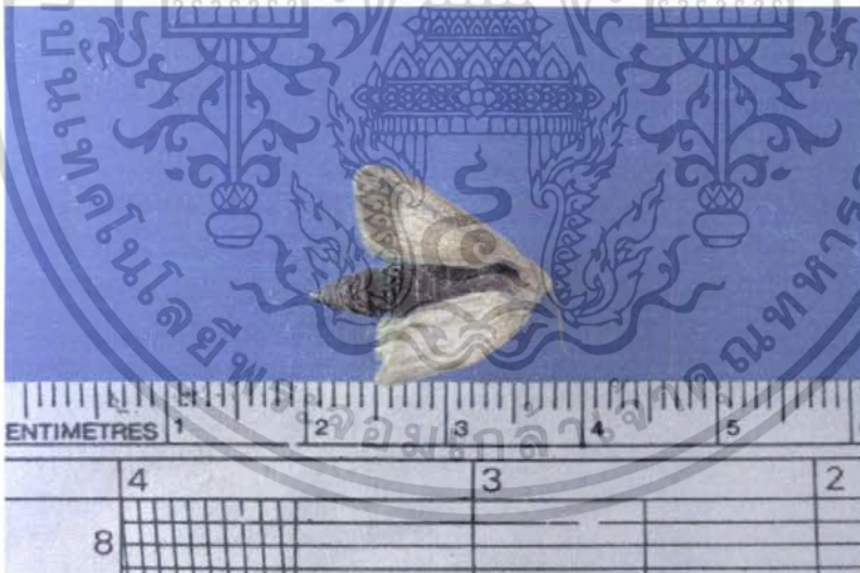
ภาพที่ 9 แสดงลักษณะตัวเต็มวัยของผีเสื้อหนอนงับกินใบบัวที่ได้รับสารคลอร์ฟลูอาซอรอน

เอกสารนี้เป็นเอกสารที่สงวนไว้สำหรับการใช้งานเพื่อการศึกษาเท่านั้น ไม่อนุญาตให้นำไปใช้ประโยชน์ด้านการค้า ไม่ว่าจะกรณีใดๆ ทั้งสิ้น อีกทั้งห้ามมิให้ตัดแปลงเนื้อหา และต้องอ้างอิงถึงเจ้าของเอกสารทุกครั้งที่มีการนำไปใช้