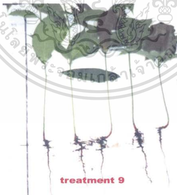
ภาพที่ 10 ลักษณะของต้นกล้าที่ได้จากการเพาะด้วยวิธีการ ตัดเปลือกเมล็ดและวางเมล็ดแบบเอาท้องลง

เอกสารนี้เป็นเอกสารที่สงวนไว้สำหรับการใช้งานเพื่อการศึกษาเท่านั้น ไม่อนุญาตให้นำไปใช้ประโยชน์ด้านการค้า ไม่ว่าจะกรณีใดๆ ทั้งสิ้น อีกทั้งห้ามมิให้คัดแปลงเนื้อหา และต้องอ้างอิงถึงเจ้าของเอกสารทุกครั้งที่มีการนำไปใช้