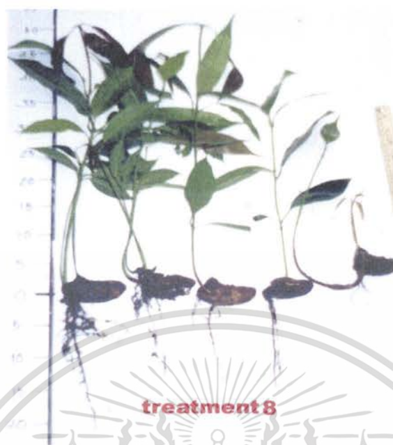
ภาพที่ 9 ลักษณะของต้นกล้าที่ได้จากการเพาะด้วยวิธีการ ตัดเปลือกเมล็ดและวางเมล็ดแบบเอาท้องขึ้น