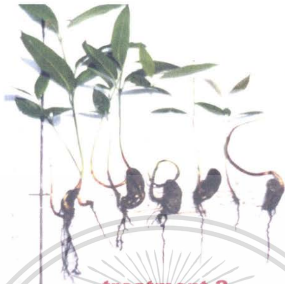
ภาพที่ 3 ลักษณะของต้นกล้าที่ได้จากการเพาะด้วยวิธีการ ไม่ตัดเปลือกเมล็ดและวางเมล็ดแบบเอาหัวลง