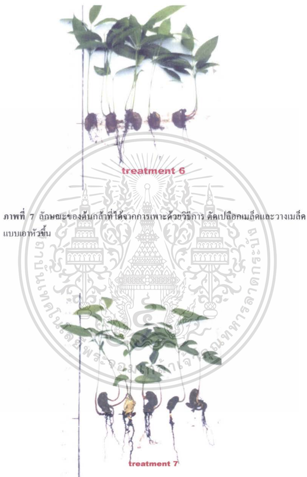
ภาพที่ 7 ลักษณะของต้นกล้าที่ได้จากการเพาะด้วยวิธีการ ตัดเปลือกเมล็ดและวางเมล็ดแบบเอาหัวขึ้น