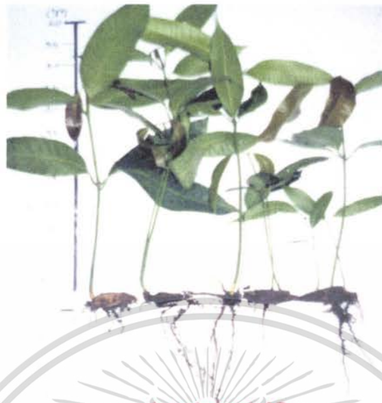
ภาพที่ 11 ลักษณะของต้นกล้าที่ได้จากการเพาะด้วยวิธีการ ตัดเปลือกเมล็ดและวางเมล็ดแบบเอาด้านแบนลง

เอกสารนี้เป็นเอกสารที่สงวนไว้สำหรับการใช้งานเพื่อการศึกษาเท่านั้น ไม่อนุญาตให้นำไปใช้ประโยชน์ด้านการค้า ไม่ว่าจะกรณีใดๆ ทั้งสิ้น อีกทั้งห้ามมิให้ตัดแปลงเนื้อหา และต้องอ้างอิงถึงเจ้าของเอกสารทุกครั้งที่มีการนำไปใช้