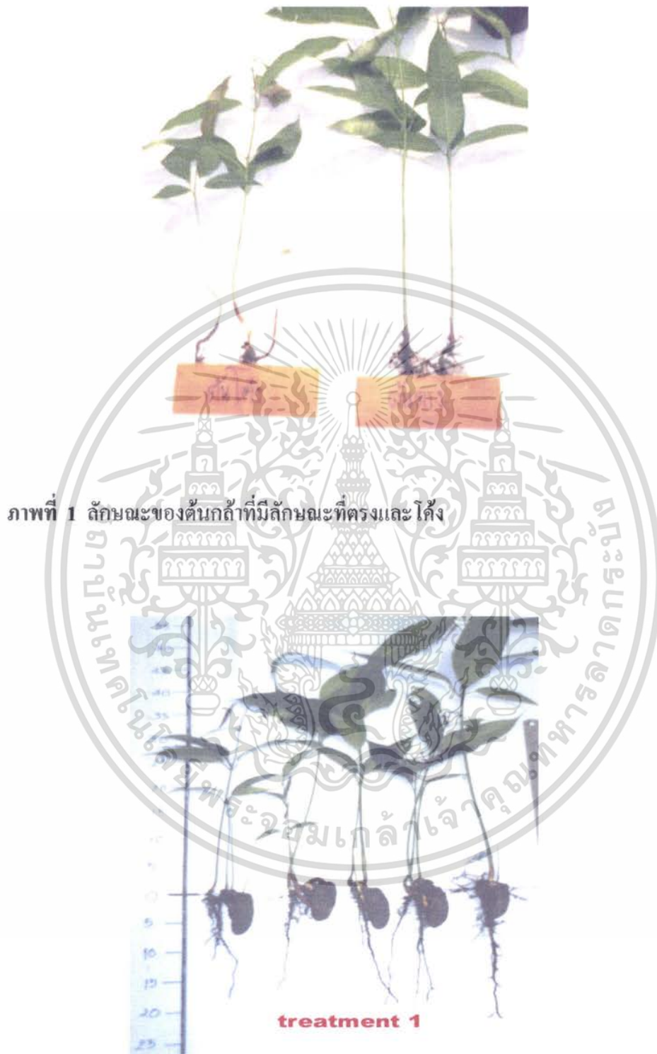
ภาพที่ 2 ลักษณะของต้นกล้าที่ได้จากการเพาะด้วยวิธีการไม่ตัดเปลือกเมล็ดและวางเมล็ด