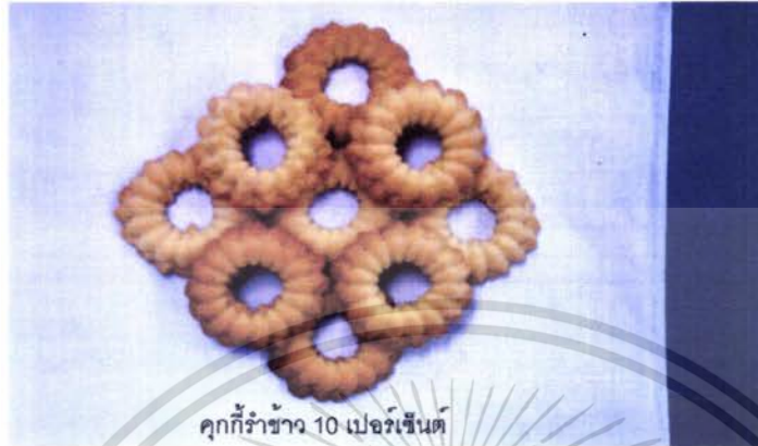
ภาพที่ 3 แสดงลักษณะทางกายภาพของคูกี้ข้าว 10 เปอร์เซ็นต์

เอกสารนี้เป็นเอกสารที่สงวนไว้สำหรับการใช้งานเพื่อการศึกษาเท่านั้น ไม่อนุญาตให้นำไปใช้ประโยชน์ด้านการค้า ไม่ว่าจะกรณีใดๆ ทั้งสิ้น อีกทั้งห้ามมิให้ตัดแปลงเนื้อหา และต้องอ้างอิงถึงเจ้าของเอกสารทุกครั้งที่มีการนำไปใช้