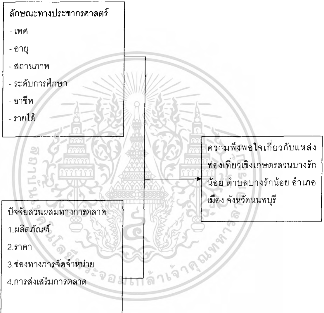
ภาพที่ 1 กรอบแนวความคิดในการศึกษา

เอกสารนี้เป็นเอกสารที่สงวนไว้สำหรับการใช้งานเพื่อการศึกษาเท่านั้น ไม่อนุญาตให้นำไปใช้ประโยชน์ด้านการค้าไม่ว่ากรณีใดๆ ทั้งสิ้น อีกทั้งห้ามมิให้ดัดแปลงเนื้อหา และต้องอ้างอิงถึงเจ้าของเอกสารทุกครั้งที่มีการนำไปใช้