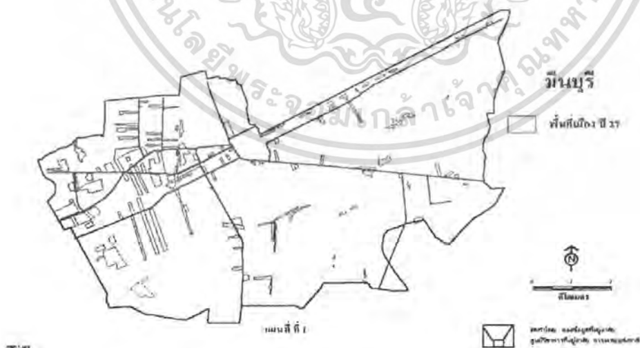
ภาพที่ 1(แผนที่แสดงพื้นที่เมือง เขตมินบุรี ปี 2527)

การขยายตัวของเมือง ทิศทางและแนวโน้มการเติบโตของเมือง