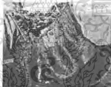
การเลี้ยงหอยเป่าอื้อในถูงแบบแขวน

การเลี้ยงลักษณะนี้จะใช้หอยขนาด 10-15 มิลลิเมตร ใส่ในตะกร้าตาถี่และให้อาหารสาหร่ายสดหรืออาหารสำเร็จรูปลงในตะกร้า ใช้เวลาการเลี้ยงประมาณ 1 ปี ถึง 1 ปีครึ่ง หอยจะมีขนาด 4-5 เซนติเมตร ซึ่งเป็นขนาดที่ตลาดภายในประเทศและต่างประเทศต้องการ