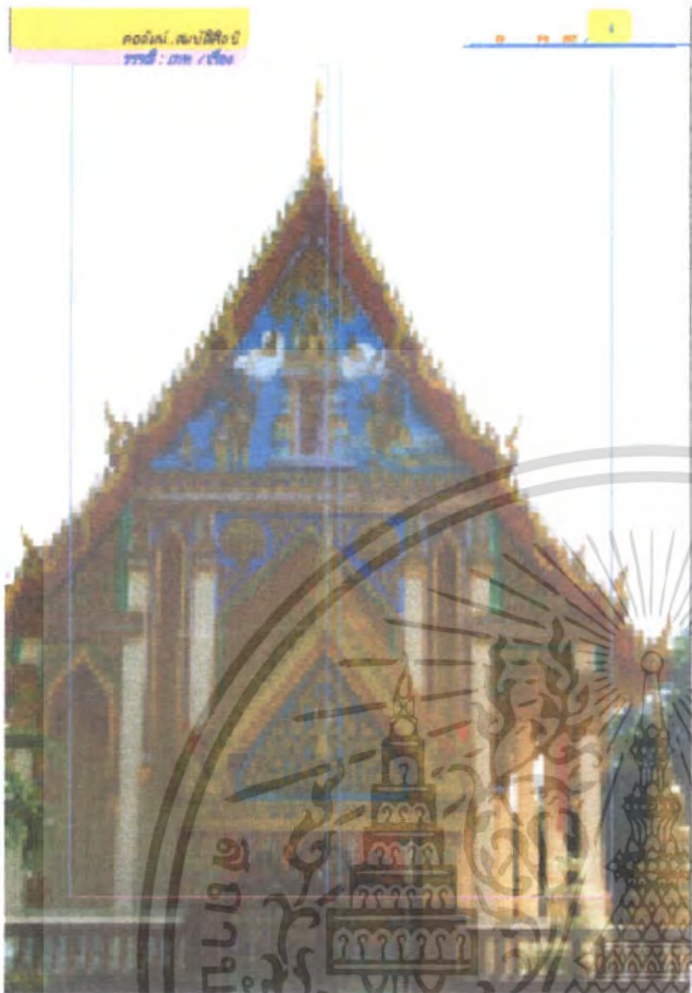
พระที่นั่งสุทไธสวรรย์ปราสาท พ.ศ. ๒๓๗๖