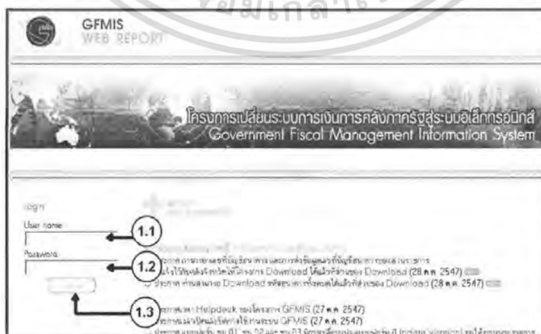
ภาพที่ 7 การเชื่อมต่อเข้าสู่ Web Report เพื่อปฏิบัติงานในระบบ GFMIS

เอกสารนี้เป็นเอกสารที่สงวนไว้สำหรับการใช้งานเพื่อการศึกษาเท่านั้น ไม่อนุญาตให้นำไปใช้ประโยชน์ด้านการค้า ที่มา http://gfmistrport.myghmis.com ไม่ว่ากรณีใดๆ ทั้งสิ้น อีกทั้งยังมีให้ตัดแปลงเนื้อหา และต้องอ้างอิงถึงเจ้าของเอกสารทุกครั้งที่มีการนำไปใช้