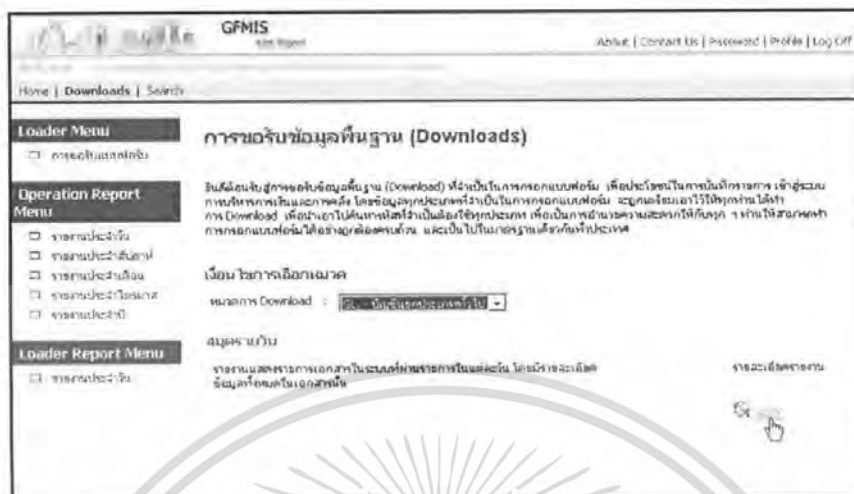
ภาพที่ 6 แสดงการขอรับข้อมูลพื้นฐาน