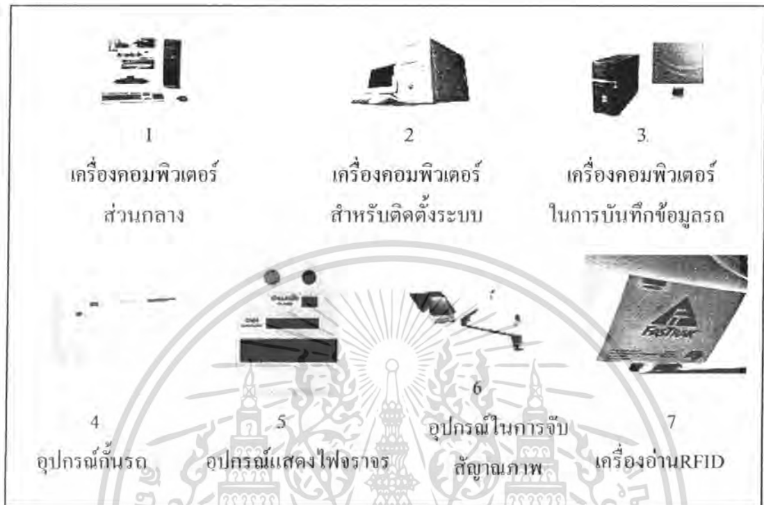
1 เครื่องคอมพิวเตอร์ ส่วนกลาง