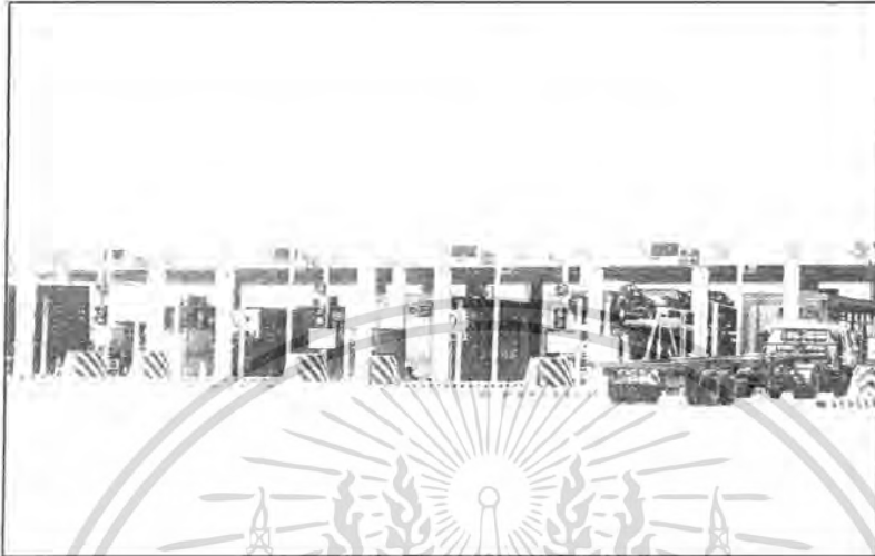
ภาพที่ 2 ค่านักเก็บค่าผ่านทางท่าเรือ