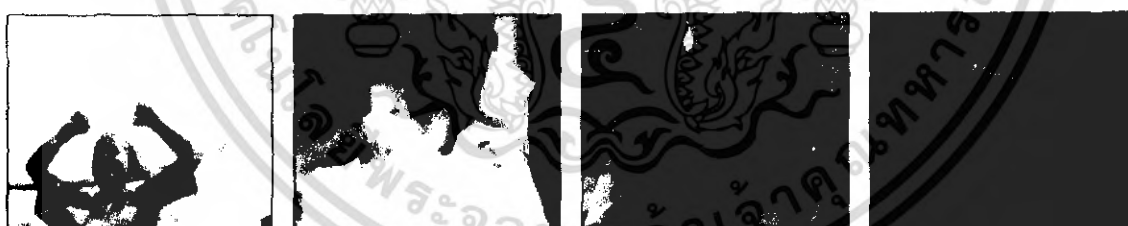
6.4.2 ภาพ แสดงการทำเทคนิคซ้อนภาพ

ตัวอย่างแสดงให้เห็นถึงการซ้อนภาพเพื่อสื่อความหมายบางอย่างให้เนื้อเรื่อง เช่นภาพ ลิซอ ดีใจในการแข่งขันฟุตบอลซ้อนเข้ากับรูปธงชาติไทย , ภาพลิซอนอนในสนามฟุตบอลซ้อนเข้ากับภาพลิซอดูความยิ่งใหญ่ของสนาม , ภาพลิซอและพ่อซ้อนกับเส้นทางถนนให้ความหมายในการเดินทาง , ภาพสุดท้ายแสดงความหมายสิ้นหวัง หดหู่ ลิซอเหลือแต่ตัวเพราะต้องเร่งร้อนแถวสนามกีฬา ภาพแสดงการซ้อนเท้าอันเปลือยเปล่าของลิซอกับใบหน้าที่เหม่อลอยไร้จุดหมาย