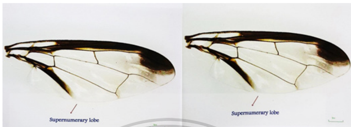
Figure 2 The wing venation of female (left) and male (right).