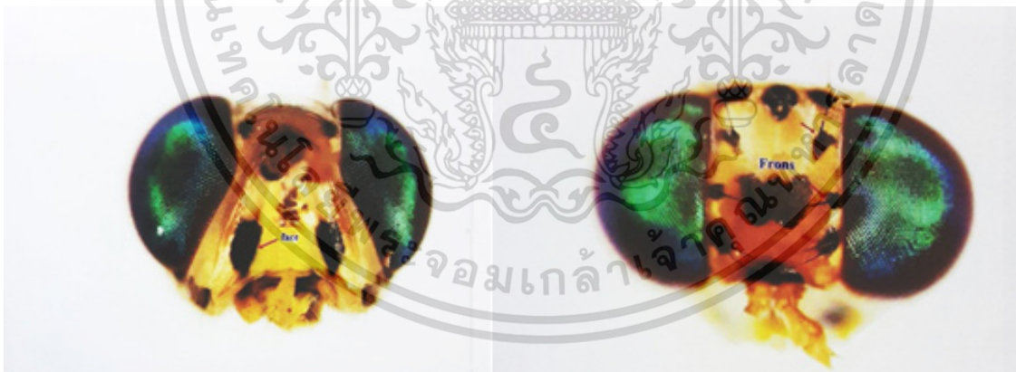
Figure 1 The face and frons showing a large dark spot in each antennal furrow.