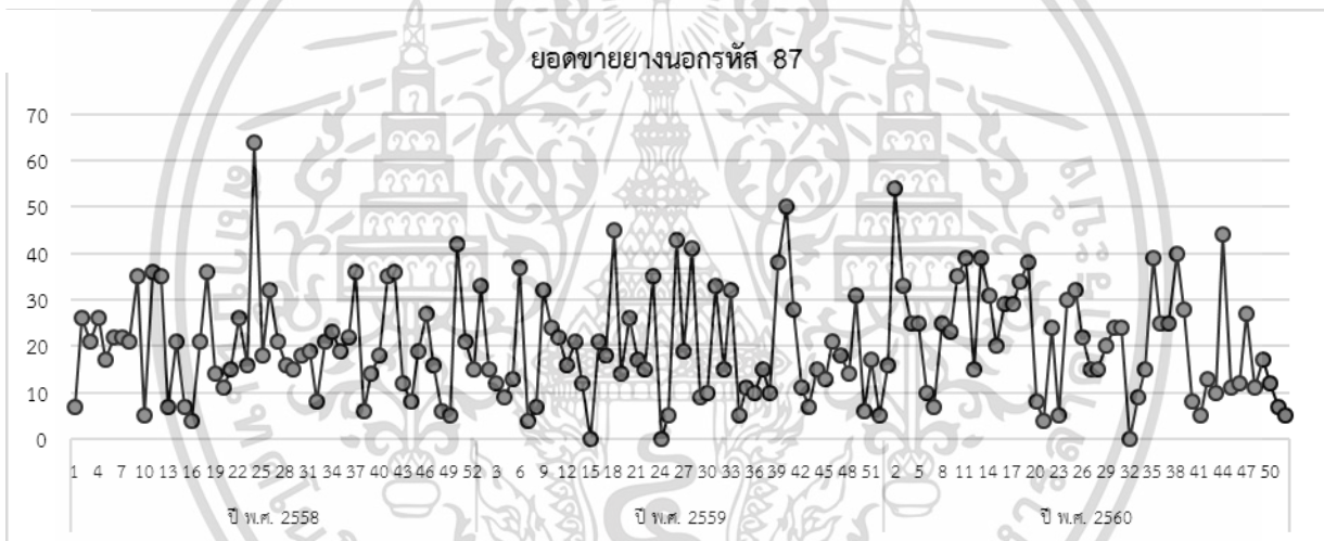
รูปที่ 3 กราฟแสดงยอดขายยางนอกรหัส 87 I1 60/80-17 จำนวน 156 สัปดาห์