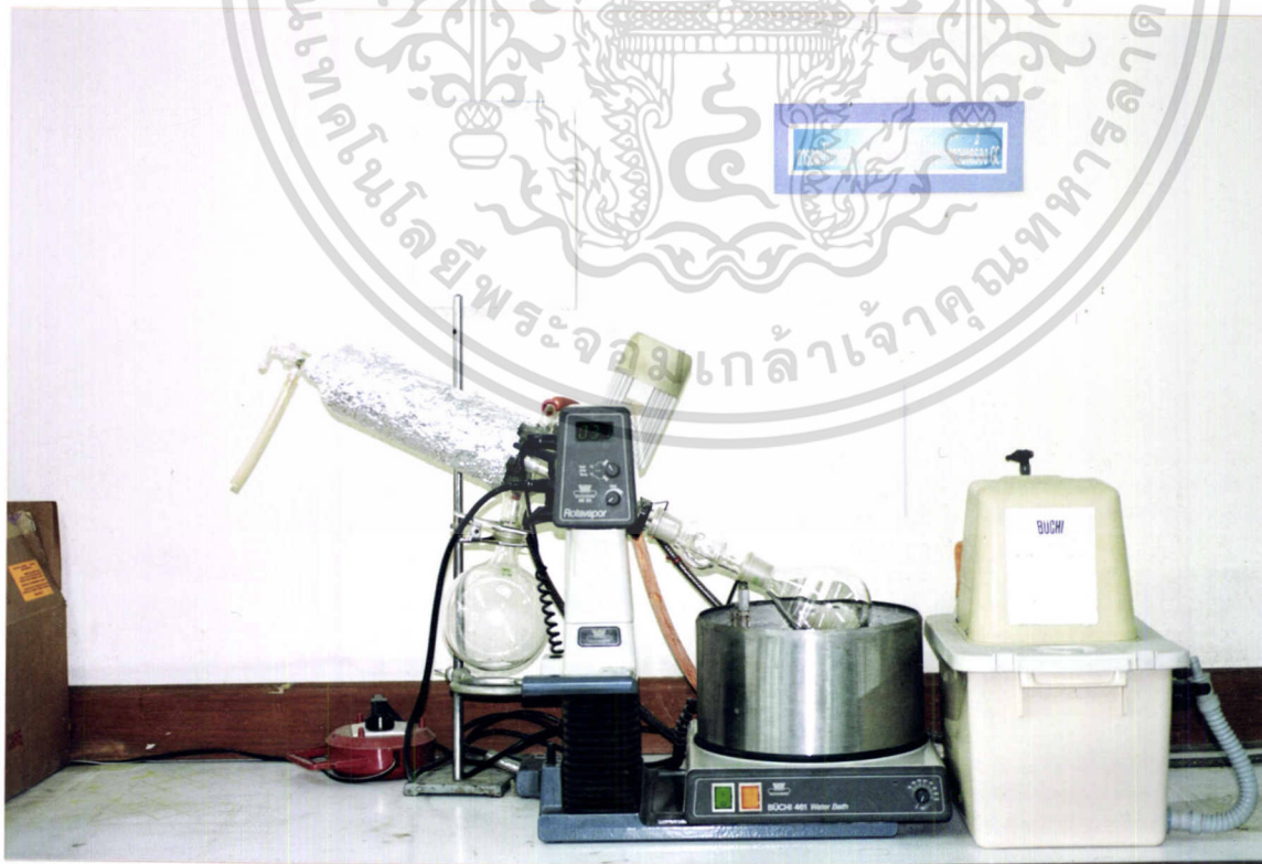
ภาพที่ 2 เครื่องมือที่ใช้ในการลดปริมาณสารสกัดจากพืชสมุนไพร (Rotary evaporator)

เอกสารนี้เป็นเอกสารที่สงวนไว้สำหรับการใช้งานเพื่อการศึกษาเท่านั้น เมื่ออนุญาตให้เผยแพร่ไปยังหน่วยงานอื่นโดยไม่ได้รับอนุญาต ไม่ว่าจะกรณีใดๆ ทั้งสิ้น อีกทั้งห้ามมิให้ตัดแปลงเนื้อหา และต้องอ้างอิงถึงเจ้าของเอกสารทุกครั้งที่มีการนำไปใช้