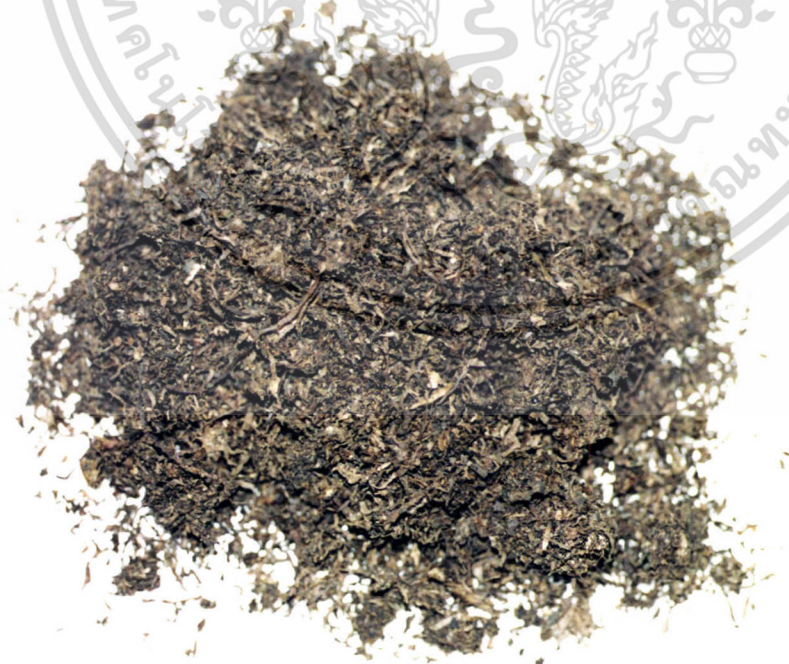
ภาพที่ 4 ใบยาสูบ ( Nicotiana tabacum Linn. : F. Solanaceae)

เอกสารนี้เป็นเอกสารที่สงวนไว้สำหรับการใช้งานเพื่อการศึกษาเท่านั้น ไม่อนุญาตให้นำไปใช้ประโยชน์ด้านการค้า ไม่ว่ากรณีใดๆ ทั้งสิ้น อีกทั้งห้ามมิให้ตัดแปลงเนื้อหา และต้องอ้างอิงถึงเจ้าของเอกสารทุกครั้งที่มีการนำไปใช้