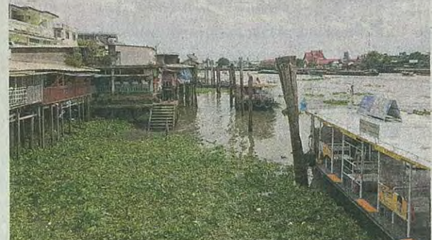
โครงการฯเชื่อว่าปรับทัศนียภาพและทำให้คนเข้าถึงแม่น้ำอย่างเท่าเทียม ส่วนกลุ่มค้านห่วงขยะและมักตบชวาคัดค้านได้โครงสร้างสถาปัตยกรรม