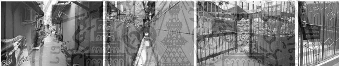
การแสดงผลเอกลักษณ์ส่วนบุคคล

อยู่ร่วมกันของกลุ่มต่างๆ ในชุมชน และหากเกิดปัญหายังมีการช่วยเหลือกันจากบทบาท-สถานะที่มีในชุมชน นับว่าลักษณะดังกล่าวสอดคล้องกับกลไกบทบาท-สถานภาพในแนวคิดควบคุมสังคม นอกจากนี้ในกลุ่มคนดั้งเดิมซึ่งส่วนใหญ่ที่เป็นผู้ให้เช่าที่อยู่อาศัยยังมีการทำสัญญาหรือข้อตกลงร่วมกันกับคนดั้งเดิมซึ่งส่วนใหญ่ที่เป็นผู้ให้เช่าที่อยู่อาศัย ในการอยู่อาศัยร่วมกันที่มีความสำคัญช่วยลดความขัดแย้งในการอยู่ร่วมกันของกลุ่มคนดั้งเดิมและกลุ่มแรงงานย้ายถิ่น อันสะท้อนได้ถึงกลไกการต่อรองที่มีค่าสัญญาหรือข้อตกลงที่มีผลประโยชน์บรรลุตามความต้องการของทั้งสองกลุ่ม นั่นคือ คนดั้งเดิมจะได้รายได้จากการเช่าอยู่ของแรงงานย้ายถิ่น ส่วนแรงงานย้ายถิ่นจะได้สิทธิในการเช่าที่อยู่อาศัยในชุมชน สอดคล้องกับความเห็นของคนดั้งเดิมในชุมชนมัสยิดบ้านตึกดินที่มีบทบาท-สถานะเป็นผู้ให้เช่าที่อยู่อาศัยรายหนึ่งที่ว่า มีการตั้งข้อตกลงกับคนเมียนมาร์ ที่มาเช่าอยู่อาศัยในเรื่องห้ามส่งเสียงดัง โวยวาย ซึ่งได้รับความร่วมมือเป็นอย่างดี (ธารา [นามสมมุติ], สัมภาษณ์, 2557) ในขณะเดียวกันความเห็นของผู้เช่าห้องพักอยู่ในชุมชนมัสยิดบ้านตึกดิน อายุ 30 ปี กล่าวว่า มีความพึงพอใจในการอยู่อาศัยในชุมชนเนื่องจากใกล้ที่ทำงาน รวมถึงมีความคุ้นชินและมีความรู้สึกปลอดภัยดี ตลอดจนมีความยินดีที่จะปฏิบัติตามเงื่อนไขที่มีอยู่ในที่พักและชุมชน (ธานี [นามสมมุติ], สัมภาษณ์, 2557) นอกจากนี้ยังพบลักษณะกายภาพที่มีความสอดคล้องกับกลไกการควบคุมเชิงรับในแนวคิดการครอบครองอาณาเขต ที่มีลักษณะวิธีการต่างๆ ได้แก่ การแสดงเอกลักษณ์ส่วนบุคคล การป้องกันการล่วงล้ำด้วยการสร้างรั้ว และการแสดงป้ายบอกการล่วงล้ำ