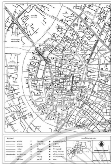
แผนที่เขตพระนคร