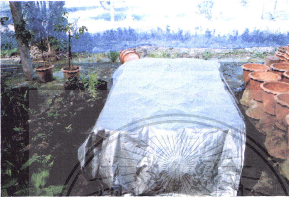
ภาพที่ 1 การใช้ผ้าพลาสติกคลุมกระถางเพื่อป้องกันไม่ให้ถั่วงอกถูกแสงแดด