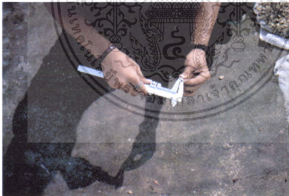
ภาพที่ 4 การวัดเส้นผ่าศูนย์กลาง hypocotyl ของถั่วงอกด้วยเวอร์เนีย

เอกสารนี้เป็นเอกสารที่สงวนไว้สำหรับการใช้งานเพื่อการศึกษาเท่านั้น ไม่อนุญาตให้นำไปใช้ประโยชน์ด้านการค้า ไม่ว่ากรณีใดๆ ทั้งสิ้น อีกทั้งห้ามมิให้ดัดแปลงเนื้อหา และต้องอ้างอิงถึงเจ้าของเอกสารทุกครั้งที่มีการนำไปใช้