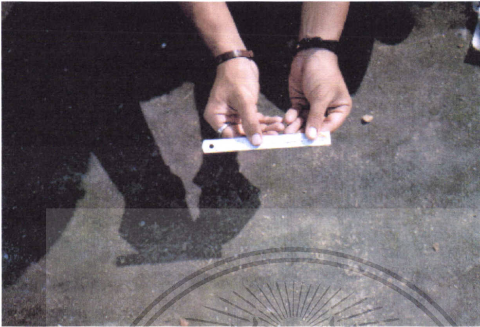
ภาพที่ 3 การวัดความยาว hypocotyl ของถั่วงอกด้วยไม้บรรทัด