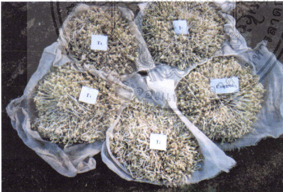
ภาพที่ 2 เปรียบเทียบสภาพของถั่วงอกในแต่ละวิธี

เอกสารนี้เป็นเอกสารที่สงวนไว้สำหรับการใช้งานเพื่อการศึกษาเท่านั้น ไม่อนุญาตให้นำไปใช้ประโยชน์ด้านการค้า ไม่ว่ากรณีใดๆ ทั้งสิ้น อีกทั้งห้ามมิให้ดัดแปลงเนื้อหา และต้องอ้างอิงถึงเจ้าของเอกสารทุกครั้งที่มีการนำไปใช้