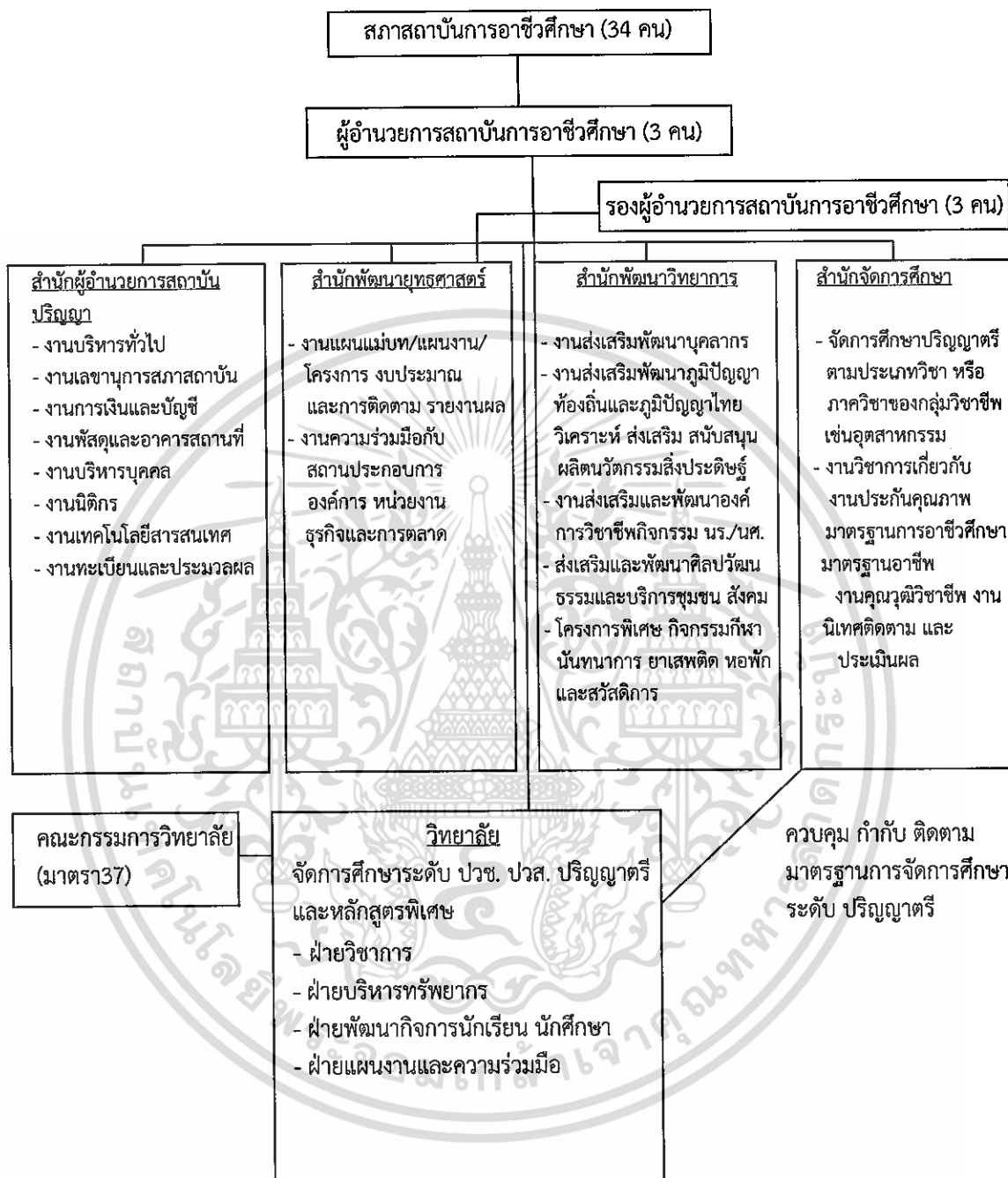
ภาพที่ 2.2 โครงสร้างการบริหารสถาบันการอาชีวศึกษา

เอกสารนี้เป็นเอกสารที่สงวนไว้สำหรับการใช้งานเพื่อการศึกษาเท่านั้น ไม่อนุญาตให้นำไปใช้ประโยชน์ด้านการค้า ไม่ว่าจะกรณีใดๆ ทั้งสิ้น อีกทั้งห้ามมิให้ดัดแปลงเนื้อหา และต้องอ้างอิงถึงเจ้าของเอกสารทุกครั้งที่มีการนำไปใช้