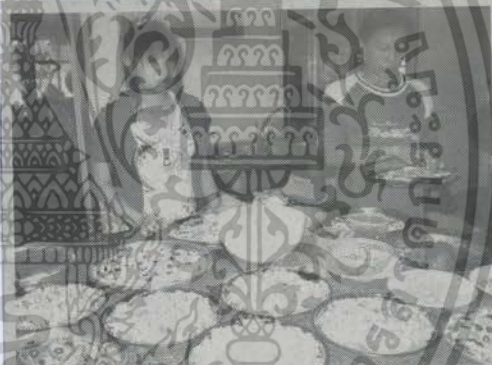
ผลิตภัณฑ์แปรรูปจากน้ำนมกระบือ

ปัจจุบัน เผยต่อว่า ปัจจุบันมีแม่กระบือที่วัดนมได้ อยู่ประมาณ 30 ตัว เฉลี่ยวันละ 300 กิโลกรัม ซึ่งร้อยละ 20 ของน้ำนมดิบที่ได้แต่ละวันก็จะนำมาแปรรูป เป็นน้ำนมกระป๋องสด ผ่านกระบวนการพาสเจอร์ไรซ์ ส่วนที่เหลือก็จะนำไปผลิตเป็นชีส หรือผลิตภัณฑ์ เนยแข็งมอสซาเรลลาจากน้ำนมกระบือส่งร้านอาหาร อิตาลีเลียนมูร์ร่าห์เฮาส์ ถ.รามคำแหง ซ.112 (ปากทาง เข้าหมู่บ้านสัมมากร) ซึ่งเป็นร้านสาขาของฟาร์ม นอกจากนี้ยังส่งฟู้ดแลนด์ บริษัทการบินไทย และโรงแรม ต่างๆ อาทิ โรงแรมเซอราตัน หัวหิน โรงแรมบันยันทรี ภูเก็ต และภัตตาคารชื่อดังอีกหลายแห่ง