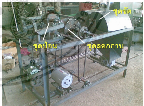
รูปที่ 4 เครื่องเตรียมท่อนอ้อยสำหรับคั้นน้ำที่เสร็จสมบูรณ์

เมื่อดำเนินการสร้างเสร็จแล้วดังรูปที่ 4 ได้ทำการทดสอบใช้งานเบื้องต้น พบว่า ใบมีดตรงจะทำให้อ้อยหักระหว่างลอกกาบ ส่วนใบมีดโค้ง จะจิกเข้าไปในเนื้ออ้อย ทำให้เครื่องหยุดทำงาน [8] จึงได้ทำการปรับเหลือแต่แบบใบมีดโค้งและลดจำนวนใบมีดลงเหลือจานละสองใบ