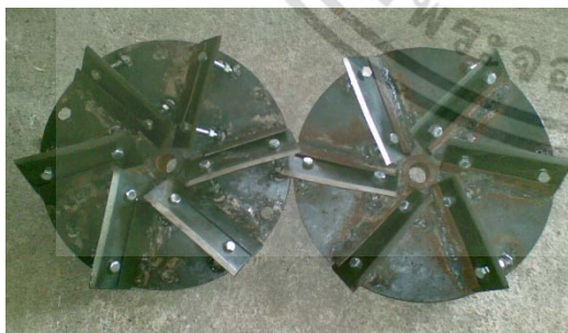
รูปที่ 2 ใบมีดตรง

ใบมีดลอกกาบมี 2 แบบ คือ (1) ใบมีดตรง ประกอบด้วยใบมีด จำนวน 6 อัน ติดอยู่บนแผ่นเหล็กกลม ขนาดเส้นผ่านศูนย์กลาง 255 มม.หนา 5 มม. ดังรูปที่ 2 ใช้สกรูยึดระหว่างใบมีดและแผ่นเหล็กกลม เพื่อปรับลักษณะการทำงานของใบมีดให้มีประสิทธิภาพที่ดีขึ้น สามารถใช้งานได้กับท่อนอ้อยทุกขนาด ซึ่งมีขนาดเส้นผ่านศูนย์กลางของท่อนอ้อยไม่เท่ากัน (2) ใบมีดโค้ง ประกอบด้วย ใบมีดคดขอจำนวน 4 เล่ม ติดกับเหล็กกลม ขนาดเดียวกับใบมีดตรง ใบมีดโค้งทำมุมกับเหล็กกลม 35^{\circ} ดังรูปที่ 3 ซึ่งงานใบมีดทั้ง 2 แบบจะสวมอยู่บนเพลลา ขนาดเส้นผ่านศูนย์กลาง 19.05 มม. บริเวณคุมของแผ่นเหล็กกลมจะมีสปริงติดอยู่ ซึ่งสปริงนี้จะสวมอยู่บนเพลลา เพื่อควบคุมการเคลื่อนที่ของชุดลอกกาบตามแนวแกนเพลลา