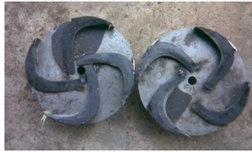
รูปที่ 3 ใบมีดโค้ง

ระบบการส่งกำลังของชุดลอกกาบ ใช้มอเตอร์ขนาด \frac{1}{2} แรงม้า 1 ตัว ใช้ล้อยางพาน 2 นิ้ว 2 ร่อง ต่อจากมอเตอร์ โดยร่องที่ 1 ใช้กับชุดป้อนต่อสายพานจากมอเตอร์ มาสู่ตัวเกียร์ทด อัตราทด 1:10 เพื่อลดความเร็วรอบจาก 1440 รอบต่อนาที เป็น 144 รอบต่อนาที จากนั้นก็ต่อเฟืองคอกจอกกับทางออกของตัวเกียร์ทด เพื่อเปลี่ยนทิศทางการทำงานของสายพานให้มีทิศทางเดียวกับชุดป้อน และร่องที่ 2 ของล้อยางพานจากมอเตอร์ต่อสายพานไปยังล้อยางพานของชุดลอกกาบ