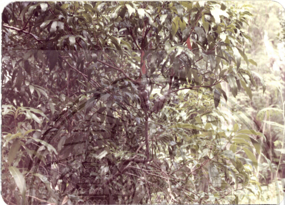
ภาพที่ 1 แสดงกิ่งก้านต้น

เอกสารนี้เป็นเอกสารที่สงวนไว้สำหรับการใช้งานเพื่อการศึกษาเท่านั้น ไม่อนุญาตให้นำไปใช้ประโยชน์ด้านการค้า ไม่ว่ากรณีใดๆ ทั้งสิ้น อีกทั้งห้ามมิให้ดัดแปลงเนื้อหา และต้องอ้างอิงถึงเจ้าของเอกสารทุกครั้งที่มีการนำไปใช้