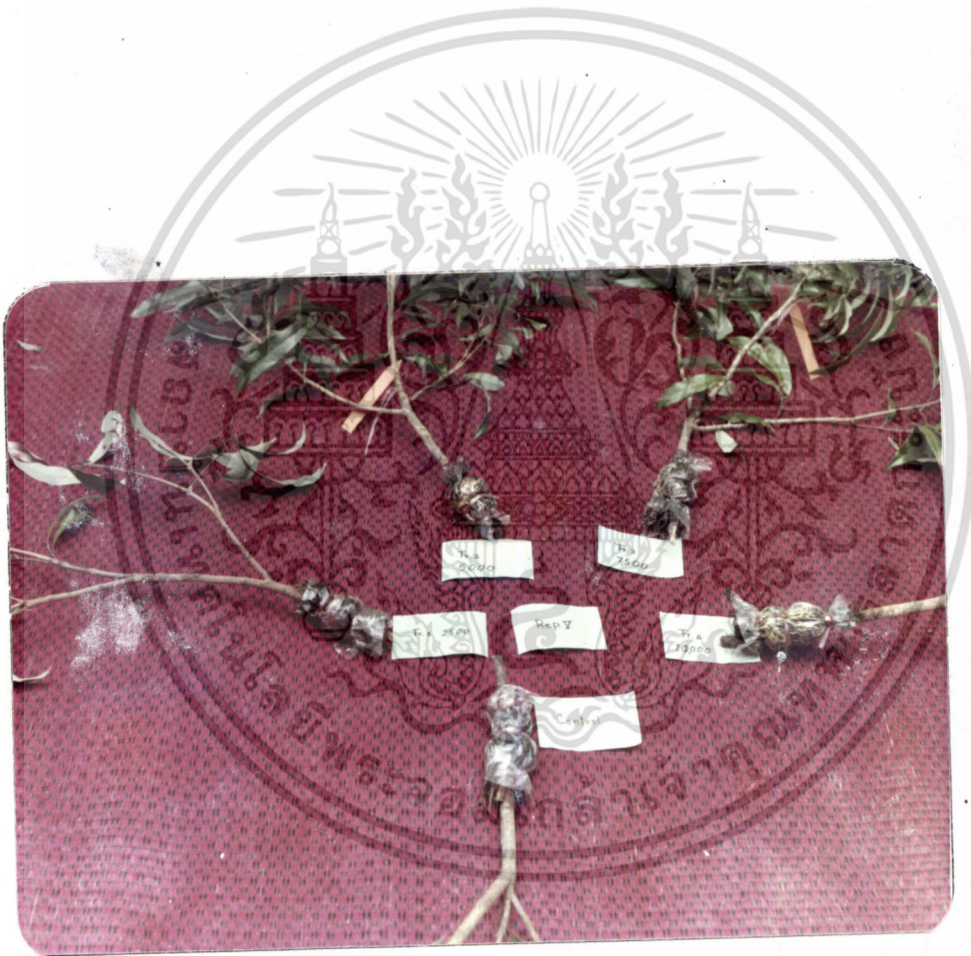
ภาพที่ 6 แสดงกิ่งตอนต้นจี ใน Rep. ที่ 5 ซึ่ง treat ด้วยฮอร์โมน IBA เอกสารนี้เป็นเอกสารที่สงวนไว้สำหรับการศึกษาเท่านั้น ไม่อนุญาตให้นำไปใช้ประโยชน์ด้านการค้า ที่มีความแตกต่างกัน ไม่ว่ากรณีใดๆ ทั้งสิ้น อีกทั้งห้ามมิให้ดัดแปลงเนื้อหา และต้องอ้างอิงถึงเจ้าของเอกสารทุกครั้งที่มีการนำไปใช้