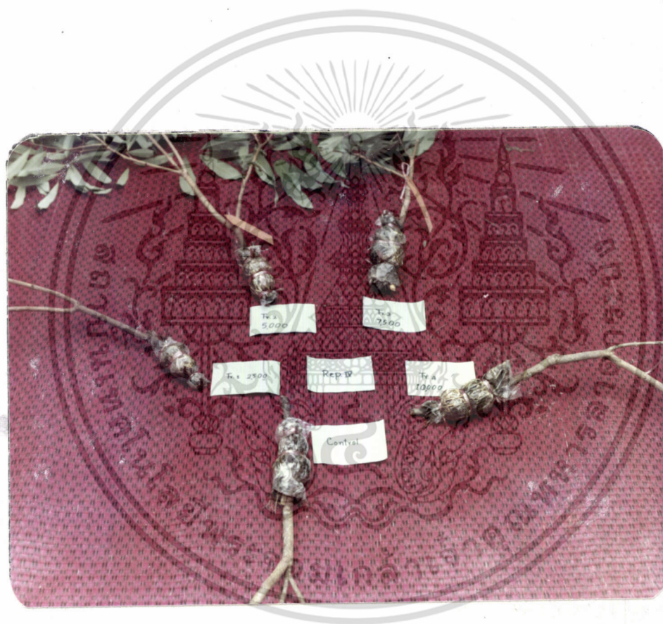
ภาพที่ 5 แสดงกิ่งทอนดินจิ ใน Rep. ที่ 4 ซึ่ง treat ด้วยสารโมนีบา ที่มีความเข้มข้นต่างกัน

เอกสารนี้เป็นเอกสารที่สงวนไว้สำหรับการใช้งานเพื่อการศึกษาเท่านั้น ไม่อนุญาตให้นำไปใช้ประโยชน์ด้านการค้า ไม่ว่ากรณีใดๆ ทั้งสิ้น อีกทั้งห้ามมิให้ตัดแปลงเนื้อหา และต้องอ้างอิงถึงเจ้าของเอกสารทุกครั้งที่มีการนำไปใช้