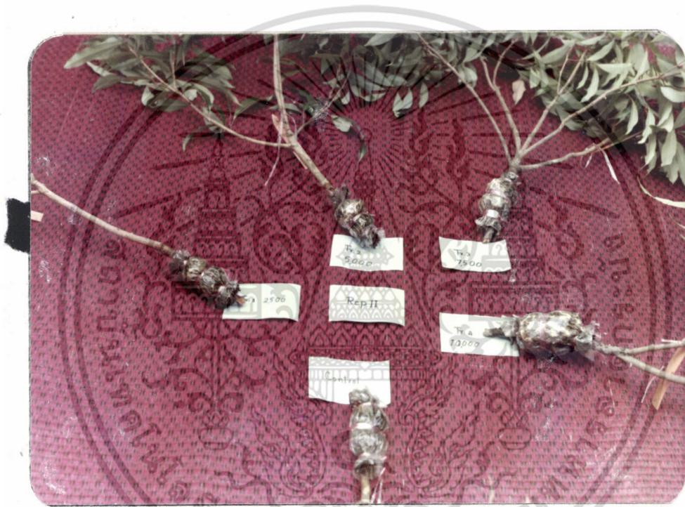
ภาพที่ 3 แสดงกิ่งตอนต้นจี ใน Rep. ที่ 2 ซึ่ง treat ด้วยฮอร์โมน IBA ที่มีความเข้มข้นต่างกัน

เอกสารนี้เป็นเอกสารที่สงวนไว้สำหรับการใช้งานเพื่อการศึกษาเท่านั้น ไม่อนุญาตให้นำไปใช้ประโยชน์ด้านการค้า ไม่ว่าจะกรณีใดๆ ทั้งสิ้น อีกทั้งห้ามมิให้ดัดแปลงเนื้อหา และต้องอ้างอิงถึงเจ้าของเอกสารทุกครั้งที่มีการนำไปใช้