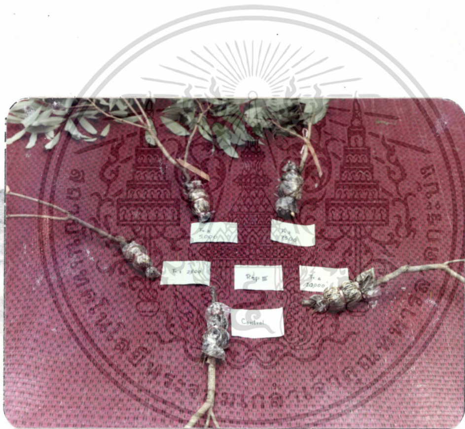
ภาพที่ 4 แสดงกิ่งตอนดินจิโน Rep. ที่ 3 ซึ่ง treat ด้วยฮอร์โมน IBA ที่มีความเข้มข้นต่างกัน

เอกสารนี้เป็นเอกสารที่สงวนไว้สำหรับการใช้งานเพื่อการศึกษาเท่านั้น ไม่อนุญาตให้นำไปใช้ประโยชน์ด้านการค้า ไม่ว่ากรณีใดๆ ทั้งสิ้น อีกทั้งห้ามมิให้ดัดแปลงเนื้อหา และต้องอ้างอิงถึงเจ้าของเอกสารทุกครั้งที่มีการนำไปใช้