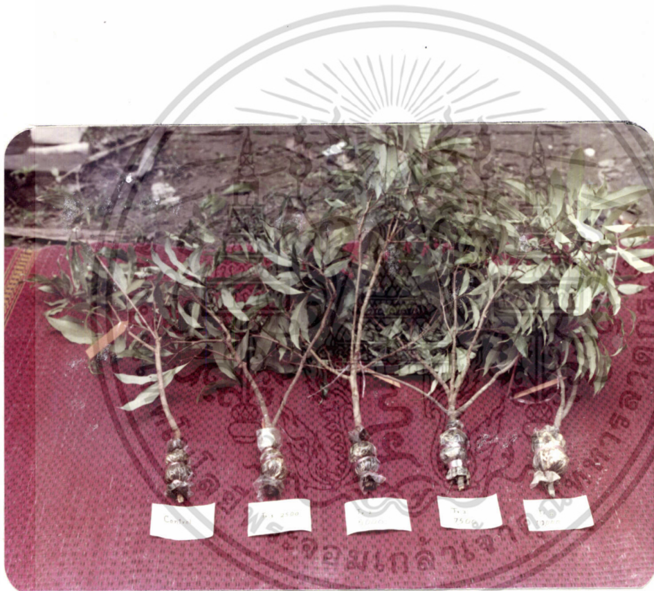
ภาพที่ 7 แสดงกิ่งตอนต้นพืชที่สมบูรณ์ที่สุดในแต่ละ Treatment หลังจากทำการตอน 60 วัน

เอกสารนี้เป็นเอกสารที่สงวนไว้สำหรับการใช้งานเพื่อการศึกษาเท่านั้น ไม่อนุญาตให้นำไปใช้ประโยชน์ด้านการค้า ไม่ว่ากรณีใดๆ ทั้งสิ้น อีกทั้งห้ามมิให้ดัดแปลงเนื้อหา และต้องอ้างอิงถึงเจ้าของเอกสารทุกครั้งที่มีการนำไปใช้