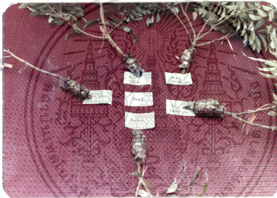
ภาพที่ 2 แสดงกิ่งตอนดีเจ้ ใน Rep. ที่ 1 ซึ่ง treat ด้วยฮอร์โมน IBA ที่มีความเข้มข้นต่างกัน

เอกสารนี้เป็นเอกสารที่สงวนไว้สำหรับการใช้งานเพื่อการศึกษาเท่านั้น ไม่อนุญาตให้นำไปใช้ประโยชน์ด้านการค้า ไม่ว่ากรณีใดๆ ทั้งสิ้น อีกทั้งห้ามมิให้ดัดแปลงเนื้อหา และต้องอ้างอิงถึงเจ้าของเอกสารทุกครั้งที่มีการนำไปใช้