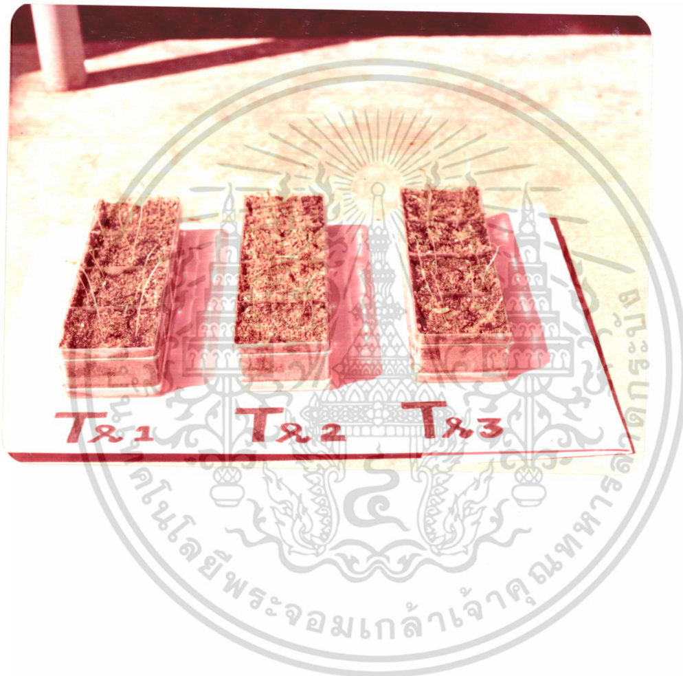
ภาพที่ 2. แสดงอาการผิปรกติของต้นกล้ามะเขือเทศในแต่ละ Treatment

เอกสารนี้เป็นเอกสารที่สงวนลิขสิทธิ์ไว้สำหรับงานเพื่อการศึกษาเท่านั้น ไม่อนุญาตให้นำไปใช้ประโยชน์ด้านการค้า ไม่ว่ากรณีใดๆ ทั้งสิ้น อีกทั้งห้ามมิให้ตัดแปลงเนื้อหา และต้องอ้างอิงถึงเจ้าของเอกสารทุกครั้งที่มีการนำไปใช้